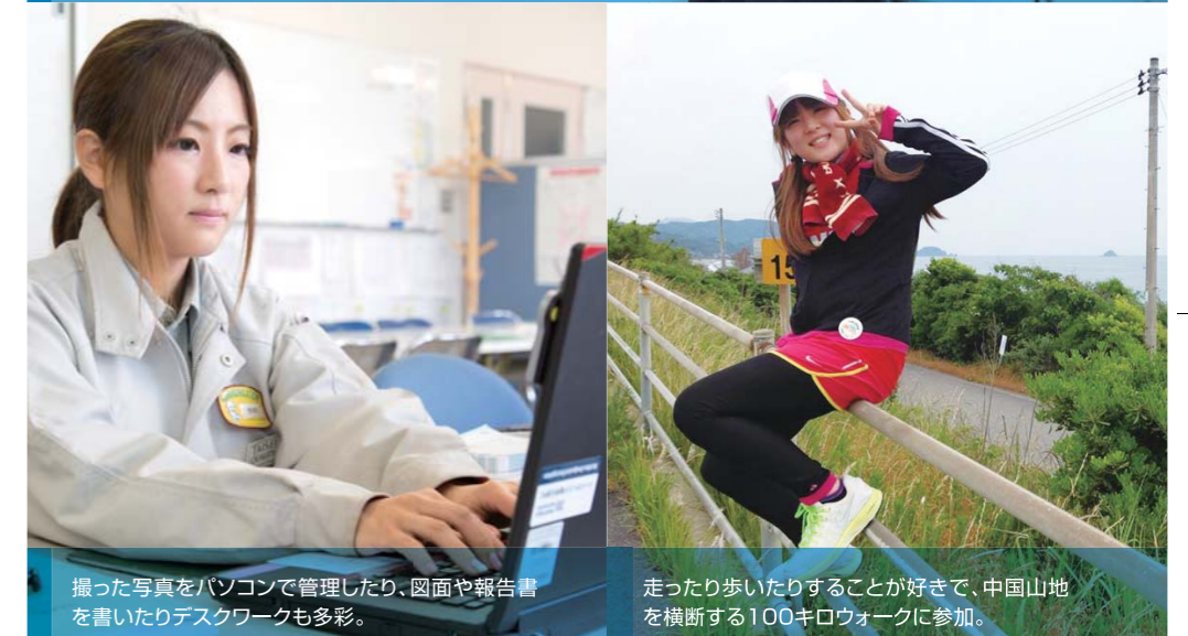
撮った写真をパソコンで管理したり、図面や報告書を書いたりデスクワークも多彩。走ったり歩いたりすることが好きで、中国山地を横断する100キロウォークに参加。