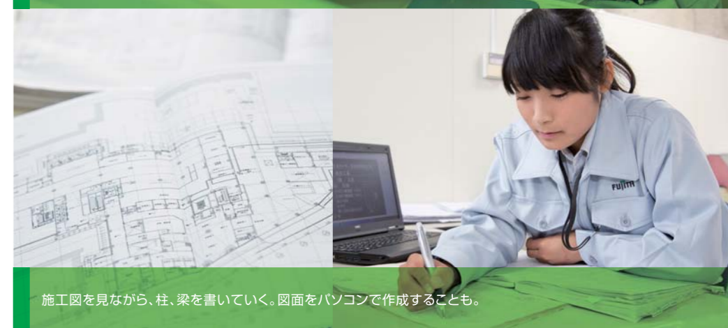
施工図を見ながら、柱、梁を書いていく。図面をパソコンで作成することも。