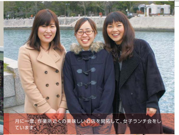
月に一度、作業所近くの美味しいお店を開拓して、女子ランチ会をしています。