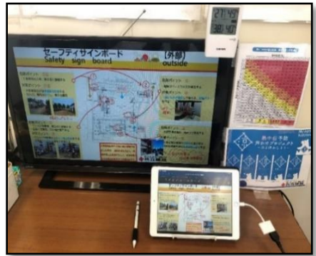
モニター画面拡張