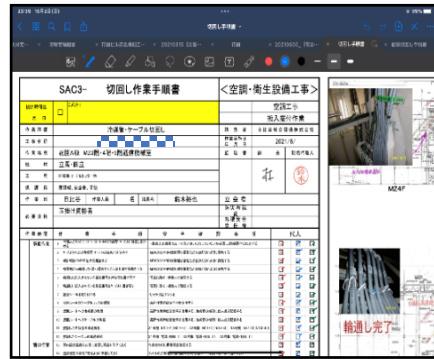
手順書 現地チェック