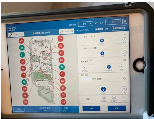
自動で業振り、ダメ帳作成 (SIP)