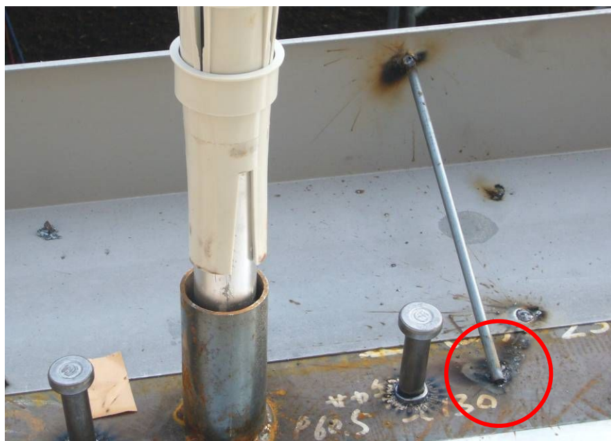
ショートビード溶接

最近では、Z形状およびL形状として先端部で溶接長が取れるタイプのものがあり、こうしたものの採用等でショートビードを回避できます。