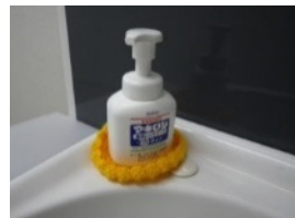
女性用トイレの充