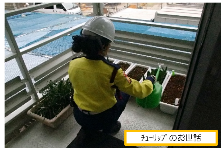
フューリップ®のお世話