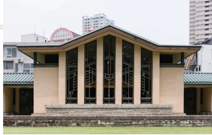
建物内で一番広い部屋であるホールの開口部は、ライトならではの幾何学模様で彩られている。改修前は、窓の下1/3ほどが小さな窓に変更されていた。

出るが、その一方でさまざまな条件に縛られるため、動態保存は不可能ではないかという懸念もあった。しかし、文化庁側の文化財建造物に対する考え方も変化し、建物を使いながら保存する手法も徐々に認められ始めていた。 めには、もとの建物に空調、照明、トイレの変更などの改築を加えることが必要だった。また帝国ホテルにも多用された大谷石は、明日館でも外部、室内、屋外の歩道に使われているが、特に歩道の摩耗が激しく、石と石の間の目地が浮き出ている状態だった。その歩道部分のみ、ほかのもっと固い石に変更したいという要望も出された。 五十六項目のうち、空調、照明、トイレの変更は文化庁にも認められたが、そのほか認められたもの、認められなかったものはさまざま。一九九九年（平成十一年）年から動態保存を視野に置きながらの保存修理工事が始まった。そこから明日館は、建物を使いながら保存するという新たなステージに踏み出していく。