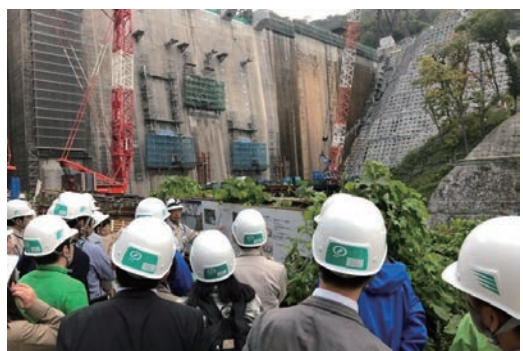
「ハツ場ダム」見学会