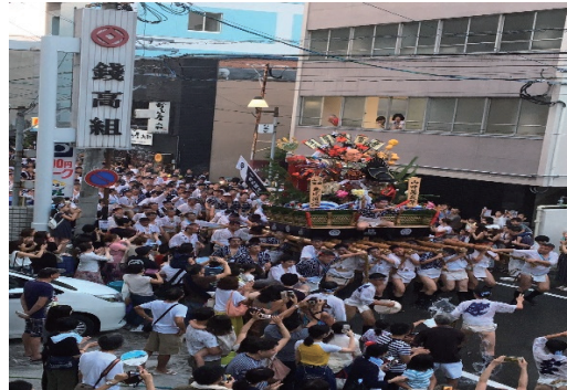
博多祇園山笠勢い水等の提供