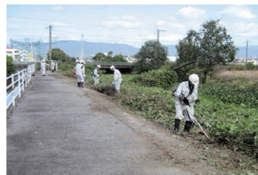
市の江川副幹線水路 清掃活動