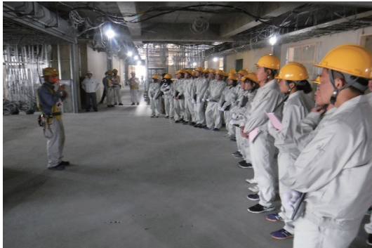
工業高校の現場見学会