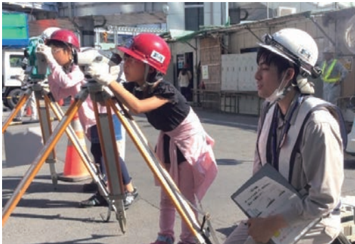
サマースクールで測量体験