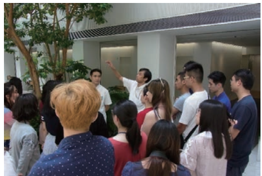
東京大学 東洋文化研究所に協力