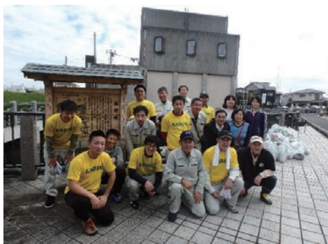
水戸市桜川一斉清掃