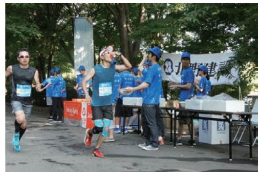
小布施見にマラソン