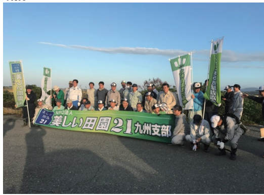
旧玉名干拓施設の草刈り