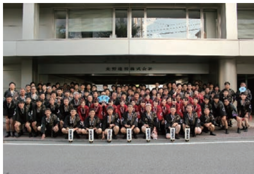
長野びんずる祭り