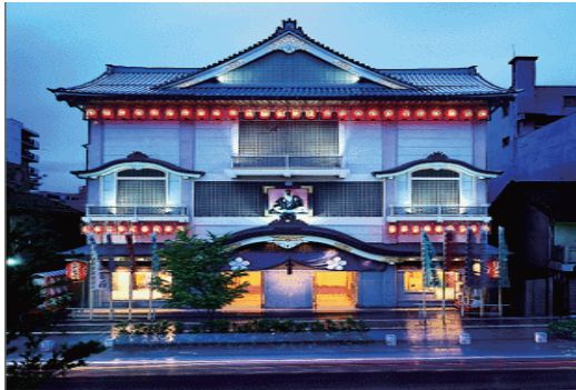
芸術文化活動 北野文芸座