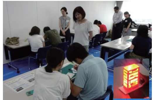
「アビリティチャレンジ」模型製作