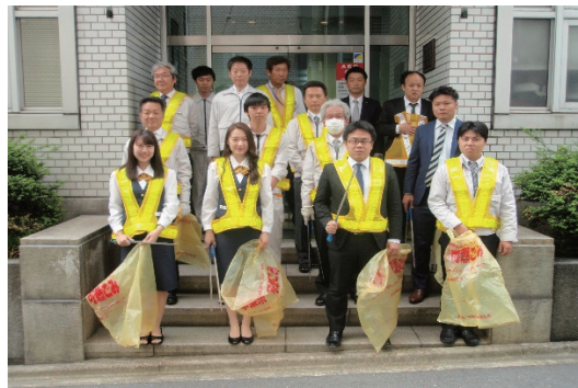
「桜通り」の清掃活動