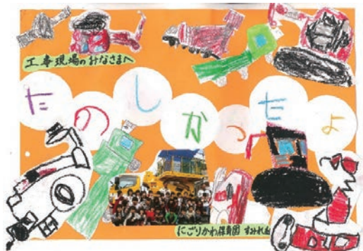
保育園での職業体験会