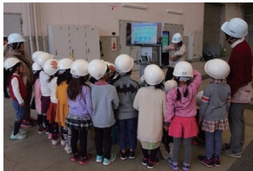
技術研究所で見学会を開催