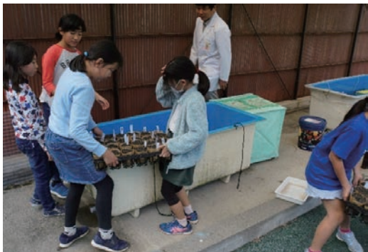
小学校と協働でアマモの苗づくり