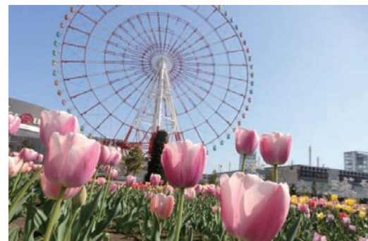
臨海副都心チューリップフェスティバル