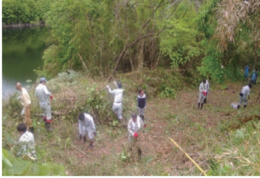
御前山ビオトープ育成作業