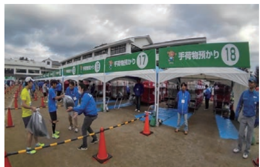
水戸マラソン大会ボランティア