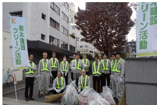
株木建設クリーン活動