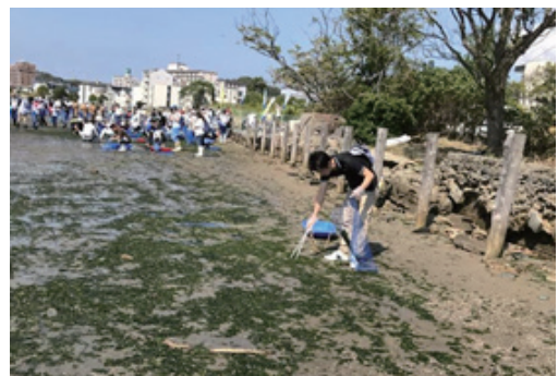
福岡市「和白干潟あおさの清掃活動」