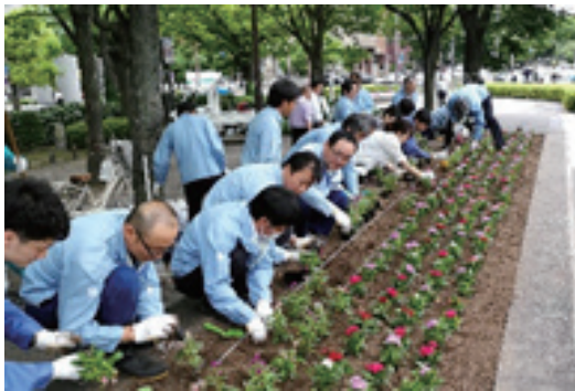
広島市「グリーンパートナー事業」