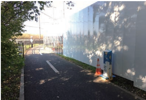
電動空気入れ設置