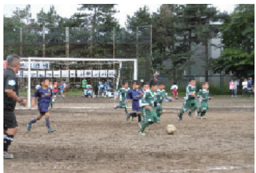
ちびっこサッカーフェスティバル