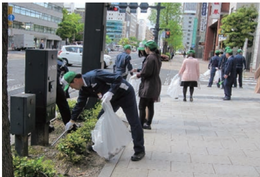
ボランティア・ロードの清掃活動