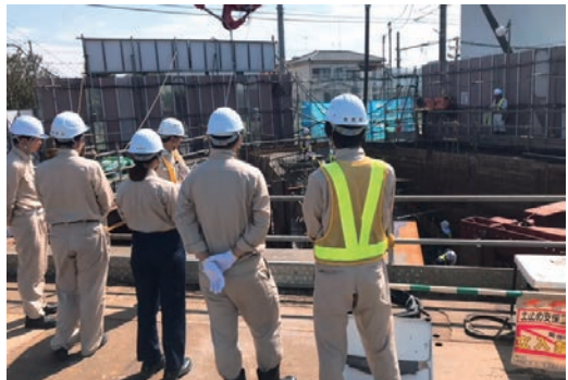
インターンシップの受入