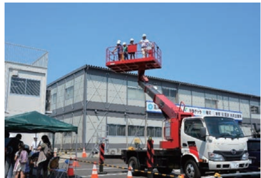
夏の科学イベントに出展