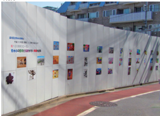
仮囲いに児童の絵画作品を展示