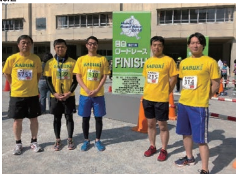
目白ロードレースへの協賛・参加