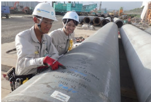
インターンシップ受け入れに協力