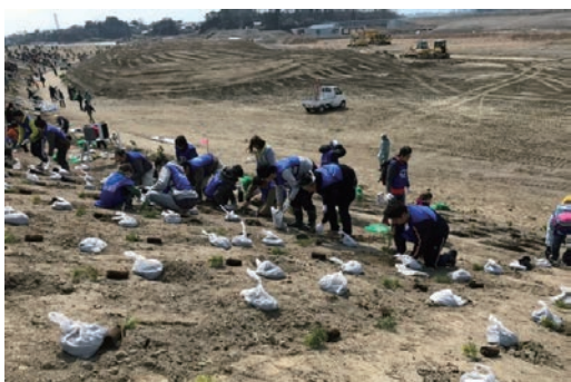
「釣師防災緑地植樹祭」植樹作業