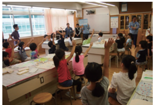
小学校4年生への環境学習