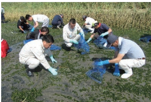
和白干潟あおさの清掃活動