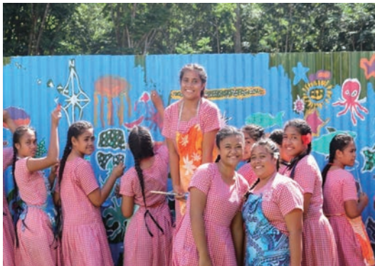
サモアで現場仮囲いにペインティング