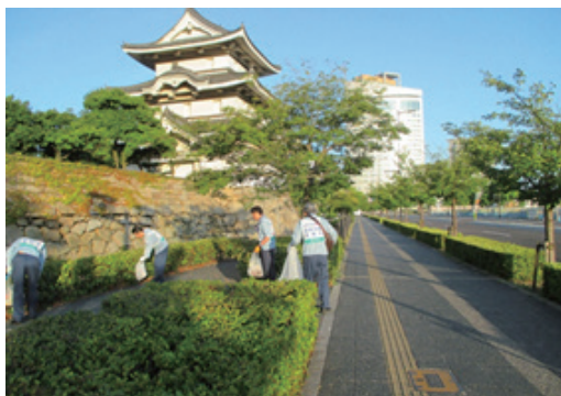
「88クリーンウォーク四国」