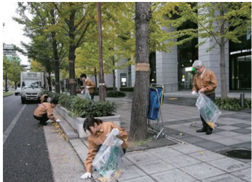
大阪マラソンクリーンアップ作戦