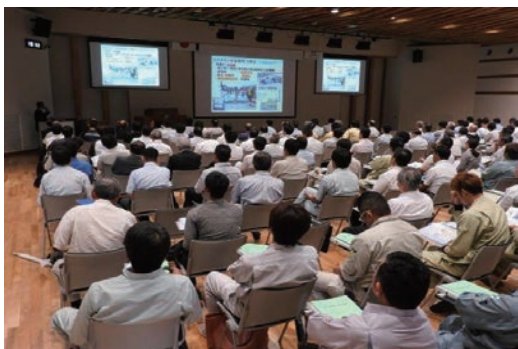
橋梁床版維持補修に関する講習会