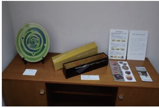
伝統的工芸品の普及活動