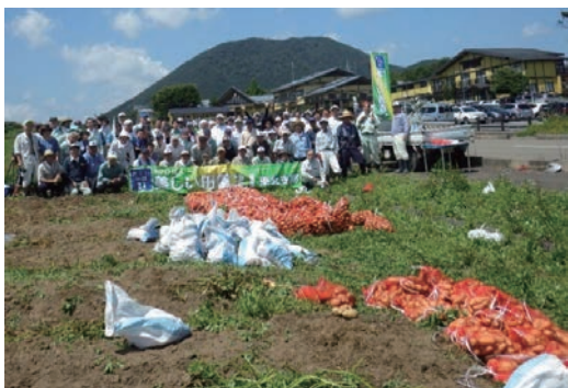
薬菜山麓耕作放棄地解消活動 8月