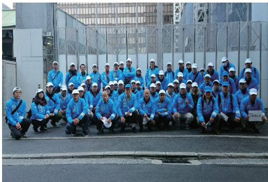
大阪マラソンのボランティア活動