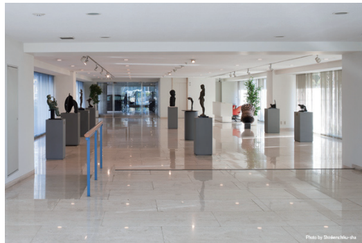
芸術文化活動 彫刻ギャラリー