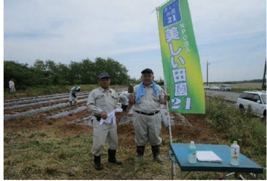
薬菜山麓耕作放棄地解消活動 6月