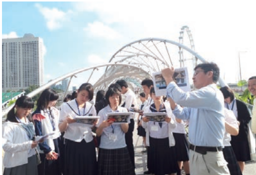
ザ・ヘリックス&amp;バイフロント・ブリッジを見学