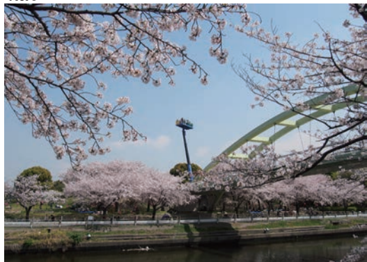
さくらまつりで「さくら展望」