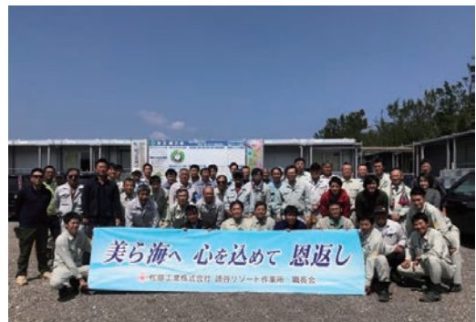
第1回読谷リゾートクリーンアップ作戦