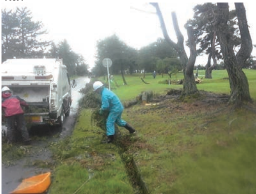
台風被害の対応応援