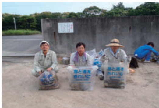
玉島クリーンアップ作戦