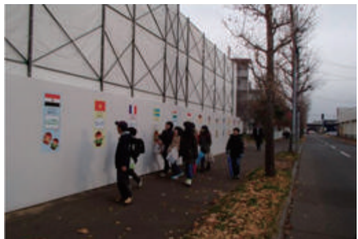
通学路沿いの仮囲いにマンガ看板設置