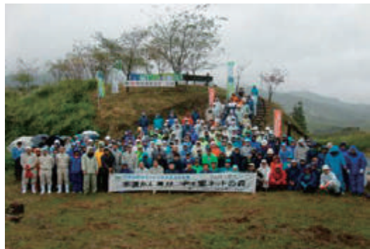
水源かん養林の草刈