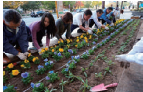
グリーンパートナー事業