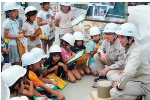
技術研究所で土木の日見学会を開催