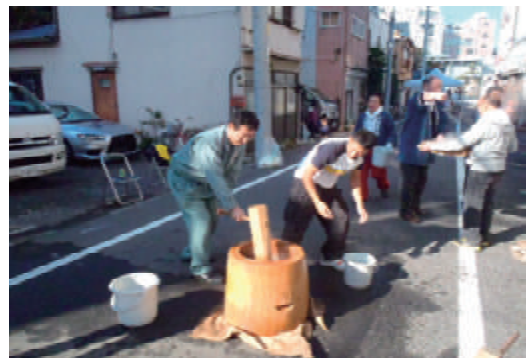
町内会餅つき大会への参加、協力