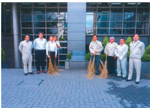
千代田区一斉清掃