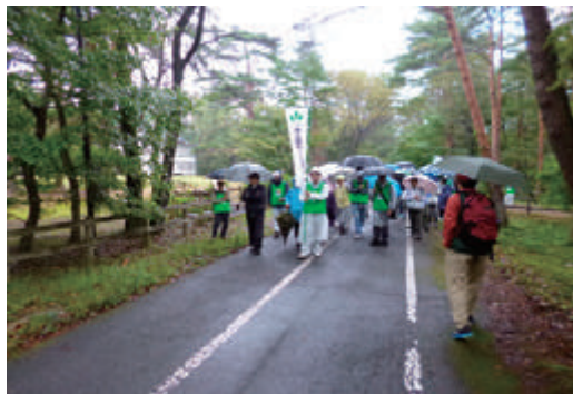
那須野ヶ原ウォークへの参加