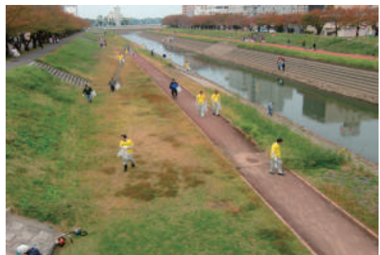
桜川水系クリーン作戦