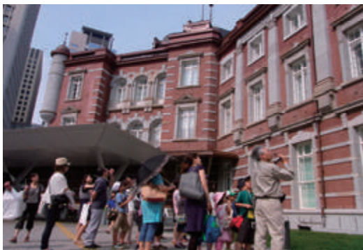
完成した東京駅丸の内駅舎を見学