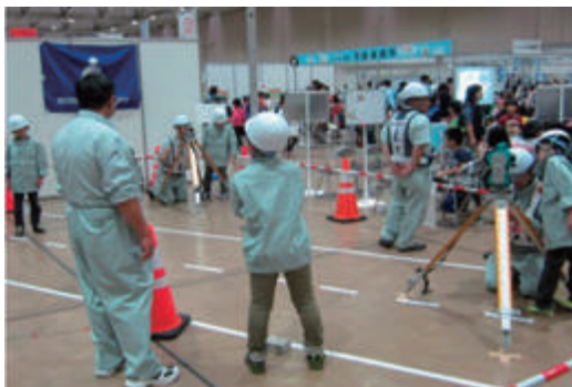
こどものまち「ミニさっぽろ2013」