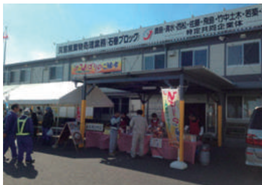
工事事務所で定期市を開催