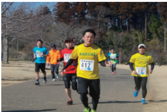
協賛市民マラソン大会への参加