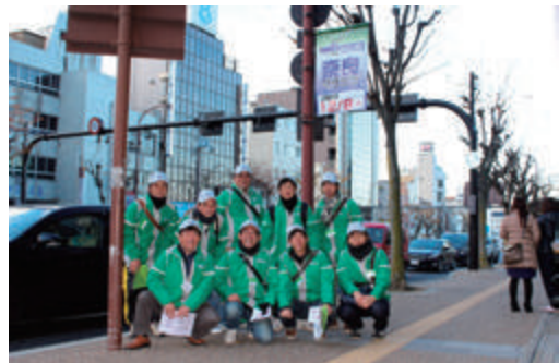
奈良マラソン運営ボランティア