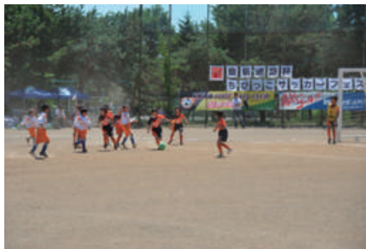
ちびっこサッカーフェスティバル