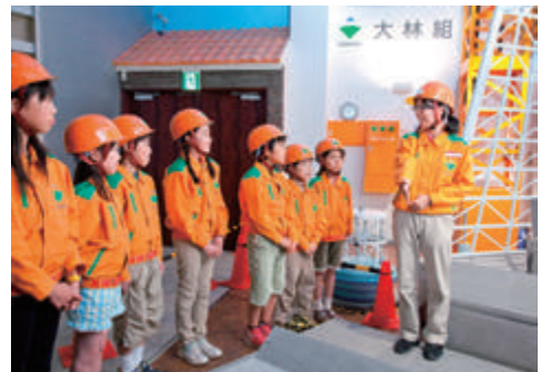
「キッズニア」に建設パビリオンを出展