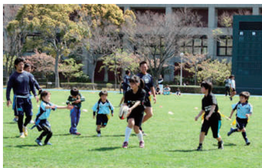
気仙沼の小学生とタグラグビー交流会