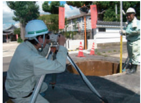
インターンシップ受け入れ