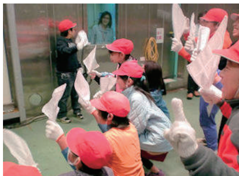
「土木の日」に小学生を技術研究所に招待