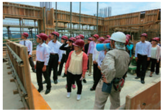
教員が建築現場を見学する様子