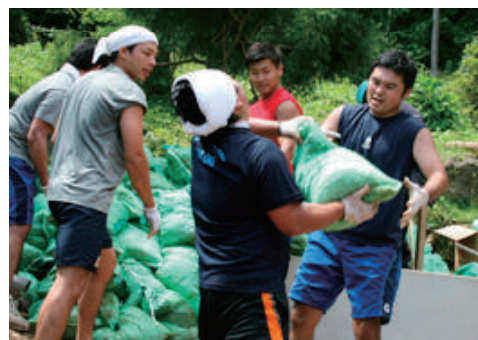
被災地（宮城県気仙沼市）でのボランティア活動