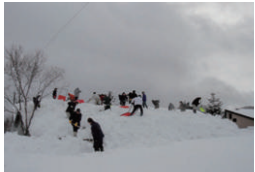
除雪ボランティア活動