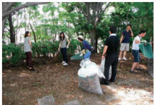
都立潮風公園にて清掃活動を実施