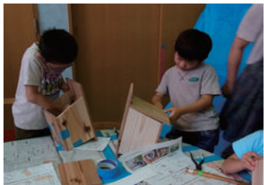
社宅で環境教育として巣箱を制作