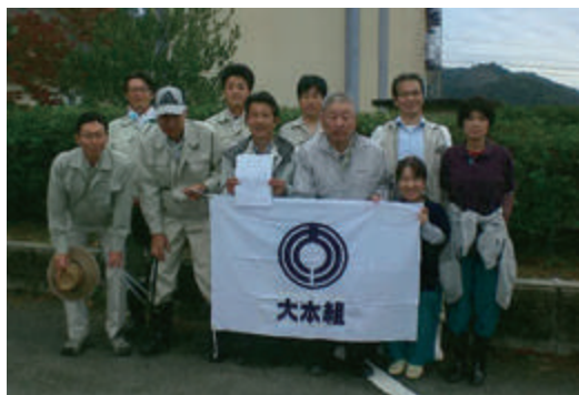
笠岡湾干拓地内清掃作業