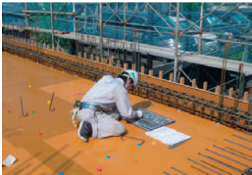
インターンシップの受け入れ