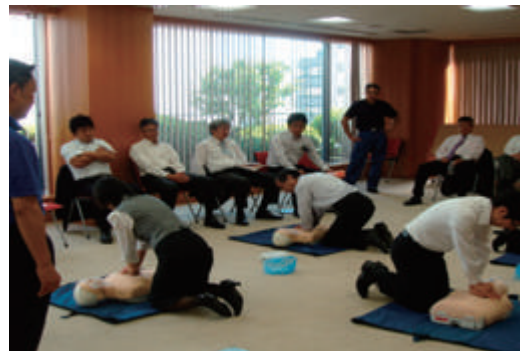
救命技能講習・東京消防庁