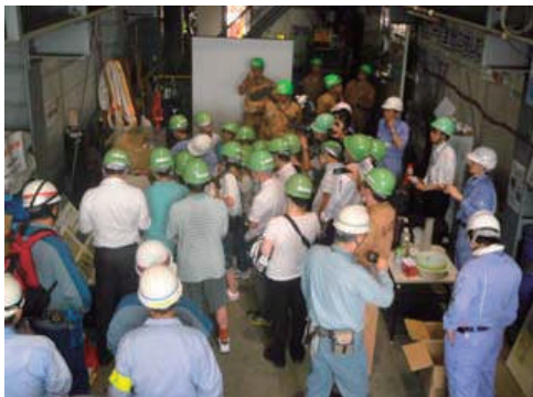
親子現場見学会の開催