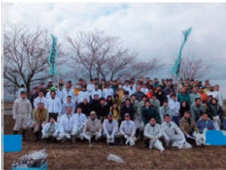
福島潟クリーン作戦