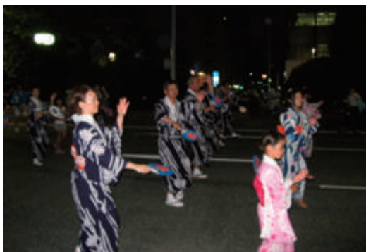
新潟夏祭り 民謡流しに参加