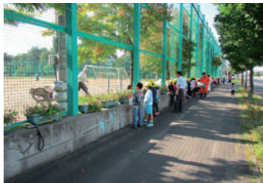
前田中央小学校プランター撤去