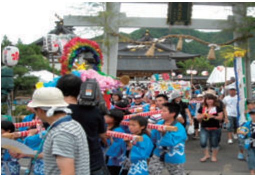
湯島天神信濃分社例大祭 運営協力