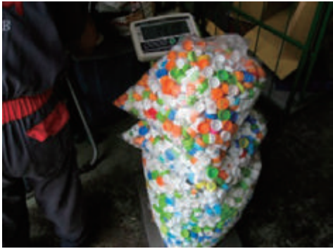
エコキャップ推進活動