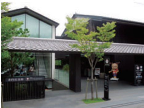
奥村記念館の運営