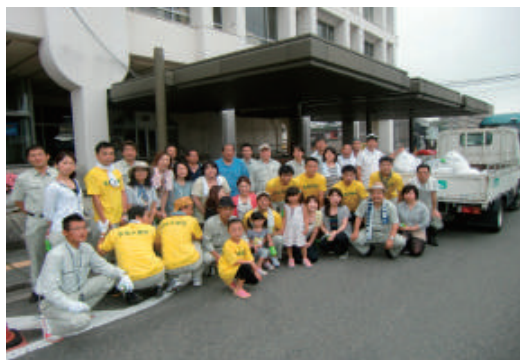
河川敷一斉清掃奉仕活動