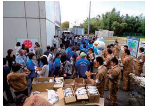
防災訓練への参加（炊出配付）