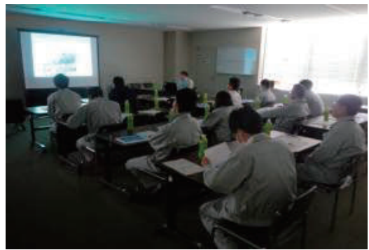
現場実務研修会の開催