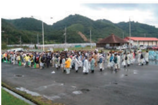
笠岡湾干拓地内清掃活動