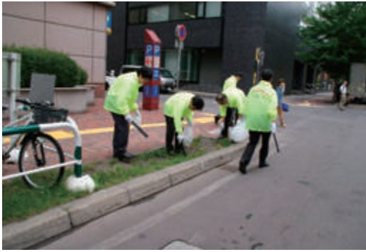
アダプト環境美化活動