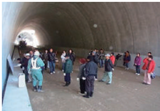
地域住民を招いたイベントの開催