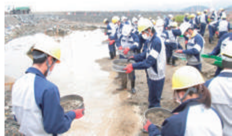
東日本大震災被災地ボランティア