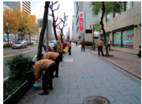
事業所周辺の清掃作業