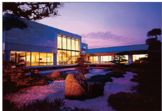
芸術文化振興活動・北野美術館