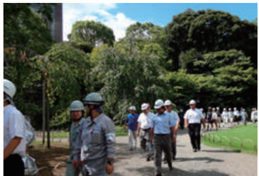
BCP訓練・避難訓練を実施