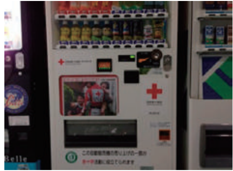
日本赤十字社支援自販機