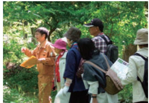
キンラン観察会の開催