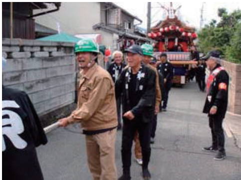
地元秋祭りへの参加