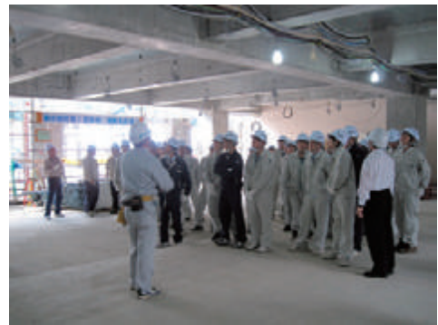
現場見学会の実施