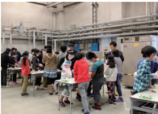
技術研究所でコンクリートの実験