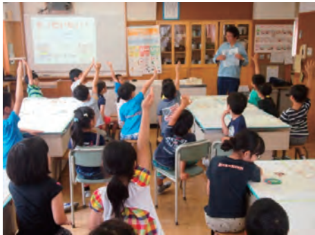
地元小学校に環境学習を実施