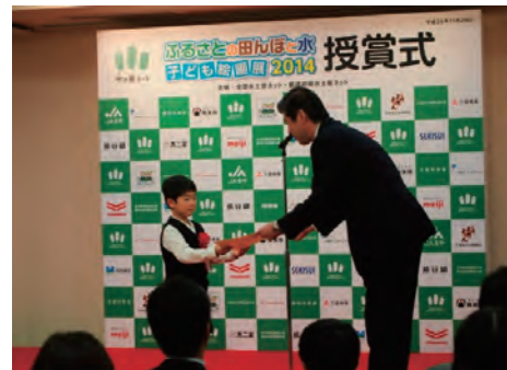
子ども絵画展への協賛