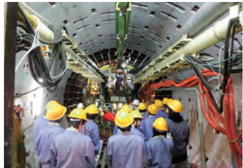
未来の技術者がシールド工事を学ぶ