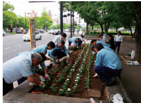
グリーンパートナー事業に参加