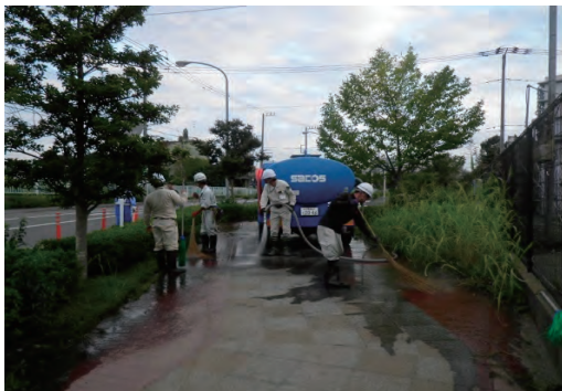
台風で冠水した道路の清掃