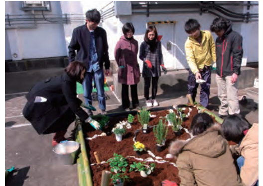
屋上で廃材等を利用して庭園づくり