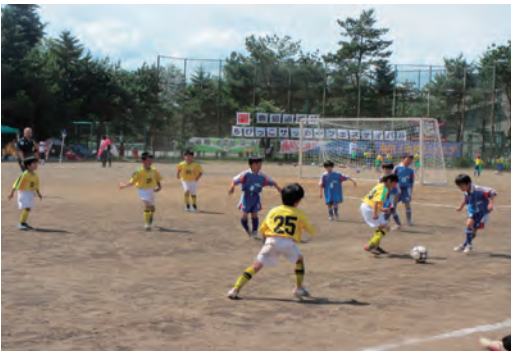
ちびっこサッカーフェスティバル