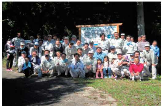
「企業の森」事業に参画