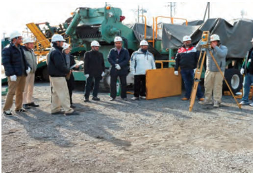
クウェート国 舗装技術研修