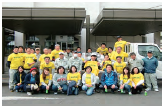
桜川河川敷一斉清掃奉仕活動