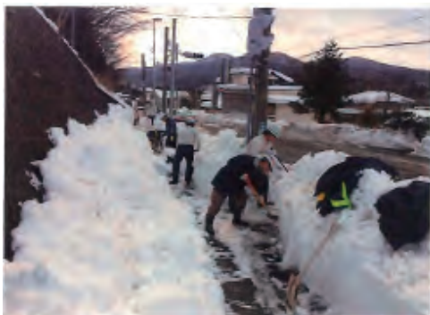
遠刈田小学校校門前の除雪作業