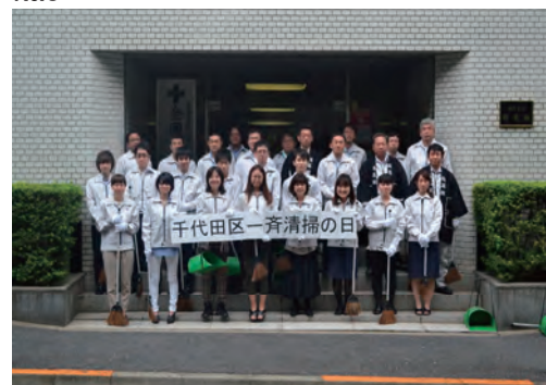
事業所周辺の清掃活動