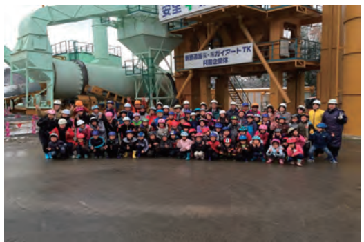
新東名岡崎舗装工事合材工場見学