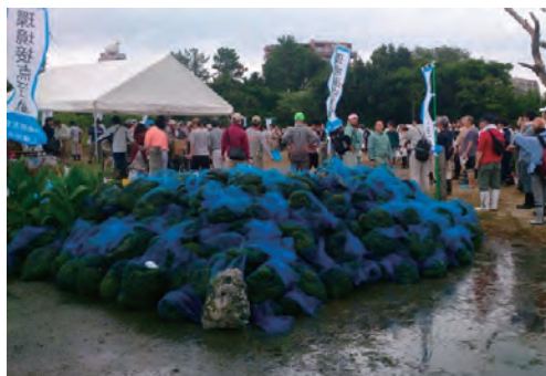
干潟清掃活動に参加