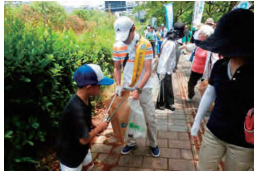
きれいなひろしま・まちづくり清掃活動