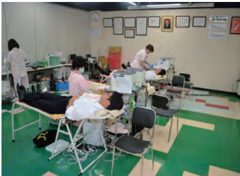
社屋内での献血活動の実施