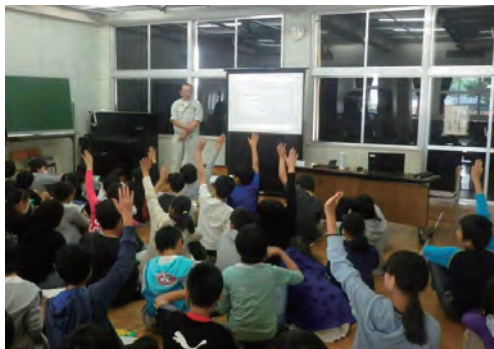
作業所長が小学生に出前授業