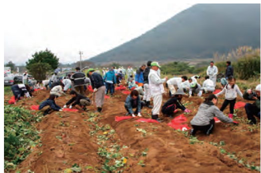
耕作放棄地解消支援活動