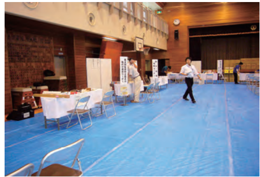
「防災フェア」への参加