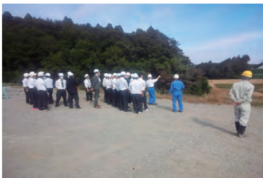
現場見学会（地元工業高校生）