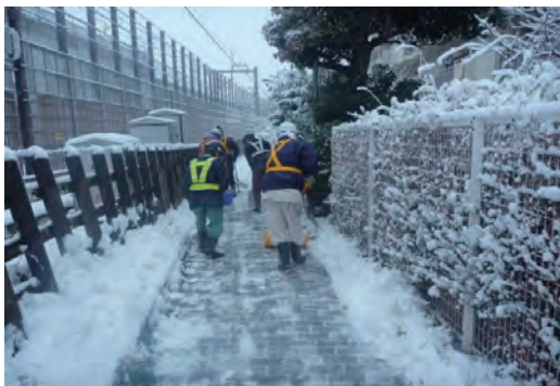
現場周辺道路の除雪活動