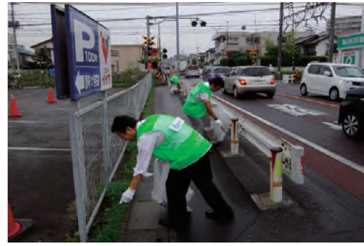
彩の国ロードサポート制度