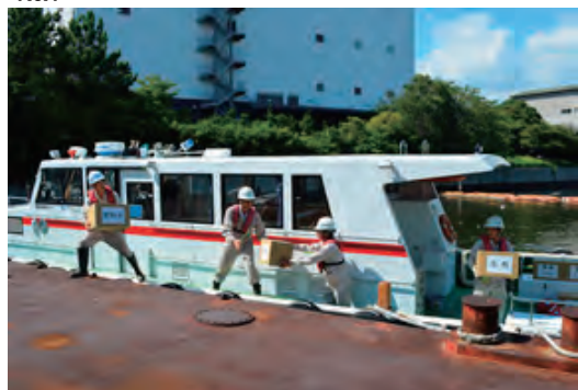
BCP訓練にて海上輸送訓練を実施