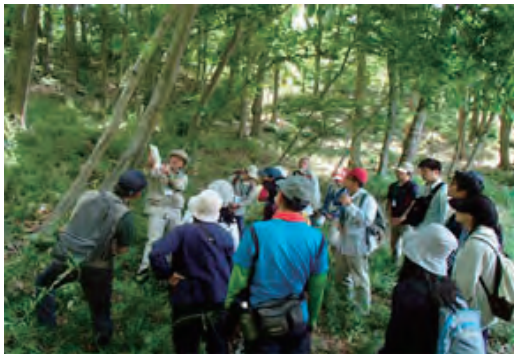
自然観察指導員講習会へ共催と参加