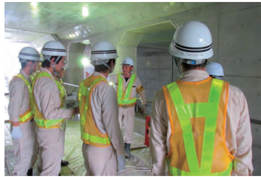
インターンシップ生の受け入れ