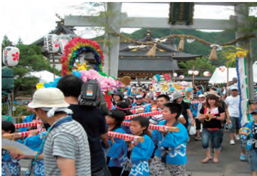
湯島天神信濃分社例大祭 運営協力