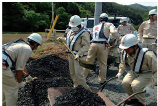
岩手県大槌町でのボランティア