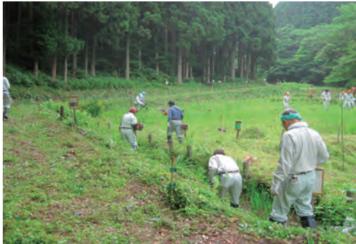
御前山ビオトープ育成作業