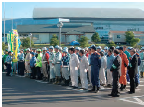
秋の交通安全運動の参加