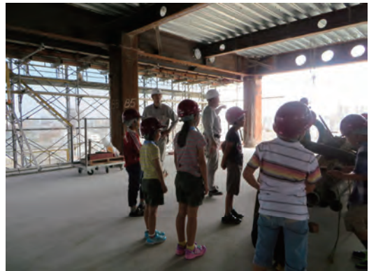
夏休みに地元小学生が現場見学