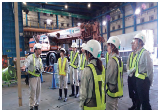
教員の民間企業研修に協力