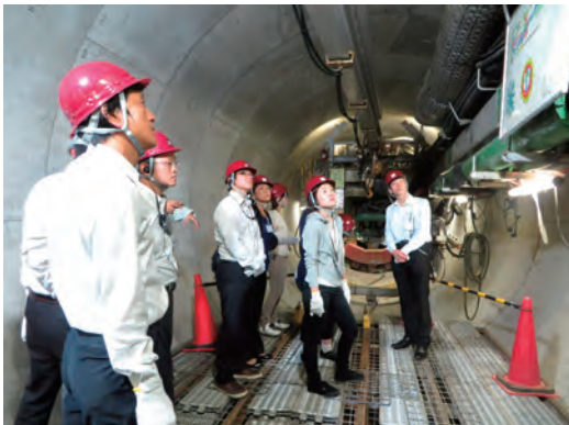
教員の方々が都内のシールド現場を見学