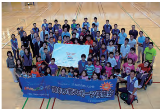
障がい者スポーツを支援