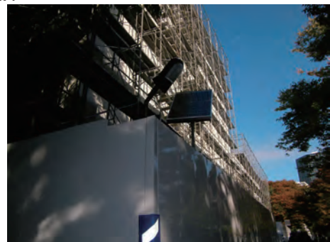
太陽光発電の照明設置