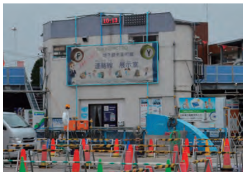
地下鉄工事PR展示室 来場者が1.4万人