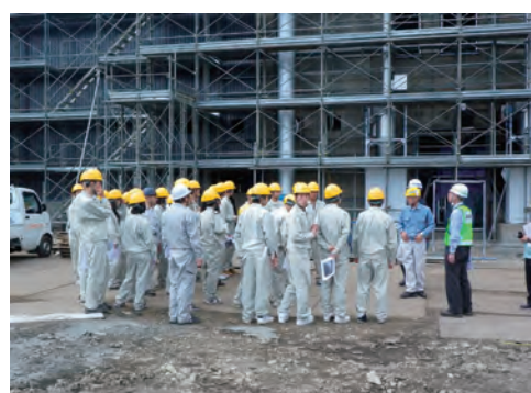
現場見学会の実施