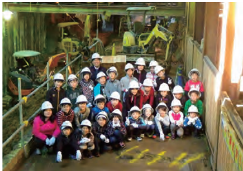
地元小学生が地下鉄現場を見学