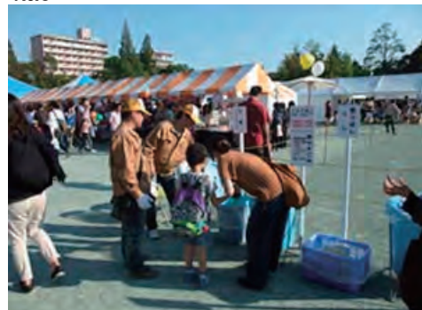
区民祭りでのボランティア活動