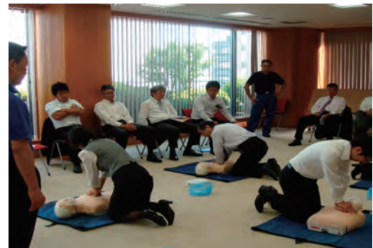
救命技能講習 東京消防庁