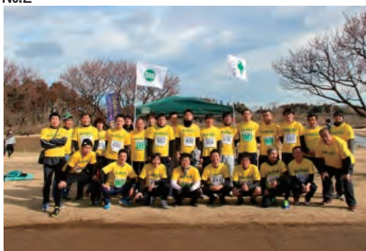
協賛市民マラソン大会への参加