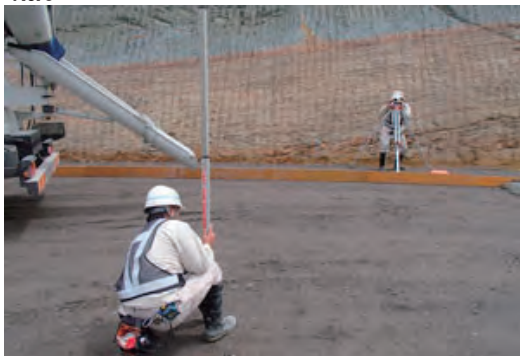
インターンシップ受け入れ