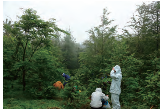
大崎八幡宮 草刈りボランティア