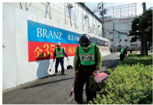
safe work勝島 クリーン運動