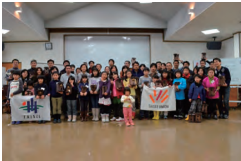
「ヤマネの巣箱づくり」ボランティア