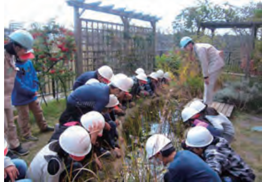
技術研究所見学会