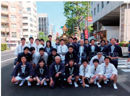
「三崎稻荷神社例大祭」への参加