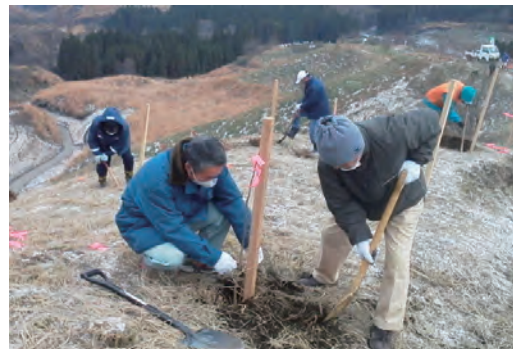
美土里ネットの森植樹ボランティア