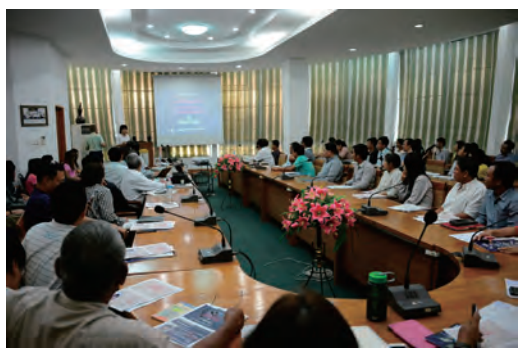
ミャンマー耐震技術セミナー