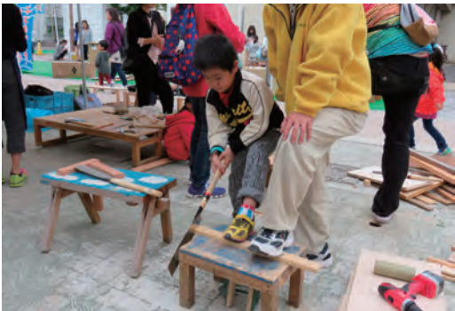
子どものまち・いしのまき