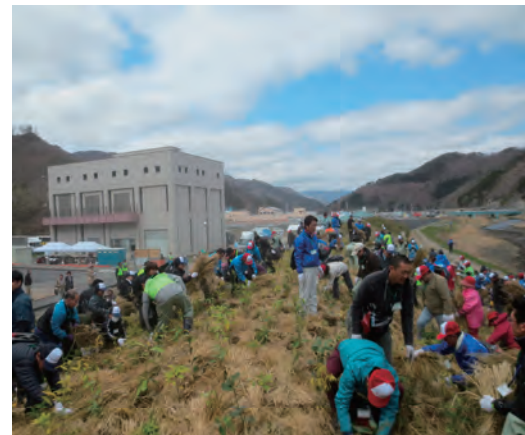
第3回平成の杜植樹会へ参加