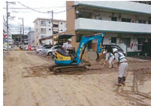
近隣市道の汚泥撤去