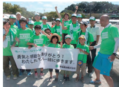
リレー・フォー・ライフへの協賛