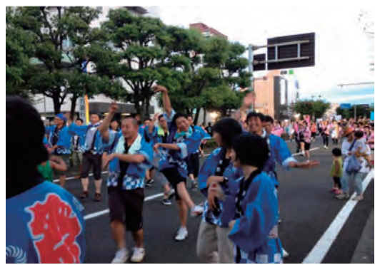
清水港まつりへの参加