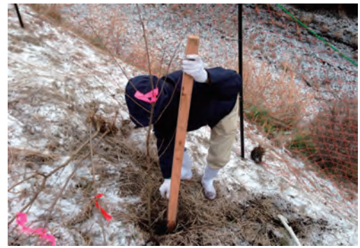
「水土里ネットの森」補植