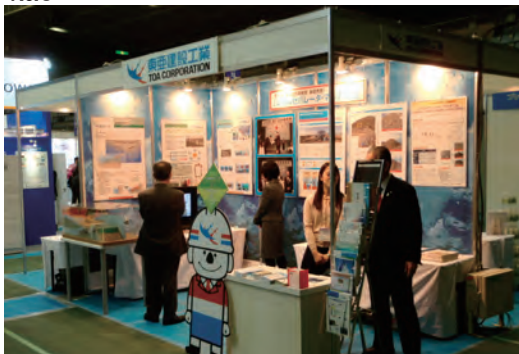
川崎国際環境技術展2014