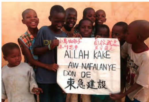
マリ共和国への衣料品支援活動