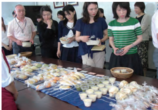
特別支援学校のパン即売会