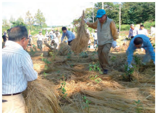
「新しい鉄道林」植樹式に参加