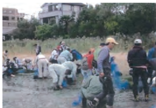
和白干潟あおさの清掃活動