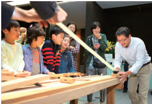
子ども体験教室「木を削ろう」