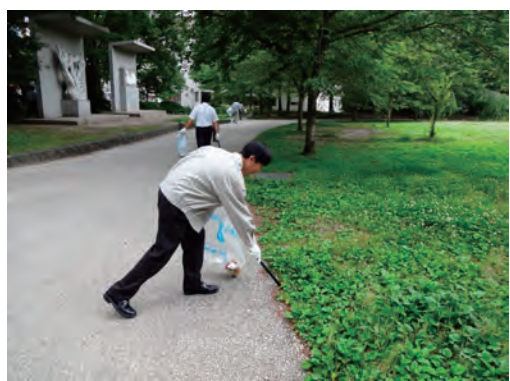
地域清掃活動への参加