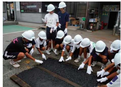
打ちたての舗装に触れる生徒たち