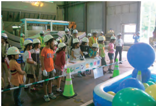
地元小学生及び親子見学会の受入