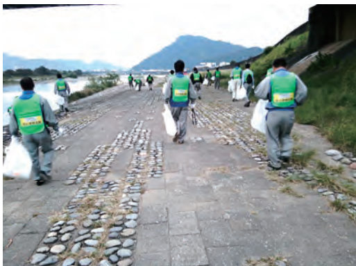
「長良川を美しくしよう運動」