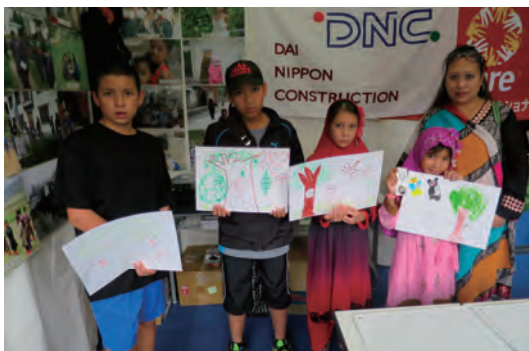
絵画交換を通じた国際交流