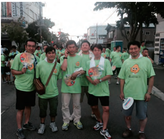
「函館港まつり」参加