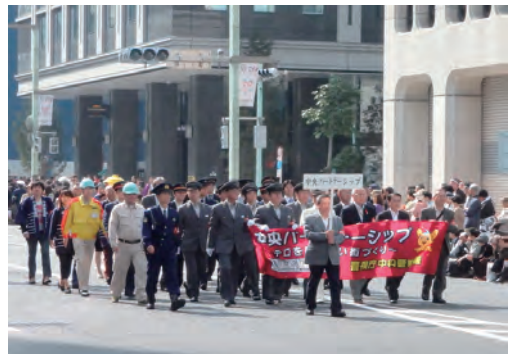
日本橋・京橋まつり