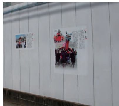
仮囲いを通じたお祭りへの協力