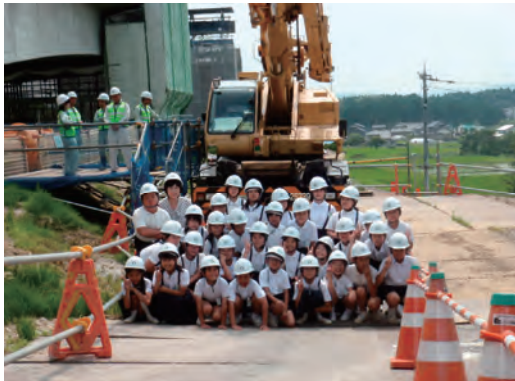
現場見学会の開催