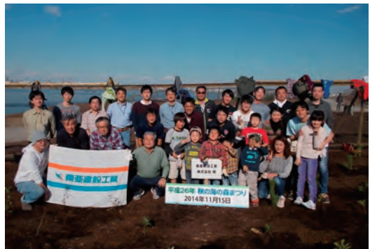
「海の森」植樹ボランティア