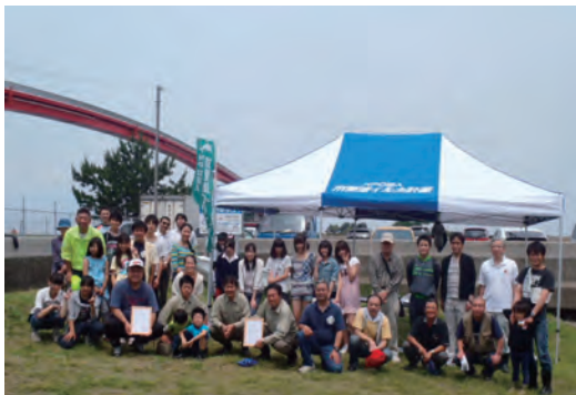
「木更津イルカ計画」清掃活動