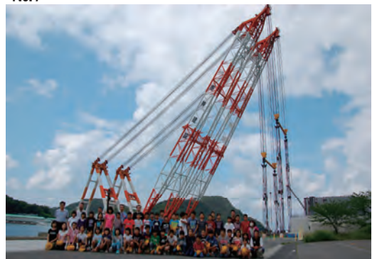
地元小学生現場見学会