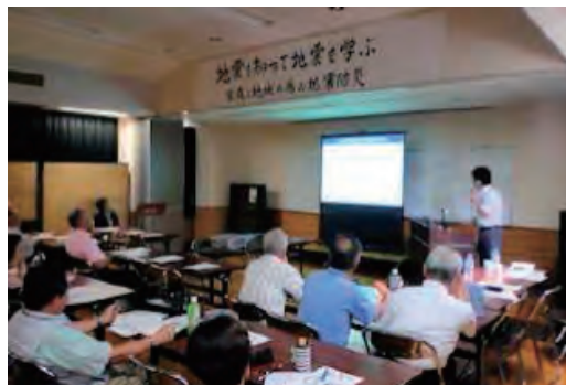
平成25年度防災講演会：講演