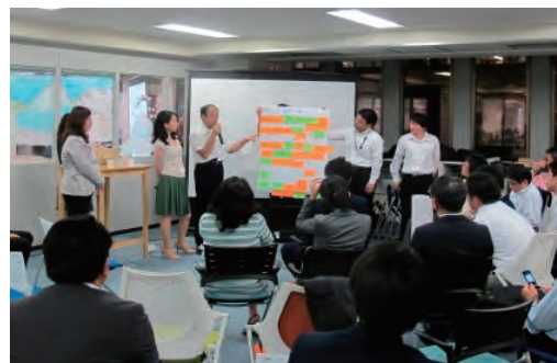
「レジリエンスの未来」でダイアログ