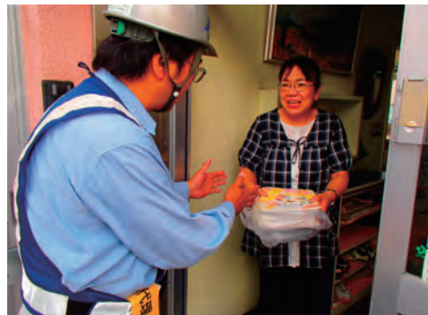
教育施設への「童話の花束」寄付