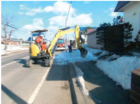
排除雪で交通障害を解消