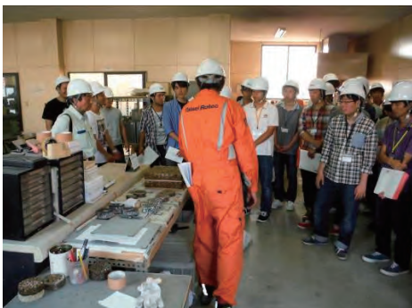
製造現場で学ぶ授業