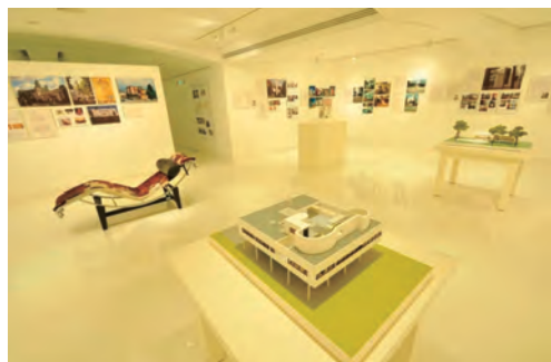
ギャラリー・タイセイ会場風景