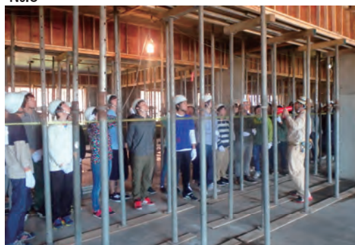
学生向け現場見学会