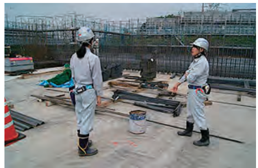
インターンシップ生受け入れ