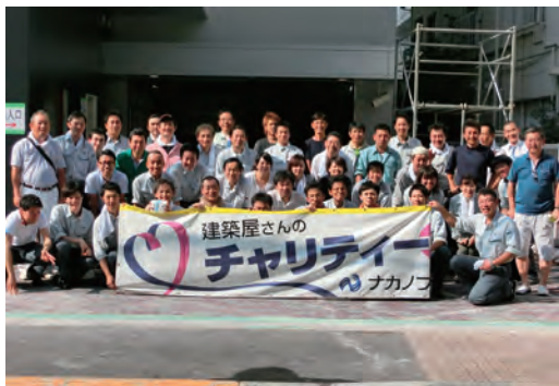
建築屋さんのチャリティー