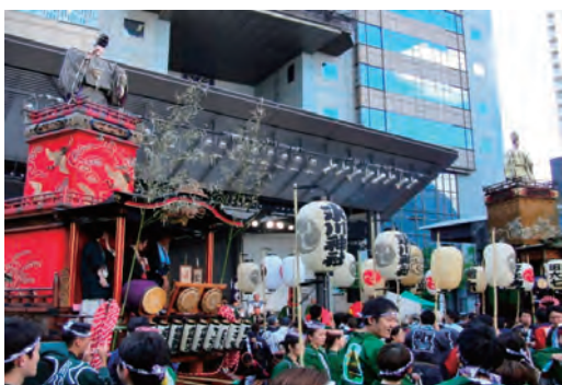
赤坂氷川祭への参加