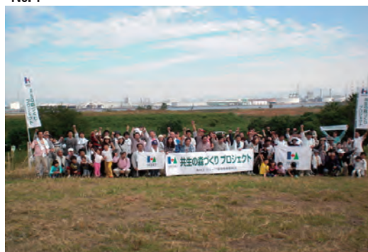
共生の森づくりプロジェクト