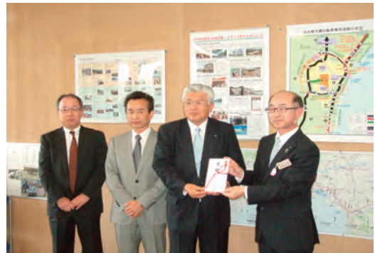
東日本大震災 遺児孤児への義援金