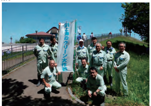
地域美化活動への参加