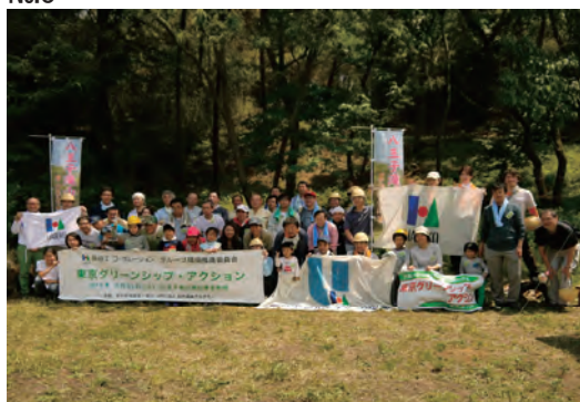
東京グリーンシップ・アクション