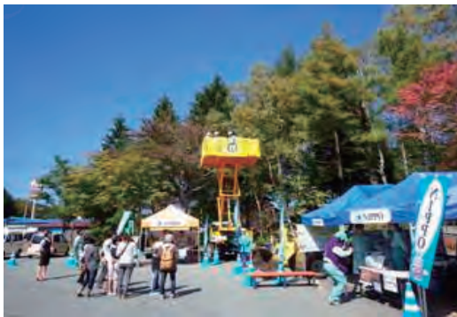
岩手・区界まつりでの建設機械の試乗