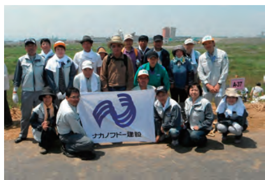
千年希望の丘植樹祭