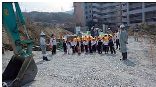
保育園児たちへの現場見学会