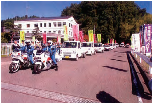
交通安全パレードへの参加