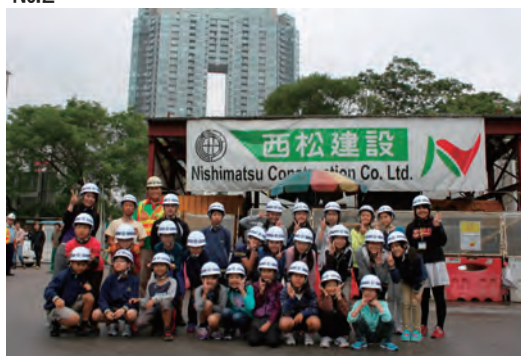
香港日本人小学生向け現場見学会