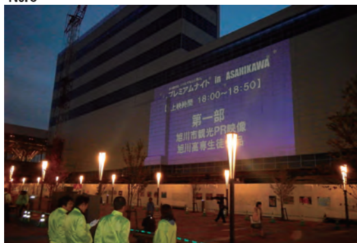
プロジェクションマッピング