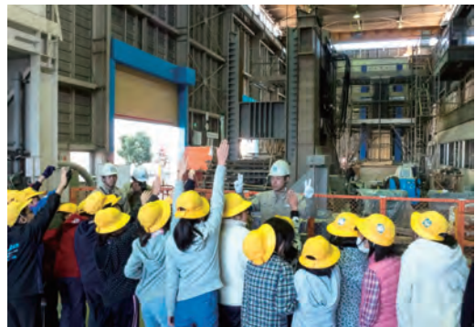
研究所見学会の実施