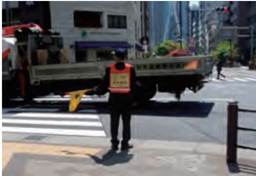
交通安全運動への協力