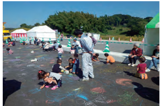
わくわくふれあいフェスタ