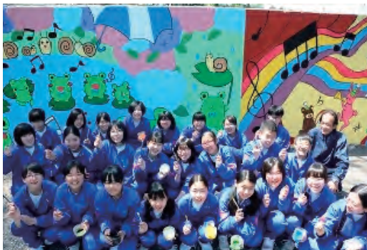
栃木・壬生中学による合材工場外壁壁画