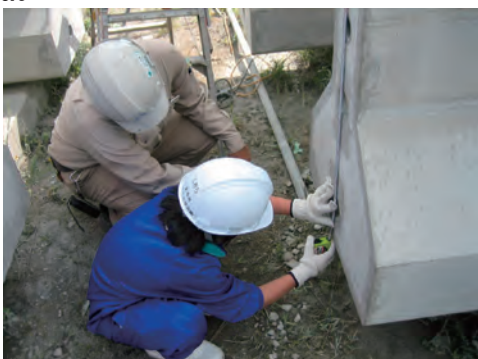
職場体験学習の受入