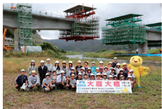
小学生による現場見学会