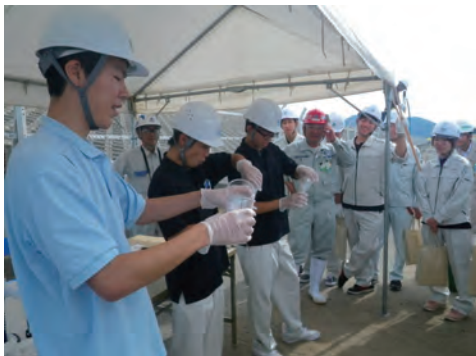
現場見学会の開催