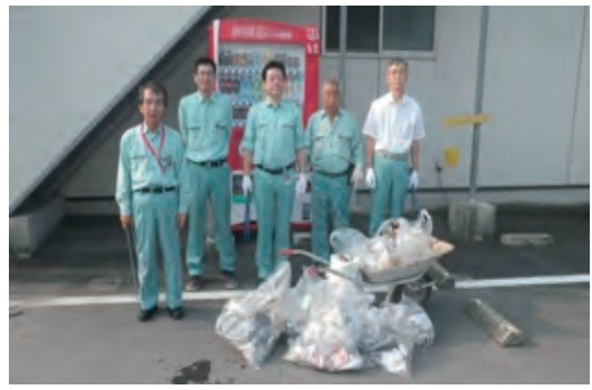
鹿児島・鹿児島市での清掃活動