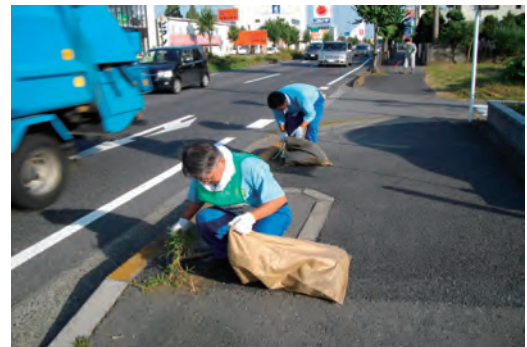
国道16号線清掃活動