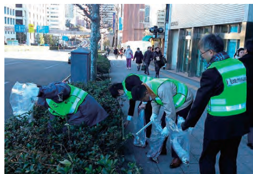
赤坂地区清掃活動