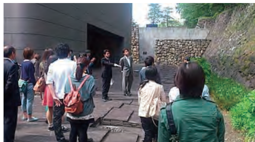
B C S 賞 学生見学会