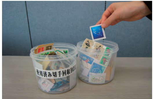
使用済み切手の回収活動