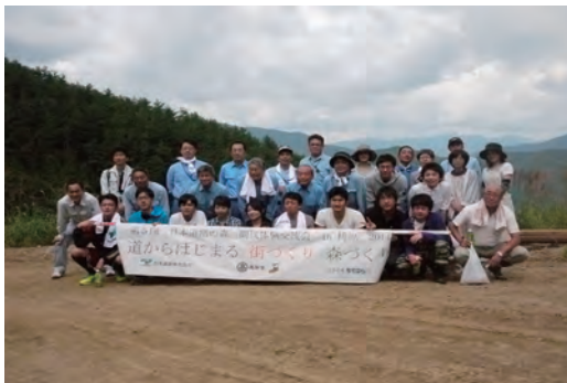
「日本道路の森」間伐体験会