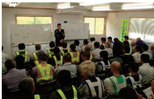
交通安全への取り組み