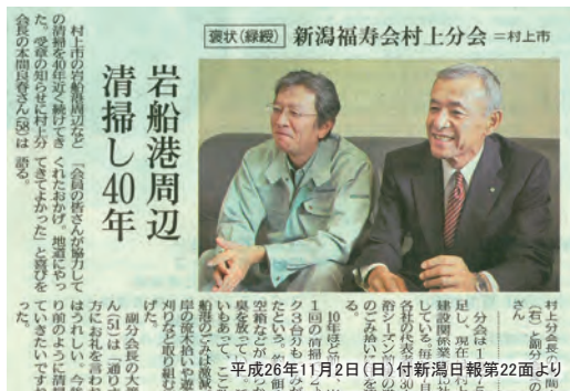
岩船港環境保全における緑綬褒状受章