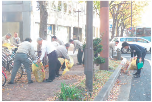
地域清掃活動の実施