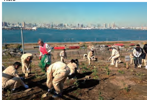
海の森植樹イベント