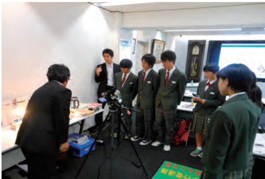
中学生の職場体験