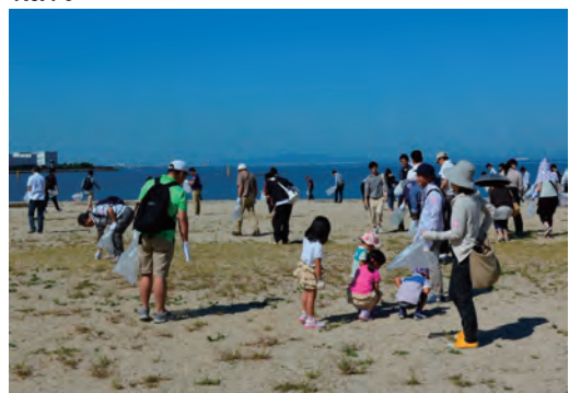
地域清掃活動への参加