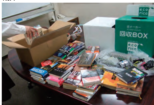
国際協力活動「ステナイ生活」