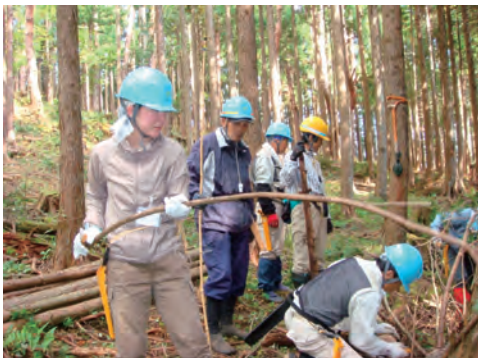
間伐ボランティア活動への参加