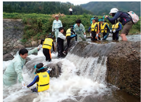
環境体験教室の実施