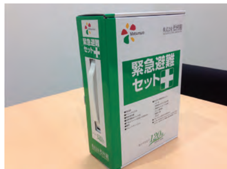
松村組B C P 緊急避難セット