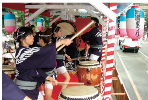
万代太鼓福鵬会 新潟まつり太鼓演奏