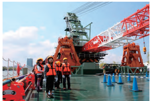
小学生による当社作業船見学会