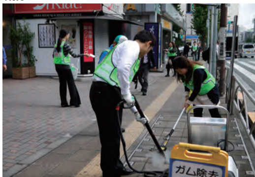
芝地区クリーンキャンペーン