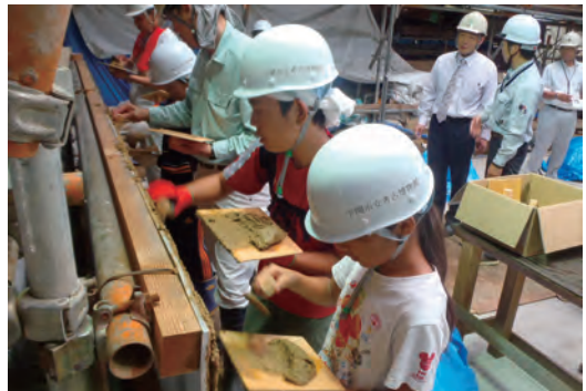
功山寺に於ける土塀修復イベント