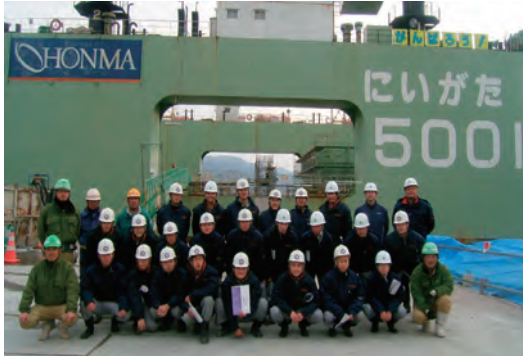
高校生による港湾土木工事現場見学会