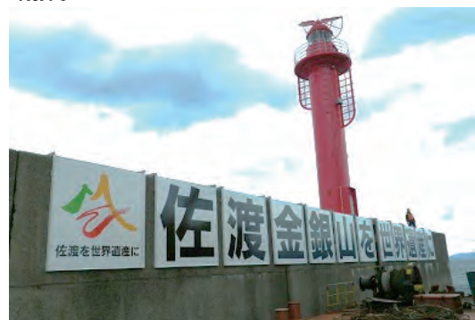
佐渡金銀山世界遺産登録に向けた支援