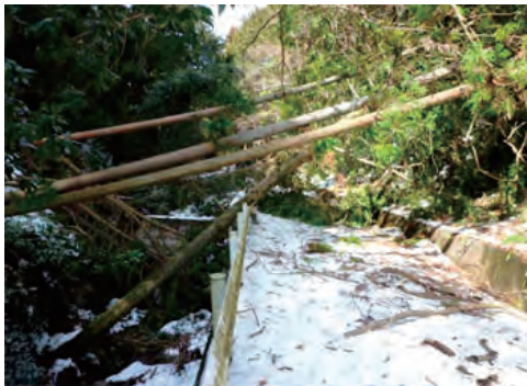
山梨県南部町で町道除雪と倒木処理