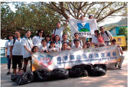
香港支店 海岸清掃活動