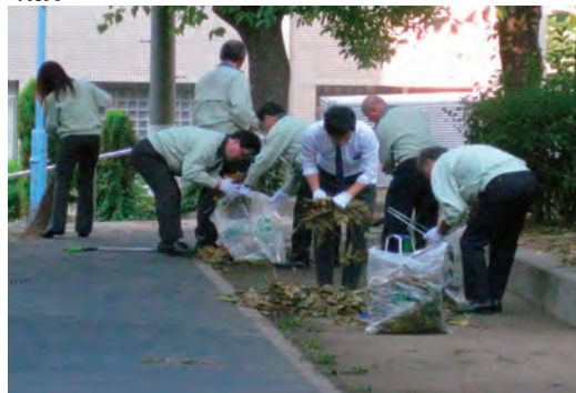
大阪マラソン“クリーンUP作戦”