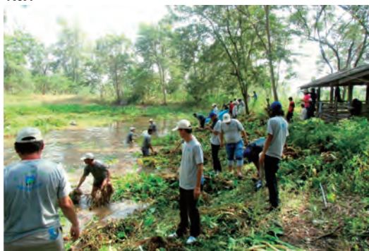
タイムエダの環境活動