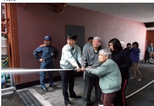
自衛消防防災訓練