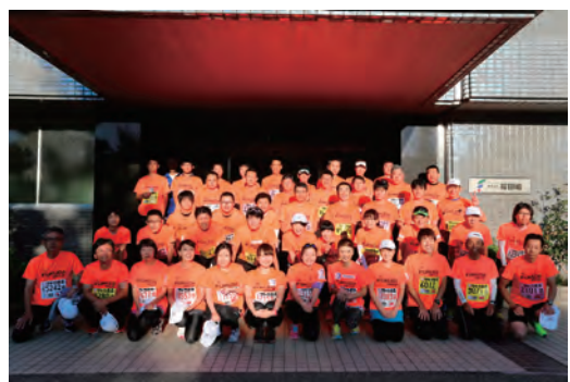
新潟シティマラソンにグループで参加