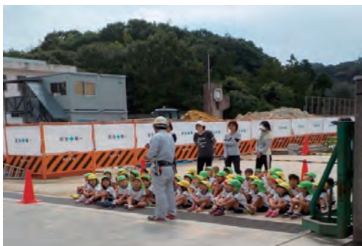
園児による現場見学会