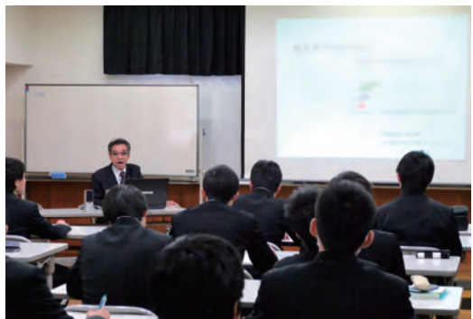
高等学校での講演会講師派遣