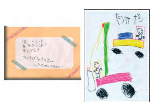
園児からの感謝の絵