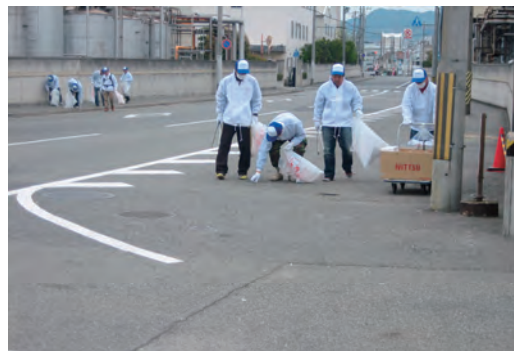
兵庫区民まちかどクリーン作戦