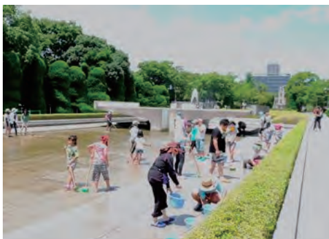
平和の池清掃活動に参加