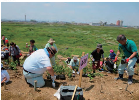
千年希望の丘植樹祭2014への参加