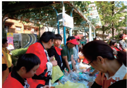
福祉施設行事への参加