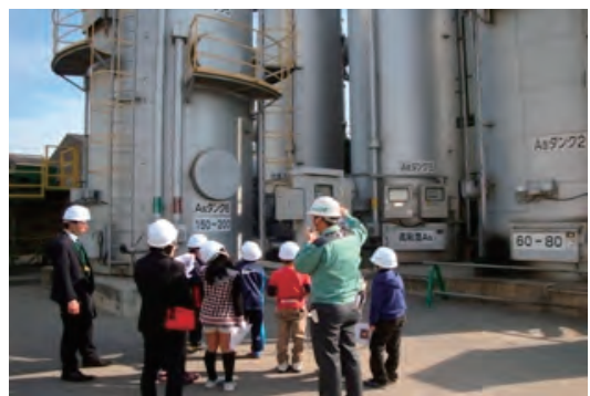
堺市立宮園小学校を招いて見学会