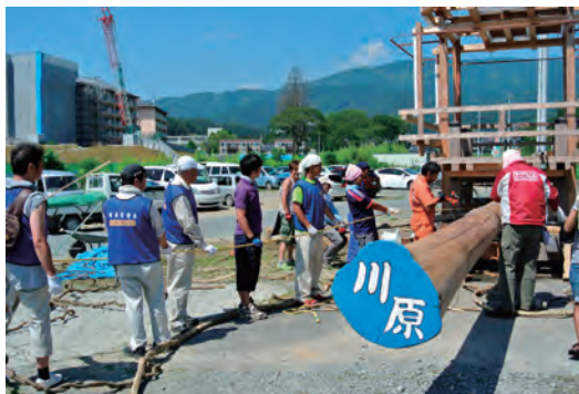
陸前高田うごく七夕まつり手伝い