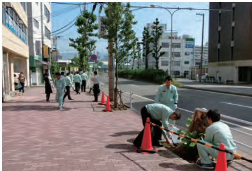
兵庫区民まちかどクリーン作戦