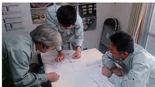
インターンシップ受入れ