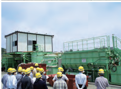
汚染水処理施設の一例