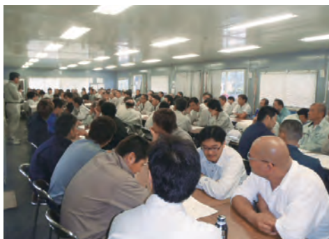
作業員教育の様子