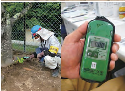
空間線量測定の様子