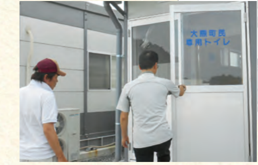
帰宅住民用トイレ

町外に避難されている地域の皆様が一時帰宅された際に、休憩や懇談ができる場所やトイレ等の施設を提供しています。