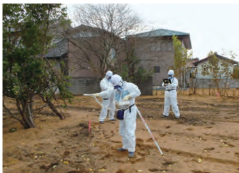
モニタリングの様子

除染作業前・除染中・除染後の各段階においてモニタリングを行い、効果について検証しながら作業を進めることで、高い品質を保持しています。作業指示や記録にはICT技術を駆使し、また、除染物にはQRコード付きのタグ等を取り付けることにより、一袋ごとに厳密な保管と管理を行っています。さらに、発生した汚染水の回収と処理も徹底して行っています。