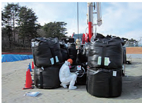
除染物の表面線量率測定の様子