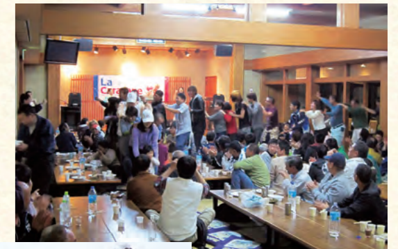
フランス料理を楽しむ会