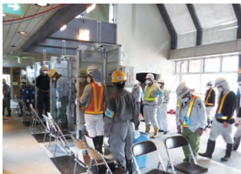
スクリーニング実施状況

除染作業に従事する作業員に対しては放射線の影響を最小限にとどめるために、作業前の放射線量の把握、毎日朝晩の被ばく線量の測定と記録、ガラスバッチの5年間保管等のデータ管理を徹底し、きめ細かな健康管理を行っています。また、福島県内の現場では作業員宿舎を整備し、快適に寝泊まりできる環境を整えています。