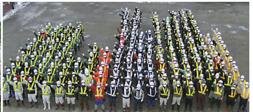
各現場における毎日の朝礼風景