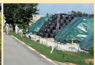
仮置き場での作業