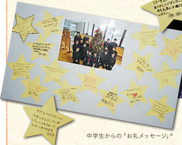
中学生からの「お礼メッセージ」

■除雪等の支援活動 雪の多い地域では、地域の皆様と共に除雪等のお手伝いを行っています。