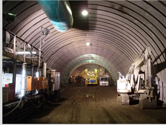
七ツ窪トンネル掘削状況