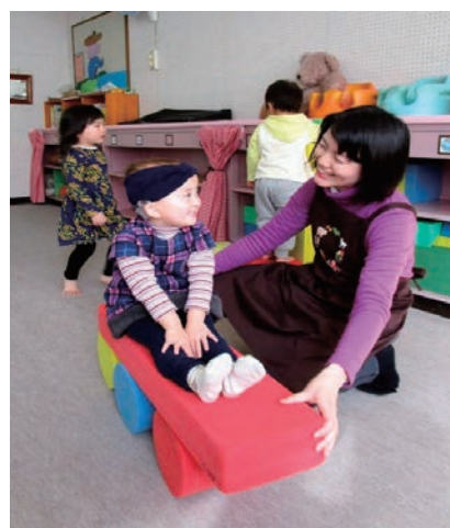
乳幼児部 2才児グループ