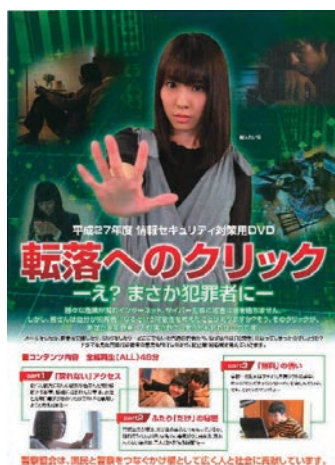
情報セキュリティ対策用DVD