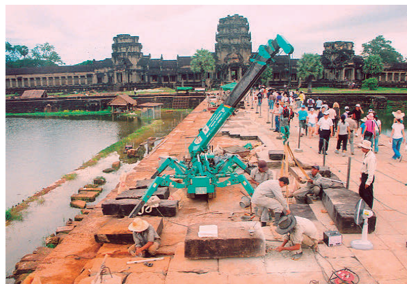
アンコール・ワット西参道第1期工事