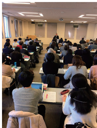
平成28年度「在日日系人のための生活相談員セミナー」