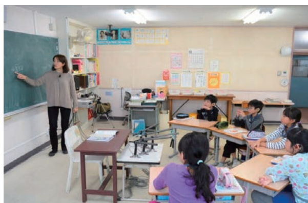
小学部 授業の様子