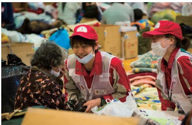
国内災害救護 熊本地震