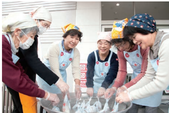
赤十字ボランティア