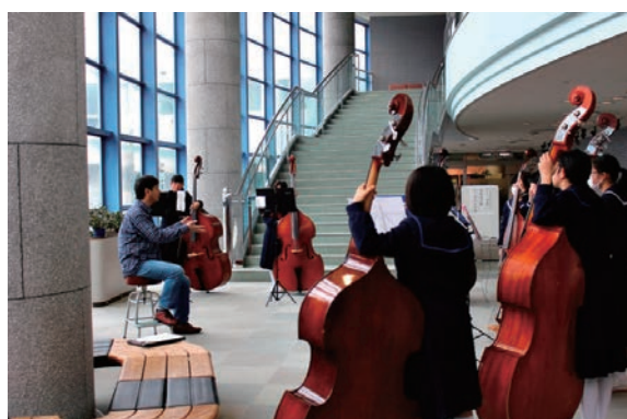
楽器演奏クリニック（豊橋公演）