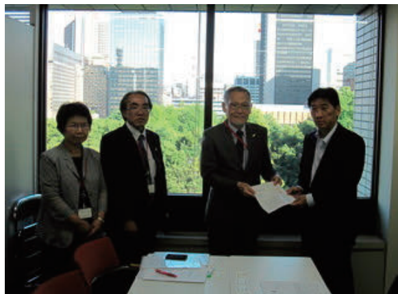
政策提言活動 (厚生労働省への要望書提出)