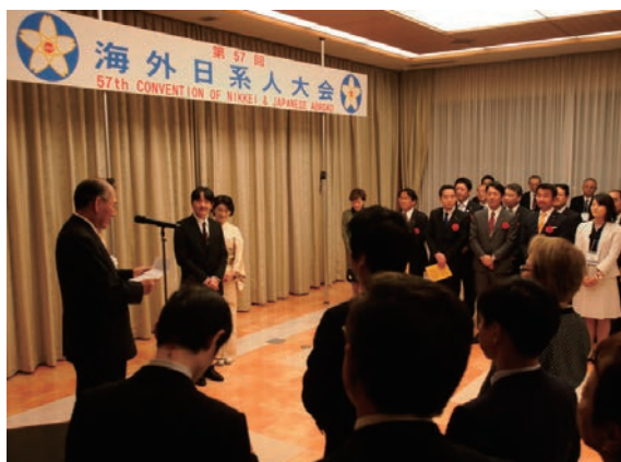
第57回海外日系人大会 「歓迎交流会」