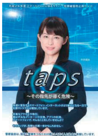
スマートフォンをめぐる 犯罪やトラブルの被害防 止・対応策DVD