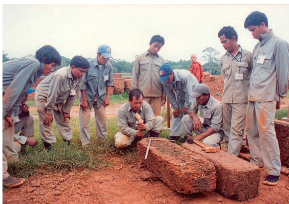
カンボジア人石工の人材養成