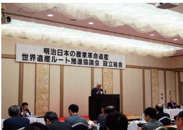
ルート推進協議会設立総会