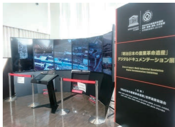
リキッドギャラクシー事業