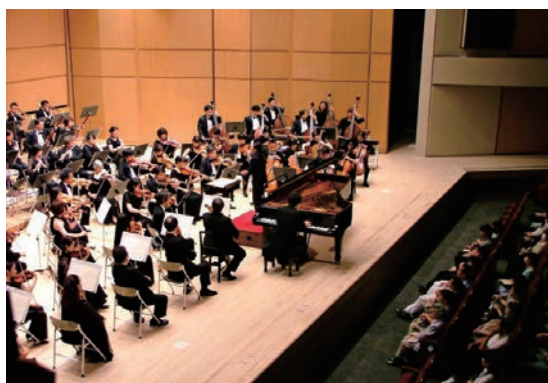
巡回公演（舞鶴公演）