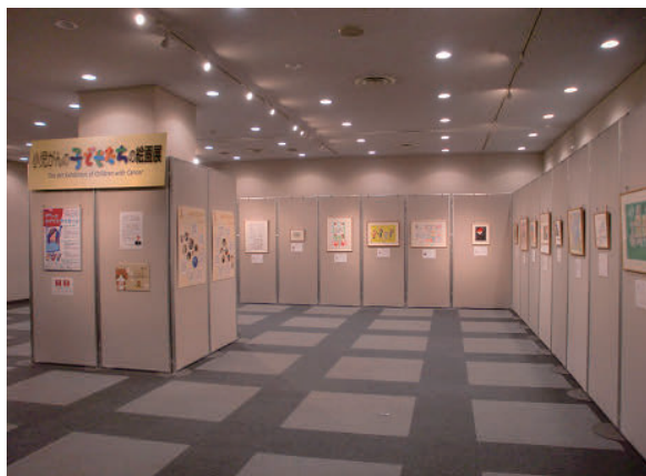
小児がんの子どもたちの絵画展