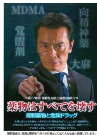
薬物乱用防止講習会用DVD