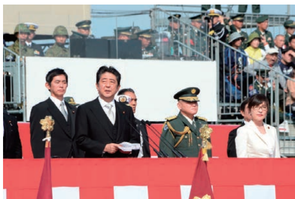
自衛隊観閲式 観閲官訓示