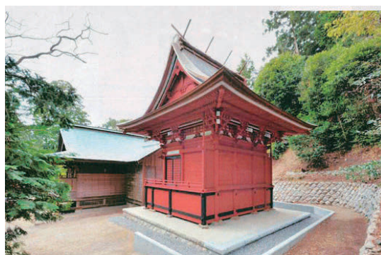
福島県いわき市「大國魂神社本殿修復事業」 地盤沈下した本殿と解体修復後