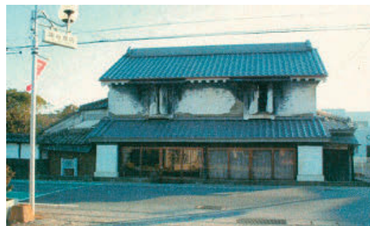
茨城県つくば市「国登録文化財宮本家住宅復旧事業」 被災直後と屋根修理後