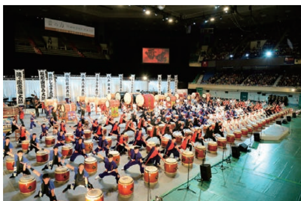
自衛隊音楽まつり 自衛太鼓「雷鳴」