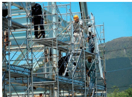
仮設足場組立実習