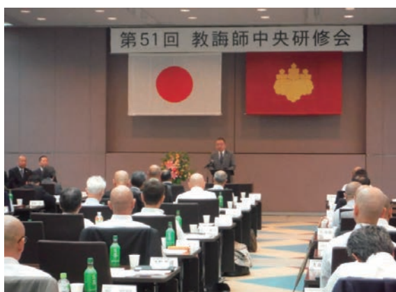
第51回教諭師中央研修会