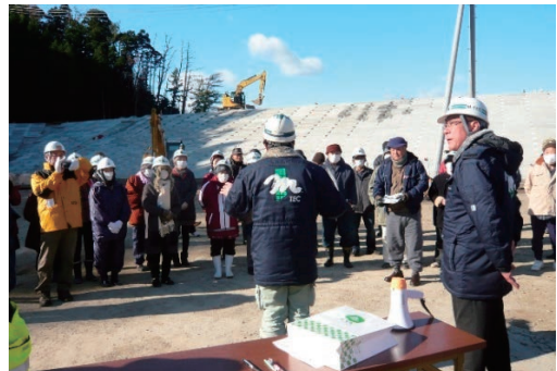
避難訓練・現場見学会