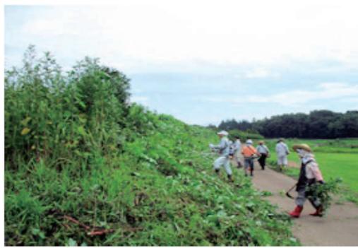
農業農村ボランティア活動