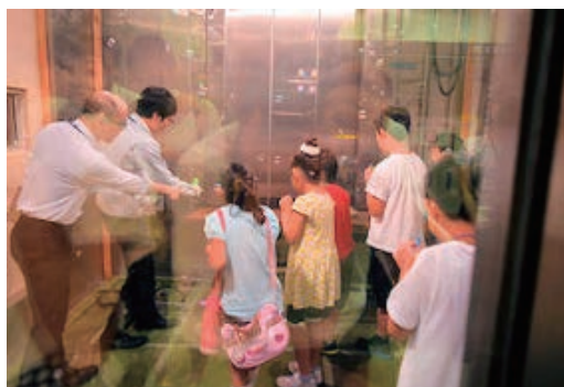
「つくばちびっこ博士2017」に参画