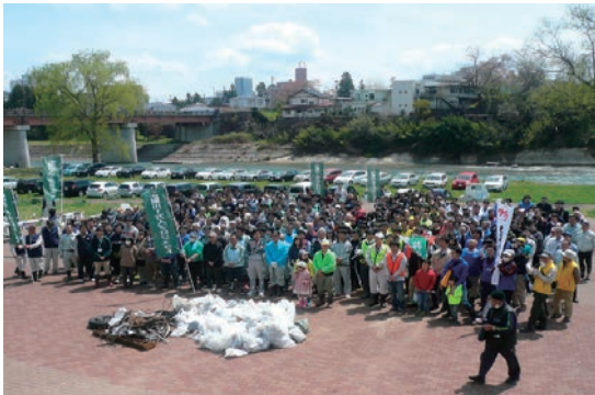
広瀬川1万人プロジェクト