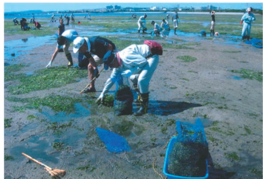
和白干潟アオサ清掃活動