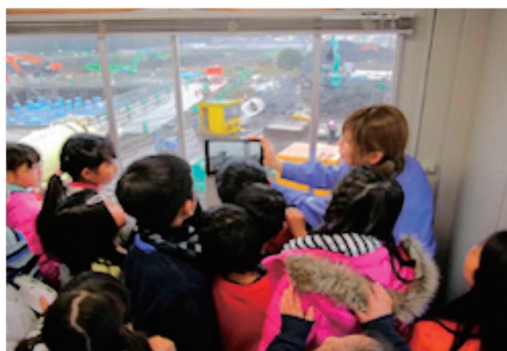
現場見学会を開催