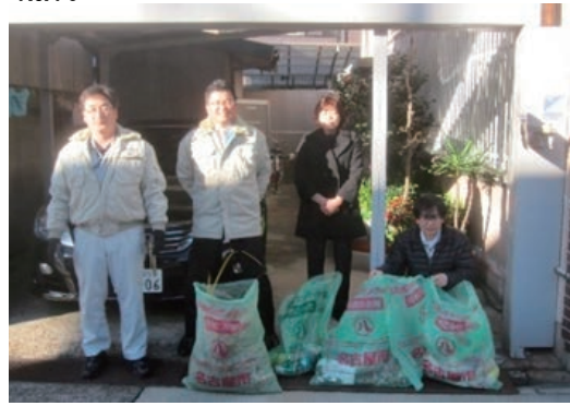
名古屋支店周辺清掃活動