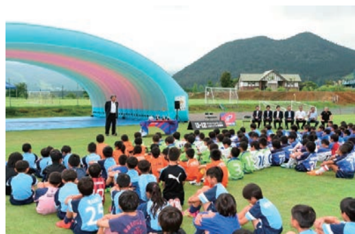
U-12サッカー大林カップに協賛