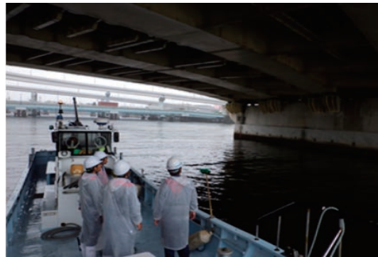
インターンシップの受け入れ