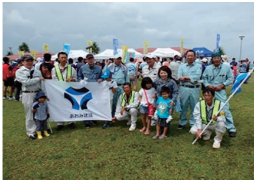
まるごと沖縄クリーンビーチ