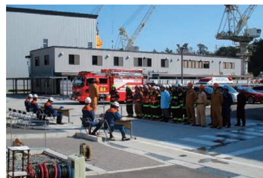
機械工場を特殊災害訓練会場として提供