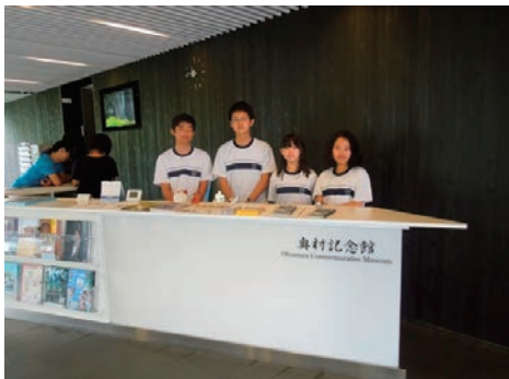
奥村記念館での職場体験学習