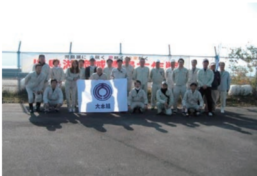
児島湖流域清掃大作戦