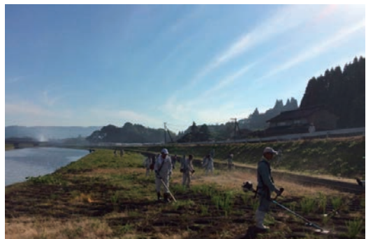
ふるさと美化活動（伊万里市）