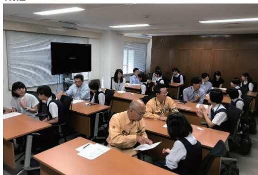
中高生の一社会人体験を受け入れ