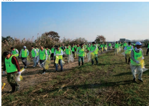
児島湖流域清掃大作戦