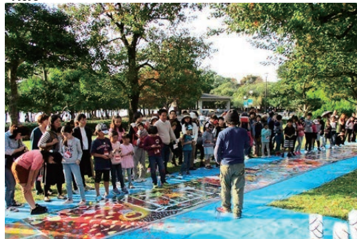
建設現場仮囲い壁画アートに協力