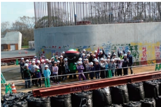
現場見学会（新小谷木橋下部工）