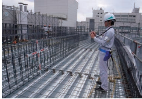
インターンシップの受け入れ