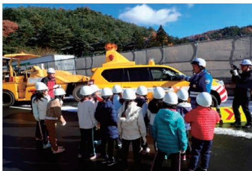
現場見学会（辰野～伊北間改良工事）