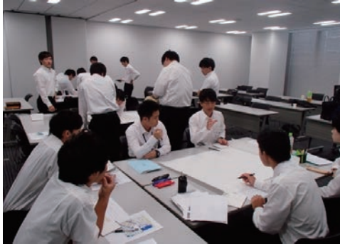
インターンシップの受け入れ