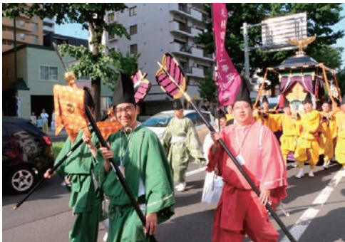
札幌まつり「神輿渡御」