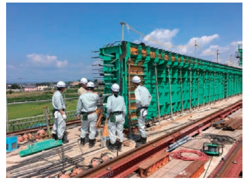
インターンシップの受け入れ