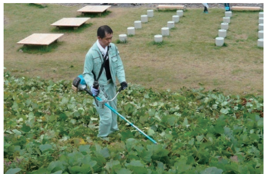
山形市河川 ボランティア