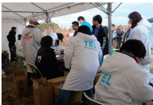
若林地区マラソン ボランティア