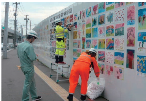
現場仮囲い絵画展示