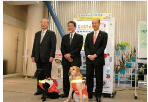
北海道盲導犬協会応援自動販売機設置