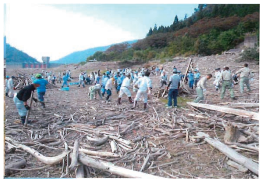
永源寺ダム湖岸クリーン作戦