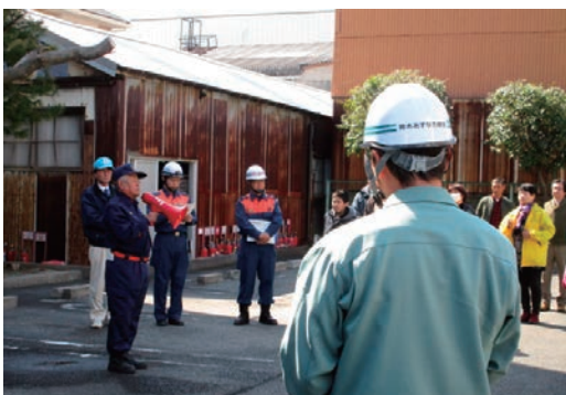
愛知学区自主防災訓練