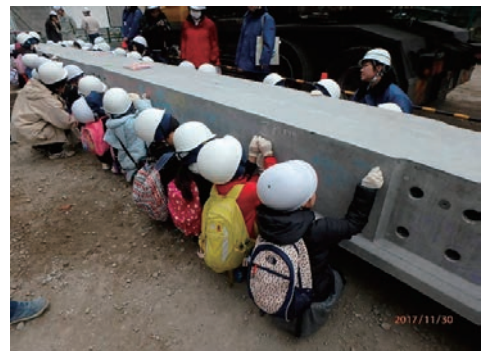
現場見学会（神田川橋梁）