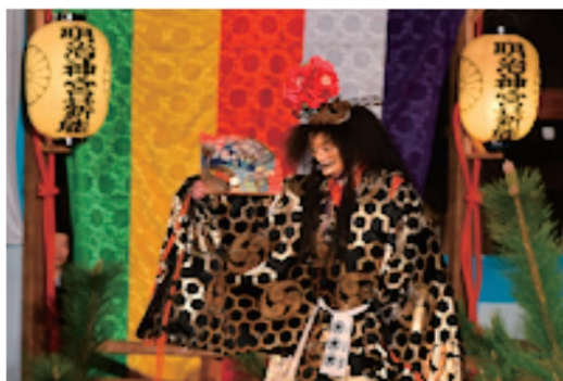
「第36回明治神宮薪能」奉納協賛