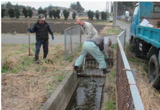
両総用水地域清掃活動