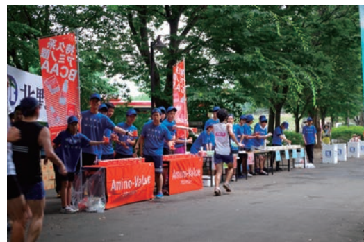
小布施見にマラソン