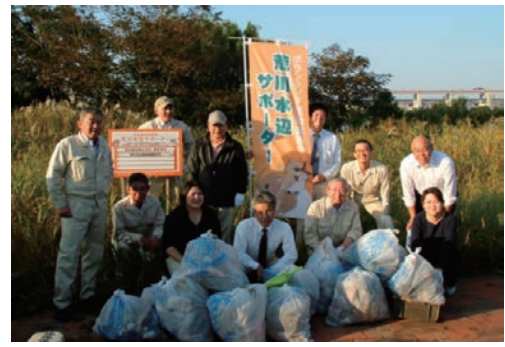
荒川アダプト制度