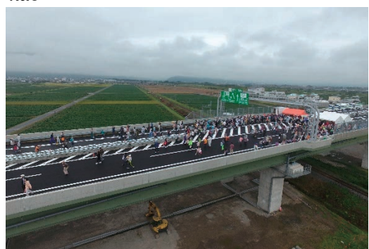
ハイウェイウォーキング大会