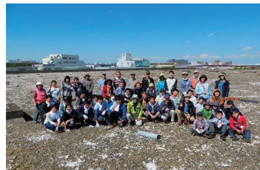
コアジサシの営巣地整備活動