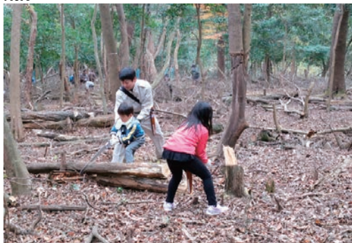
松阪伊勢寺ネイチャー間伐の様子