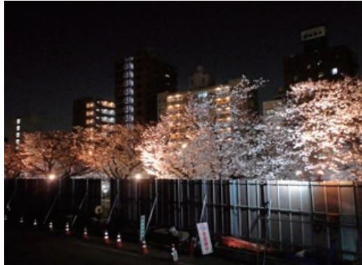
桜並木をライトアップ