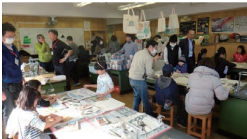
第16回「まちの先生見本市」