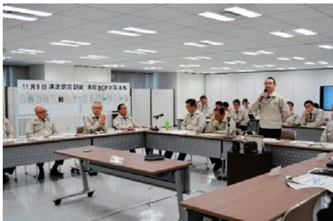
B C P訓練を実施