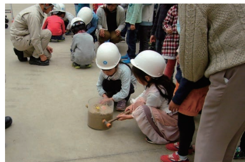
技術研究所で見学会を開催