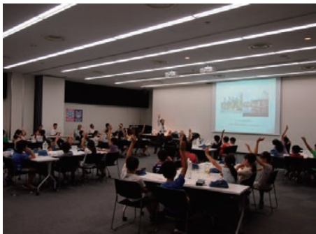
小学生への環境学習