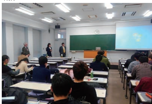
キャリアデザイン演習支援