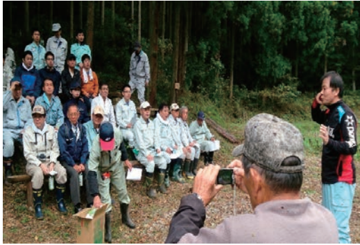
御前山ビオトープ育成作業