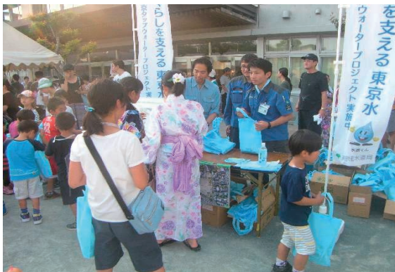
上北沢町内会子供祭り参加