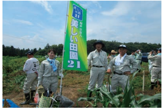
薬菜山麓耕作放棄地解消支援活動 7月