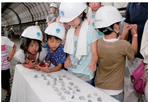
化石観察&親子見学会