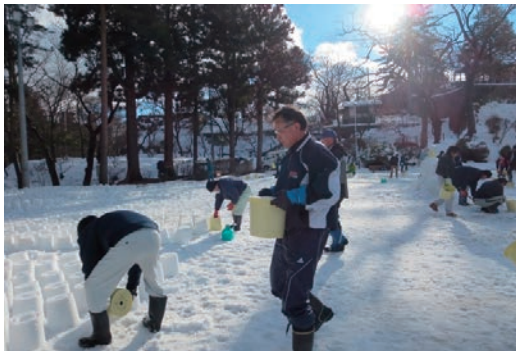
盛岡ゆきあかりに参加