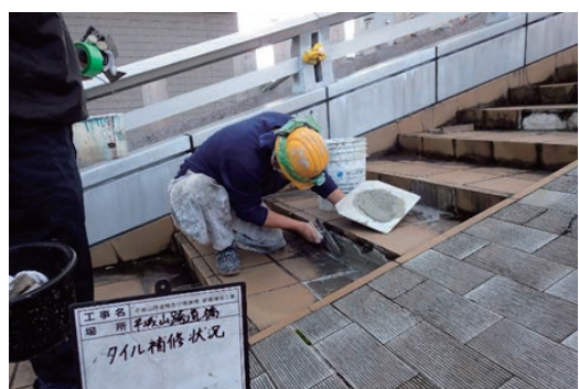
橋面のタイル補修実施