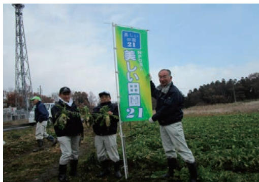
薬菜山麓耕作放棄地解消支援活動 12月