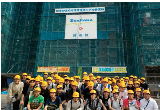
大学教育のための現場見学