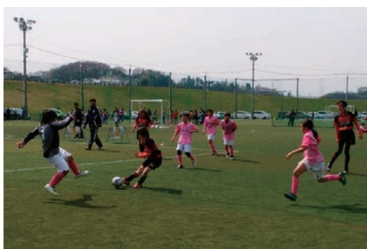
地域を繋ぐ小学生フットサル大会