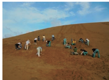
鳥取砂丘の除草ボランティア