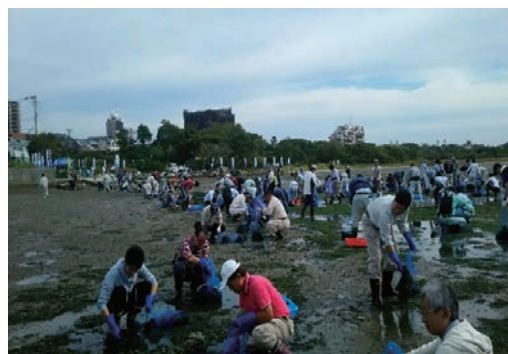
和白干潟清掃活動