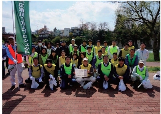
広瀬川1万人プロジェクト参加