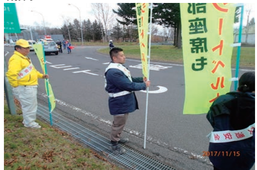
交通安全街頭啓発活動の実施