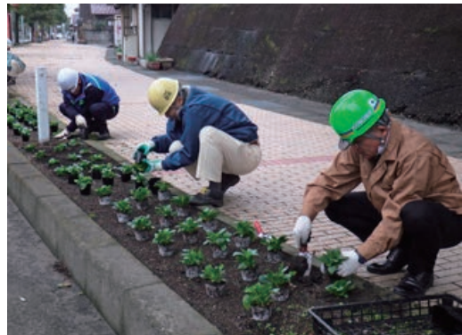
県道の植栽活動に参加