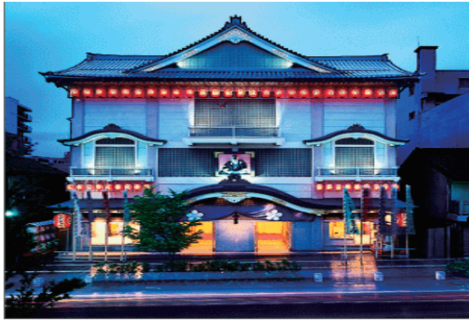
芸術文化活動 北野文芸座