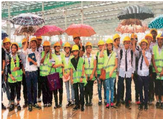
ミャンマーで学生の勉強会を開催