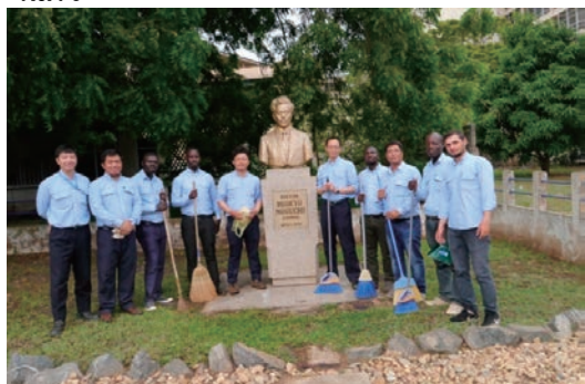
野口博士記念日本庭園清掃活動