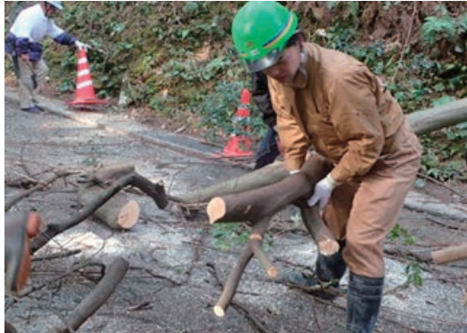
林道の清掃活動に参加