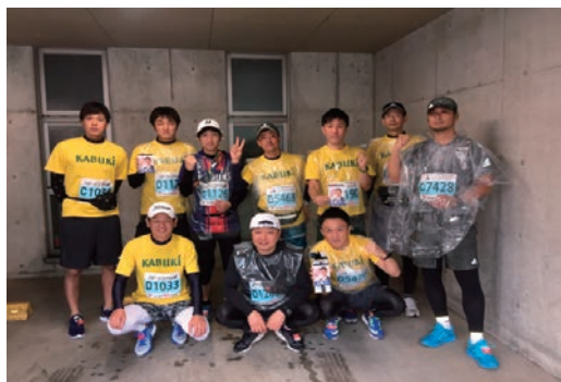
水戸黄門漫遊マラソン大会参加