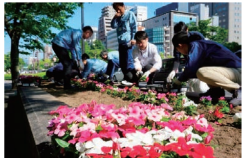
広島市「グリーンパートナー事業」