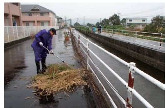
市の江川副幹線水路の清掃活動