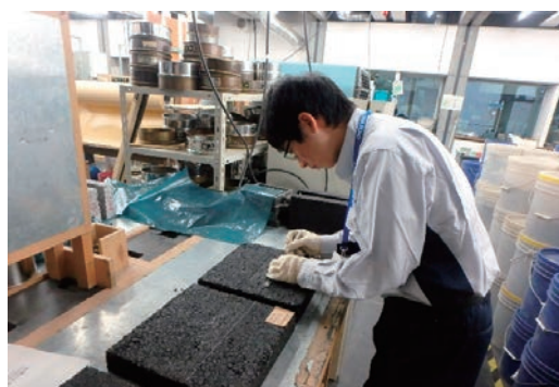
インターンシップ大学生受け入れ