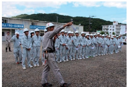
工業高校の生徒が参加