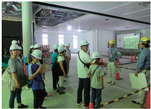
親子現場見学会の実施