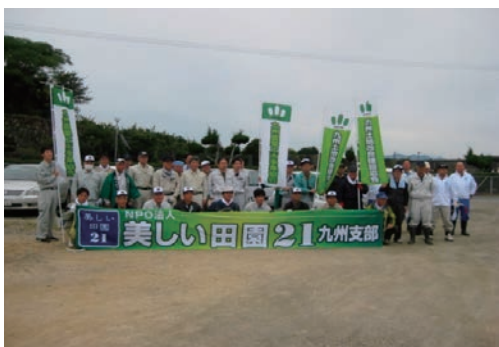
旧玉名干拓施設草刈り