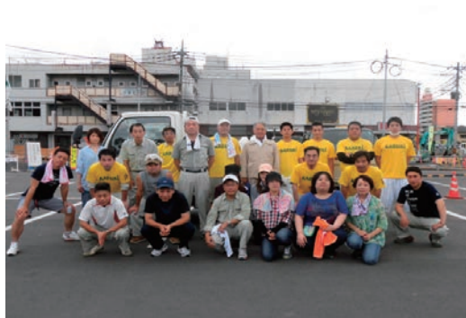
河川敷一斉清掃奉仕活動