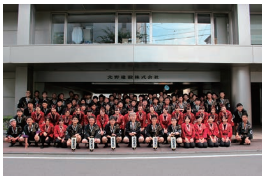
長野びんずる祭り