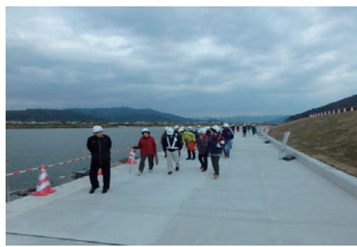
堤防工事完成お披露目会