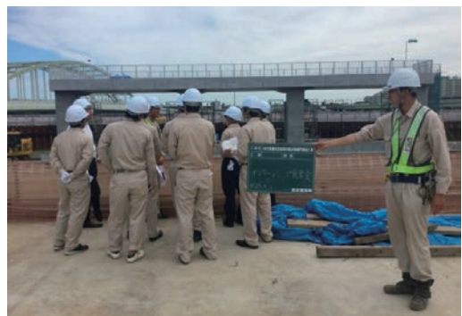
インターンシップの受け入れ