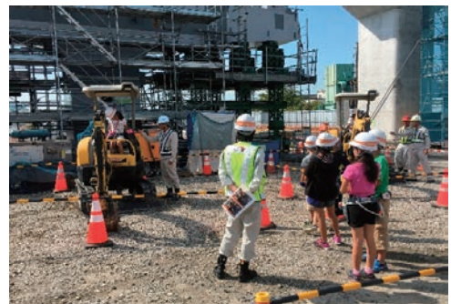
現場見学会の開催