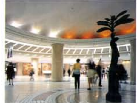
●女神が道案内してくれる円形広場 3つのストリートが交わる円形広場。ここに立つ女神像が高く掲げるのは、道案内の標識。円形広場の天井では、ナトリウムランプ、水銀ランプなどを使用して、光によって「朝焼け」や「夕焼け」をイメージさせる照明の演出も行われます。