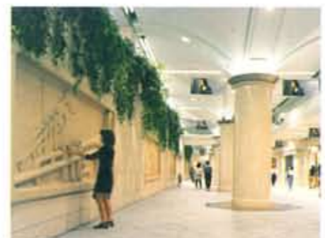
●触ると音の出る楽器のレリーフ トランペット、コントラバス、ピアノ、ドラム、サクソフォーン。カジュアルストリートの壁面には、触るとその楽器の音が出る。大きな楽器のレリーフが並んでいます。音階が1オクターブあるので、簡単な演奏も可能。