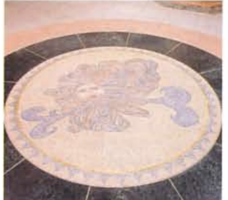
●神々との出会いを演出するガレリア風模様貼り ファッションブルストリートに広がる大理石仕上げの床には、ミラノの「ガレリア」を思わせる模様貼りが施されています。中央部にはゼウスを象徴する「鷹」、西文差点には風の神「ゼビウス」、東文差点には幸福のシンボル「牛」の模様を貼り、神々との出会いが演出されています。