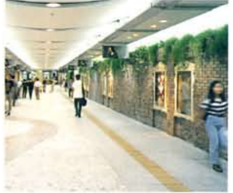
●毎月作品が替わるストリートギャラリー バラエティストリートにあるストリートギャラリーには、月々のテーマにもとづいたアート作品を展示。一般投票によるグランプリの選出も予定されています。