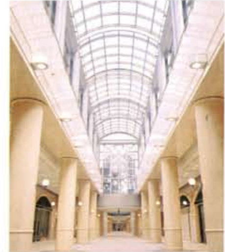
●太陽の光がふり注ぐ広大なアトリウム ファッションブルストリートは、自然光がふり注ぐ、高さ約15mのアトリウム空間。地下街なのに青空が見え、まるで地上の街かのような解放感にひたれます。

さらに、ディアモール大阪=大阪駅前ダイヤモンド地下街の最大の特徴は、地下街全体が、地区の防災拠点としての性格を強く帯びていること。「やすらぎ」「人へのやさしさ」というテーマを表面的なものとして捉えず、地下街の建設において、「安全性」「災害への強さ」を最優先すべき基本コンセプトとして位置づけていることです。以下、ダイヤモンド地下街独自の防災システムを具体的にみてみましょう。