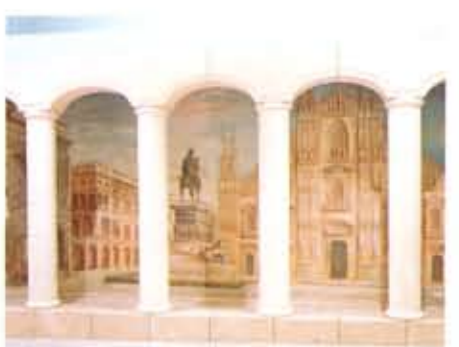
●地下街のコンセプトを表現するフレスコ画 バラエティストリートの壁面を飾るのは、「エマヌエル」「ガッレリア」「ドゥオーモ」などのフレスコ画。ミラノの「ガレリア」をイメージしたダイヤモンド地下街のコンセプトを、だまし絵の技術を駆使して表現しています。「災害に強い街」を基本コンセプトに、最先端の地下都市情報ネット。