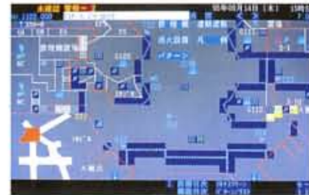
防災システムモニター

地下街のあちこちに設けられている映像設備、防犯カメラも防災システムの一環です。映像画面は、火災発生時にはすべて火災情報に切り替わり、避難誘導をサポート。また防犯カメラは、火災センサーと連動して火災発生地点を映し出す仕組みになっています。