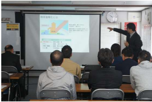
座学講習「地球温暖化と気候変動」 (日建連 温暖化対策部会)