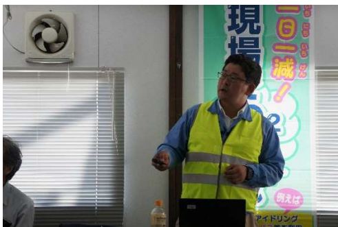
座学講習「次世代型油圧ショベルの紹介」 (日本キャタピラー(合))