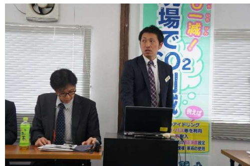
座学講習「省燃費運転について」 (日本キャタピラー(合))