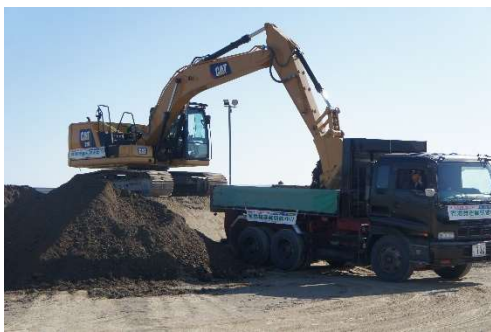
省燃費運転実技実施状況