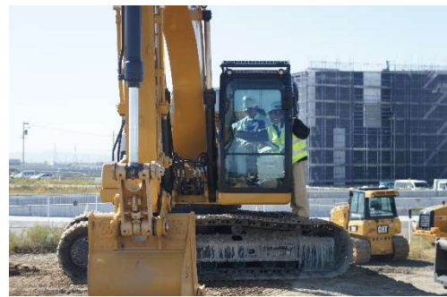
掘削積込作業実技前指導