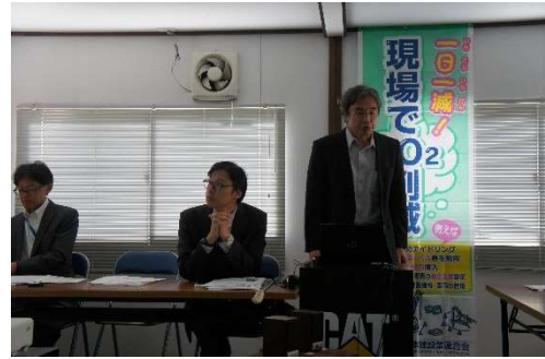
座学カリキュラム理解度テスト (日建連 温暖化対策部会)