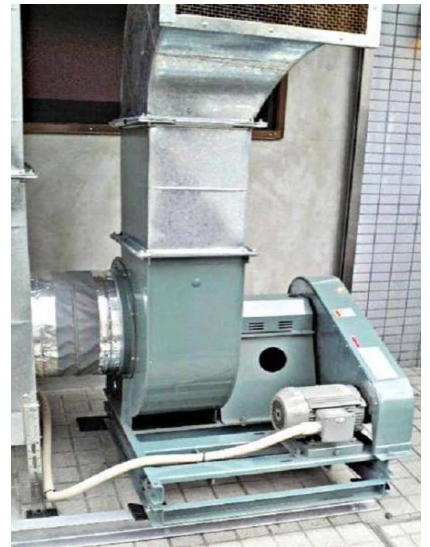
ダクト開口部が横向きとなっている事例