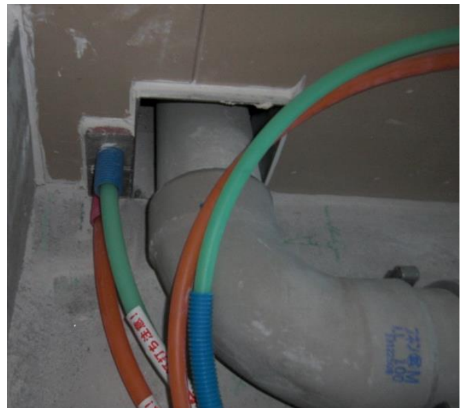
施工例（貫通ブロックと排水ブロック）