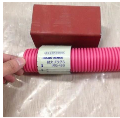
鋼製の型枠に耐火プラグを巻いてサヤ管をと通したもの