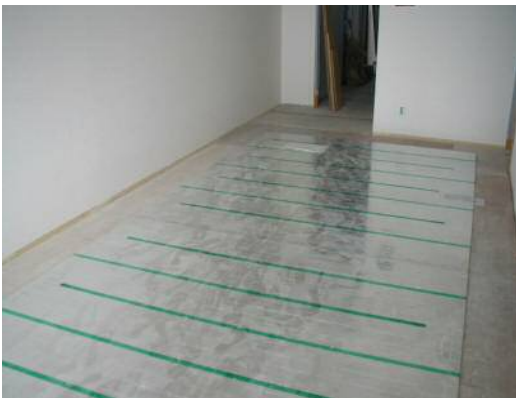
写真-1 温水式床暖房マット敷設状況