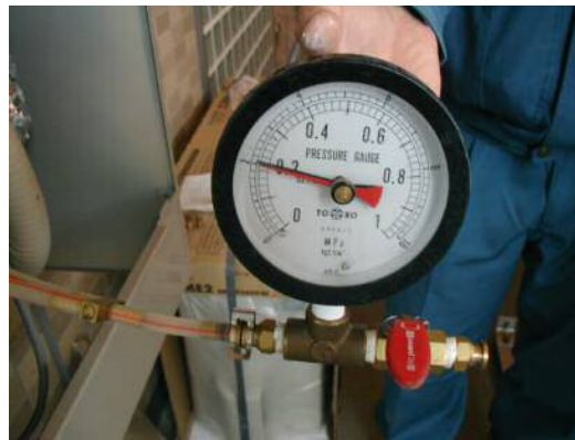
写真-2 圧力検査実施状況