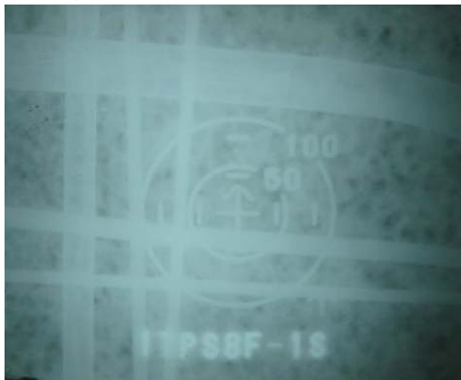
(写真-5) フィルム (水洗い後)