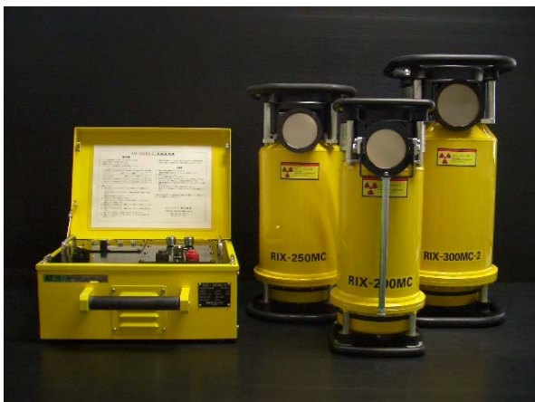
X線発生装置コントローラー X線発生装置 (写真-1)