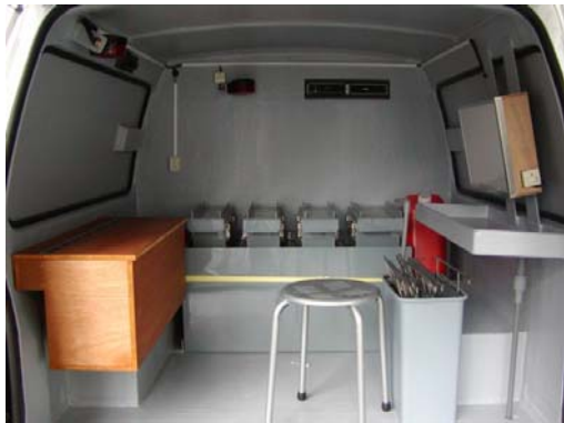
(写真-4) レントゲン車内