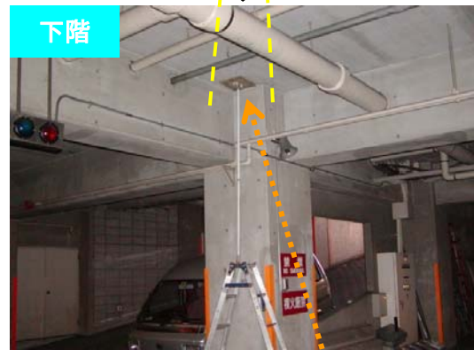
(写真-3) フィルム設置