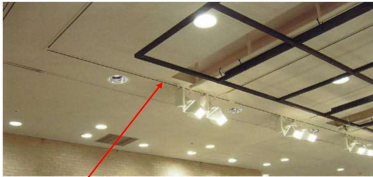
落下したライティングダクト(3m×2+1m=7m)

ライティングダクトが、支持不足により照明器具（3kg×10台）と共に天井から落下した。