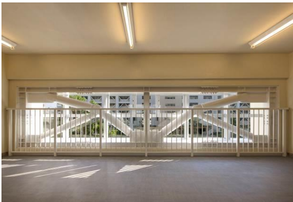
E L Vホール 改修後