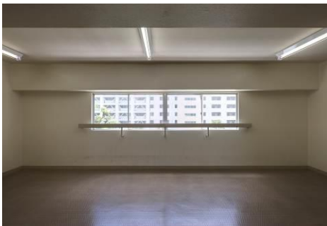
E L Vホール 改修前