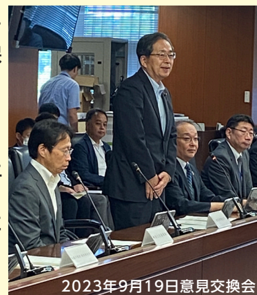
2023年9月19日意見交換会