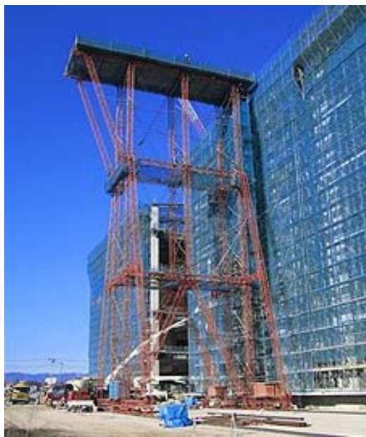
移動式折板屋根成型機構台の施工例