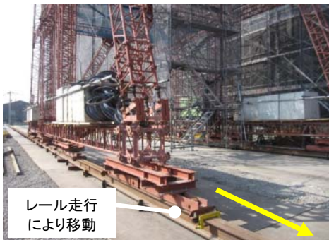
レール走行により移動