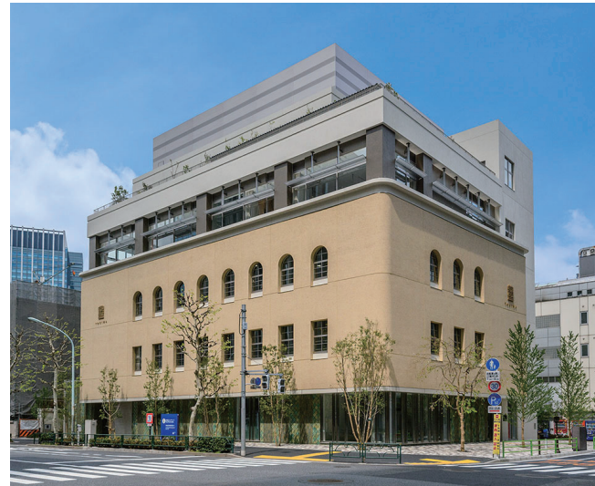
外観写真（江戸通り・日銀通り交差点より）

再開発事業の他の地区と同様、歩道状空地を設け、街路樹を補完する地上緑化や屋上緑化で環境改善を図った。