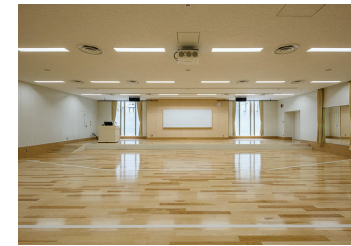
1階音楽室／視聴覚室