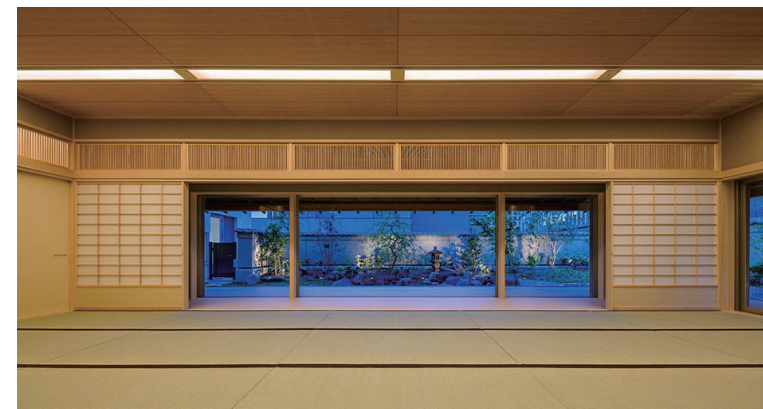
5階和室より日本庭園を臨む