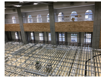
体育館の床放射空調冷暖房

体育館は居住域空調方式として、二重床空間を利用した空気式床放射空調冷暖房システムを採用し、競技への影響を抑え、快適な環境を実現している。