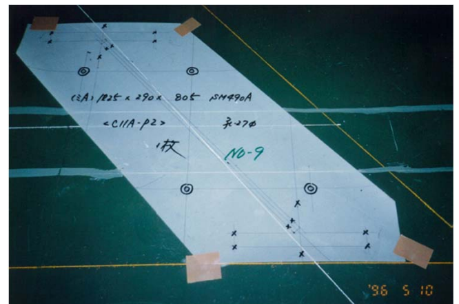
現寸フィルムによる確認例