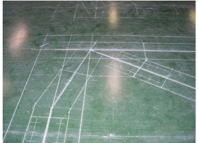
床書き現寸図の例