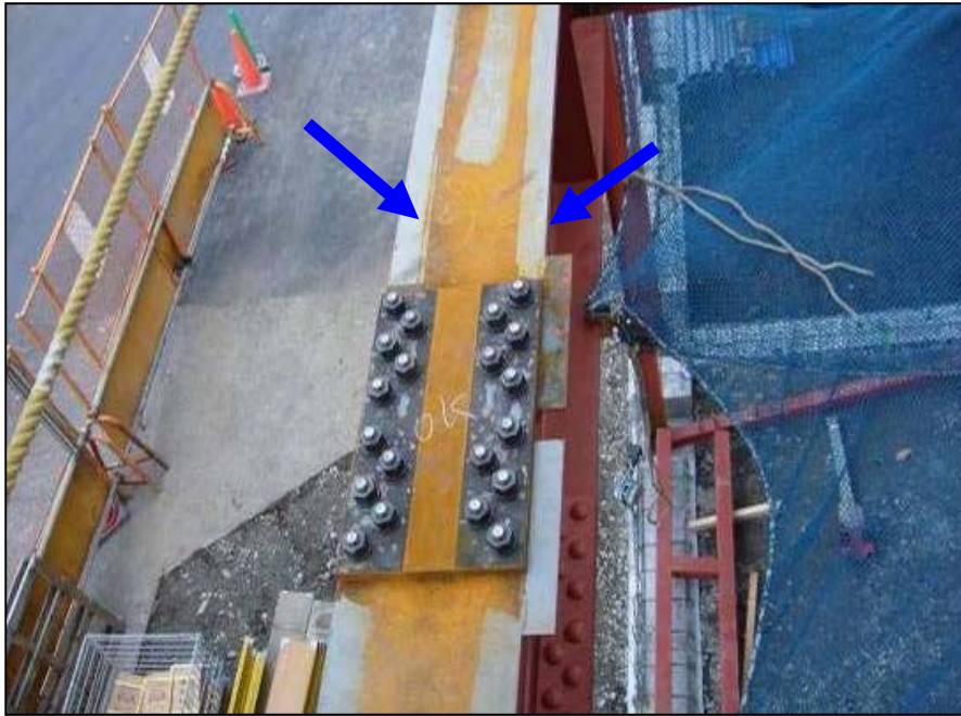
梁フランジのデッキかかり代を下塗りした例

特に見えがかりとなる場合や、湿度が高い環境となる部位等においては、上フランジ天端のデッキかかり代部分のみ下塗りを行うことは、建物の使用を開始してから上フランジ角部からのさびの発生を防止する対策として有効です。