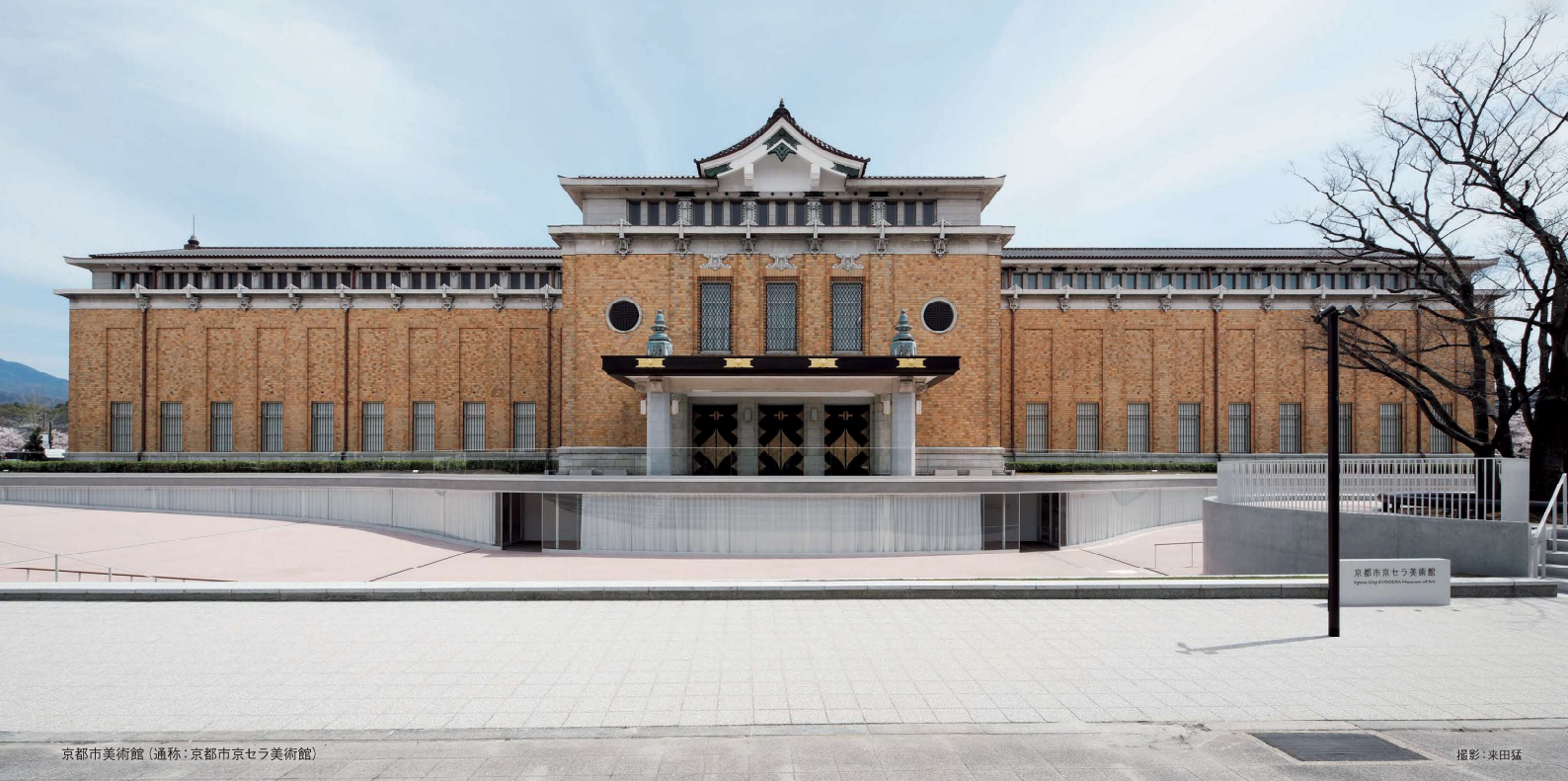
京都市美術館 (通称:京都市京セラ美術館)