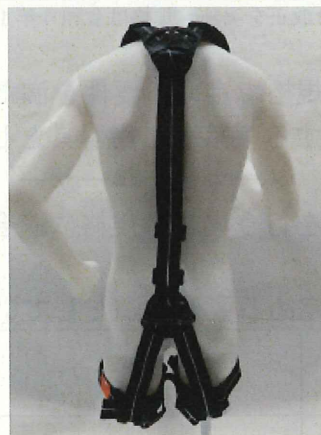
フルハーネス全体（後側）