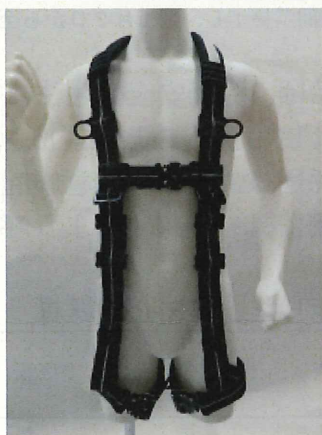
フルハーネス全体（前側）