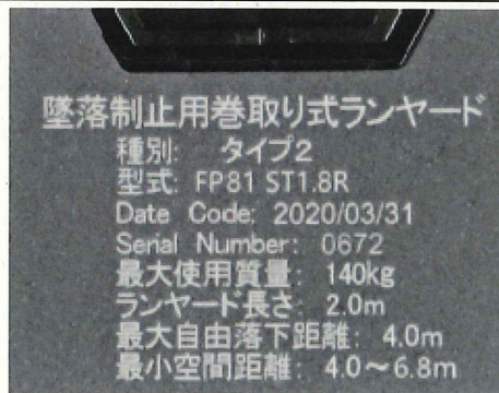
ショックアブソーバの表示