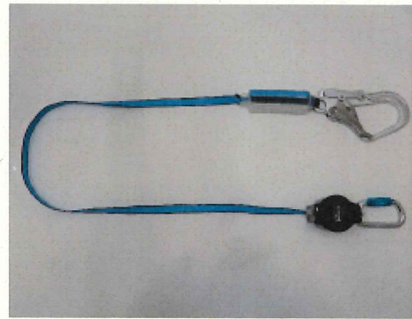
ランヤード全体 (巻取器からストラップを全て出した状態)