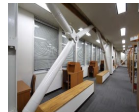
補強材(筋かい)の設置