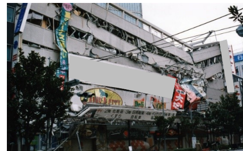
地震により崩壊した大規模店舗