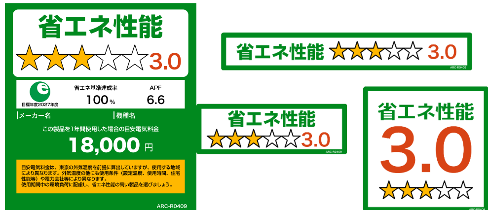
(家庭用エアコンディショナーのイメージ)