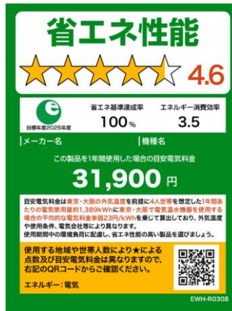
(電気温水機器のイメージ)

※温水機器以外は、製品のサイズやネット取引等の限られたスペースで使用する場合は右側のミニラベルを活用すること。