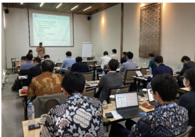
令和4年度 ブリーフィングの様子 (ジャカルタ)