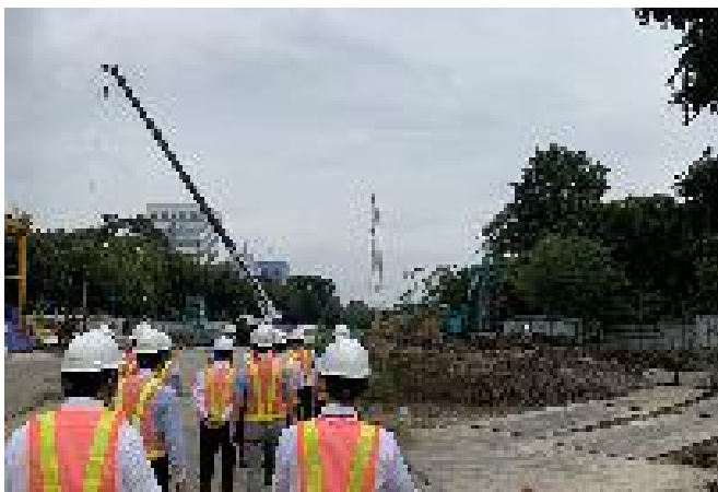
令和4年度 現場視察の様子 (ジャカルタ)