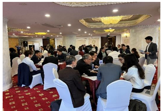
令和5年度 ビジネスマッチングの様子(ハノイ)