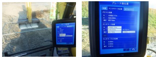
作業装置の整合確認

※ローライゼーション：GNSS（衛星測位システム）の計測座標を現地座標（工事基準点座標）に整合させる作業