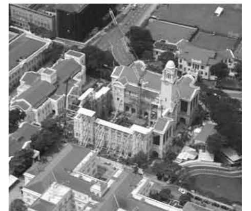
ビクトリアシアターおよびコンサートホール 鳥瞰 (施工中)

ビクトリアシアターおよびコンサートホールは、一八一九年シンガポールの建国の父といわれるスタンフォード・ラッフルズ卿が、人口一五〇人ほどの南国の小島でしかなかったこの地に初めて上陸したと伝えられる場所に位置します。中央部には時計台、正面から向って左側がシアター、右側がコンサートホールです。初期の建設はシンガポールが英国の属国であった一八五六年に始まり、一八六二年に現在のシアター部分が完成、一九〇五年にコンサートホール部分、翌一九〇六年に時計台部分が完成しました。その意匠は、まさに英国が最盛期であったビクトリア女王時代の様式を取り入れたものです。音楽ホールとしての用途のほか、投票所、卒業式、ダンスパーティー会場としても使用され、第二次大戦中は、病院として使われた記録もあります。近年は在留邦人にもなじみが深く、日本人学校の合唱コンクール会場としても利用されています。 最初の建設以降、一九五四年、一九七九年にそれぞれシアター部分とコンサートホール部分の改修工事が過去に行われていますが、今回建物全体に渡り改修保存工事が計画され、当社が担当することになりました。