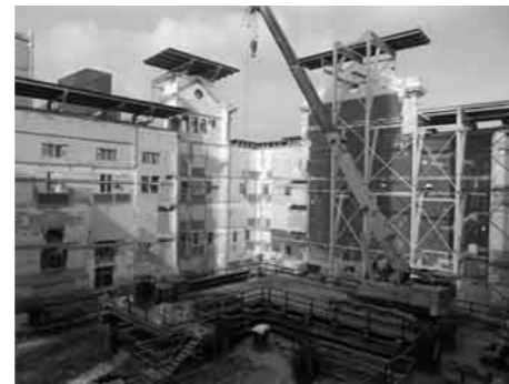
ビクトリアシアターおよびコンサートホール内景 (施工中)