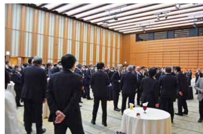
賑わう会場内で談笑する出席者たち

介する動画として「日建連 活動報告 二〇二二」を放映し、八項目の取組みを紹介した。 本年度の主な活動をまとめた映像に懇談会の出席者は熱心な表情で見入っていた。なお、映像は日建連ホームページでも視聴すること