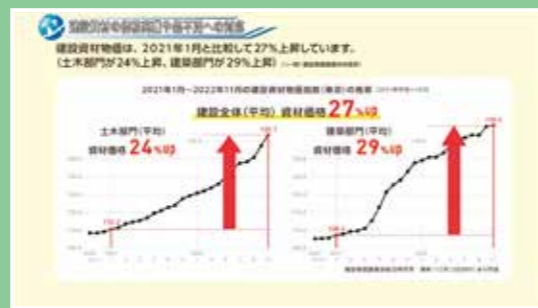
建設資材の価格高騰や品不足への対応