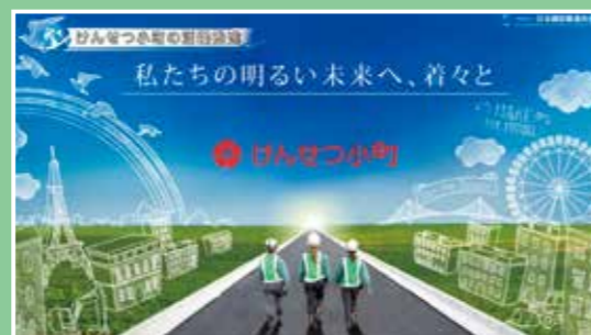
けんせつ小町の活躍推進