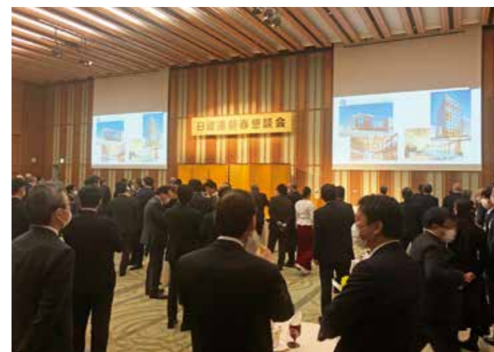
映像放映中の会場内の様子