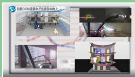
建設DXの推進など生産性の向上