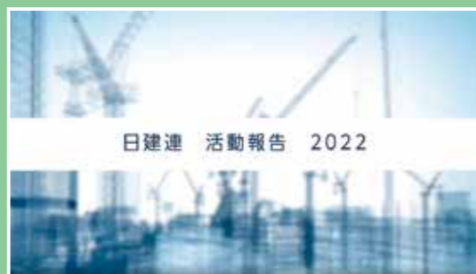
「日建連 活動報告 2022」映像