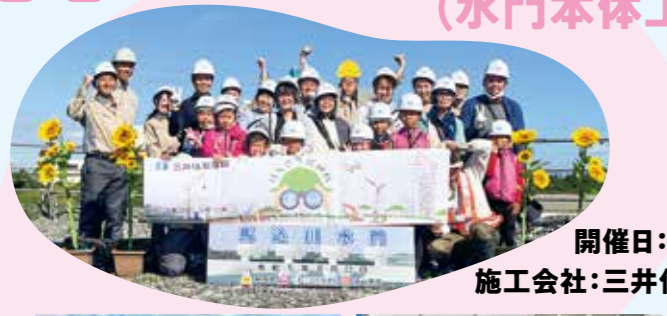
開催日:8/22(火) 施工会社:三井住友建設(株)