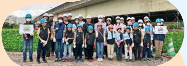
開催日:8/25(金) 施工会社:戸田建設(株)