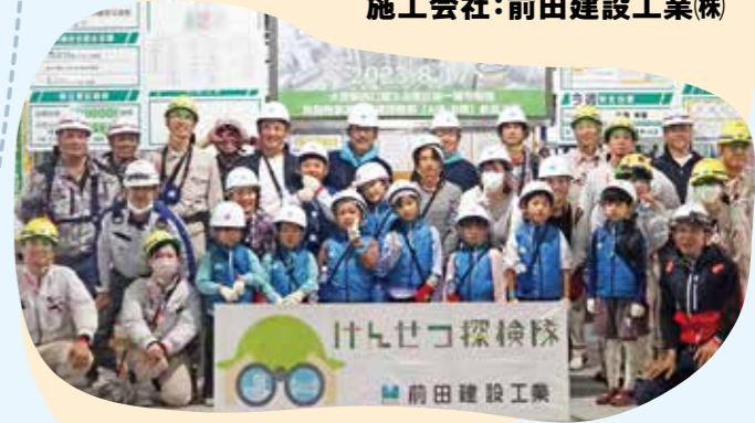
開催日:8/17(木) 施工会社:前田建設工業(株)