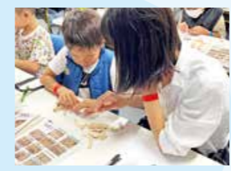
開催日:8/21(月) 施工会社:(株)竹中工務店

アンケートより だむがだいすきだけど、たてものもすきになった。あしばもいつかあるきたいな。(小学1年生)