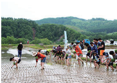
緑の水田プロジェクト（田植え）