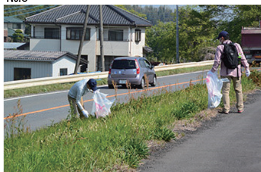
渡良瀬川遊水地クリーン作戦