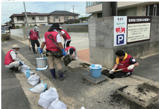
西日本豪雨 災害復旧ボランティア