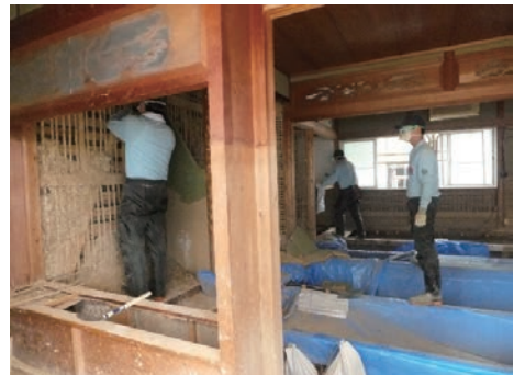
西日本豪雨被災地における土壁解体作業