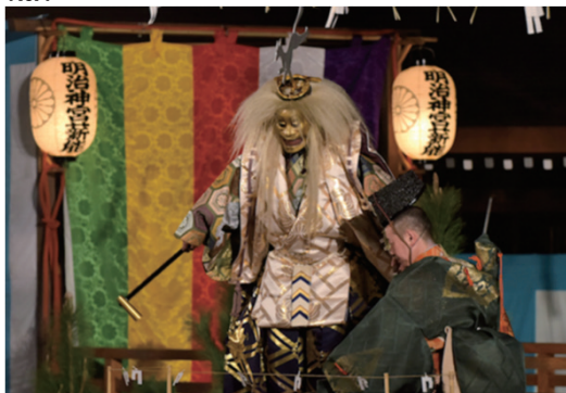
第37回明治神宮薪能奉納協賛