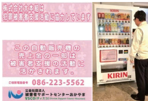
犯罪被害者支援自動販売機の設置