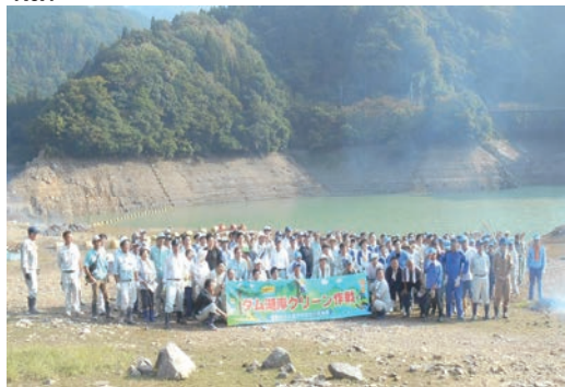
永源寺ダム湖岸クリーン作戦