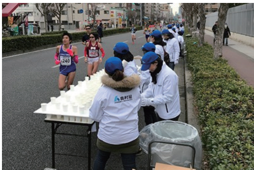
大阪ハーフマラソンの給水ボランティア