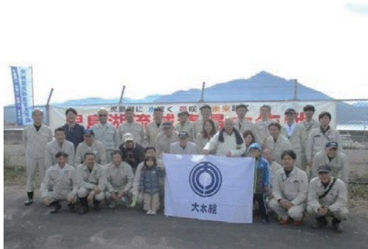
児島湖流域清掃大作戦