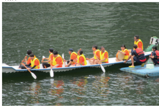
鹿野川湖ドラゴンボート大会に参加