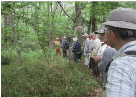
国内絶滅危惧種の観察会