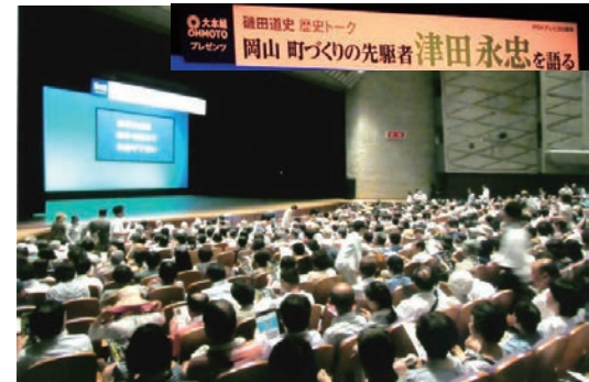
津田永忠を顕彰するシンポジウム開催