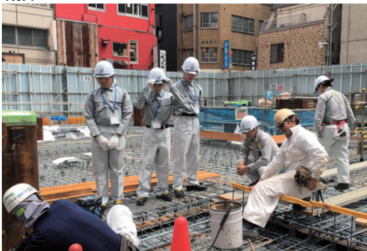
職場体験学習の受け入れ