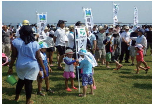
木更津金田海岸清掃