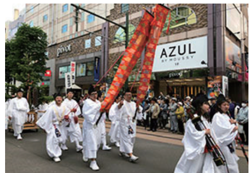
札幌まつり「神輿渡御」