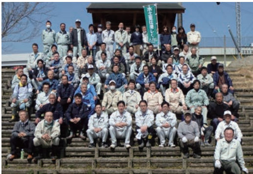
国営巨椋池地区の地域貢献活動