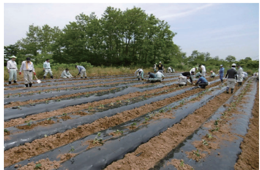
耕作放棄地解消支援活動