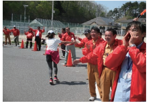
マラソンにボランティア参加