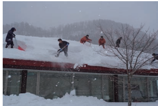
除雪ボランティア活動