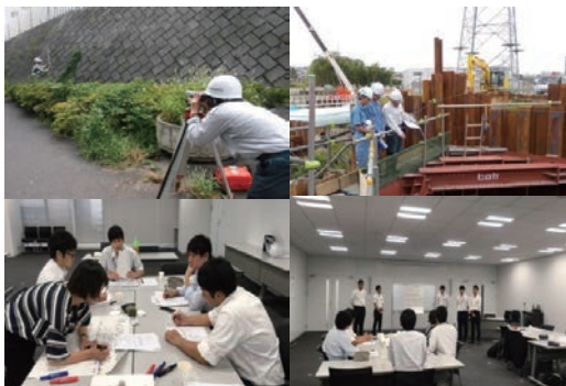
インターンシップの受入