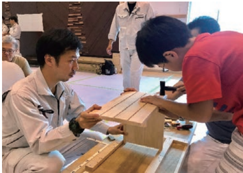
親子木工教室を開催