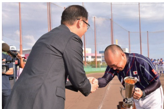
障がい者スポーツ団体への協賛