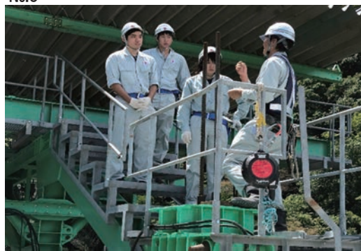
大学・高専生 インターンシップ受入れ