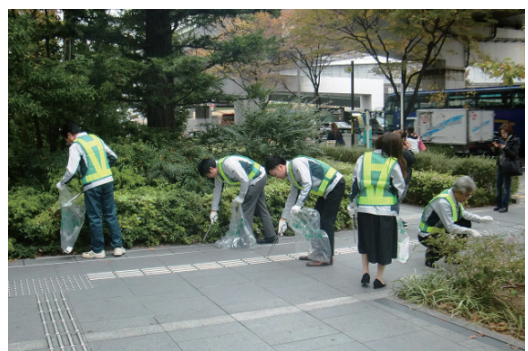
地域清掃活動の実施