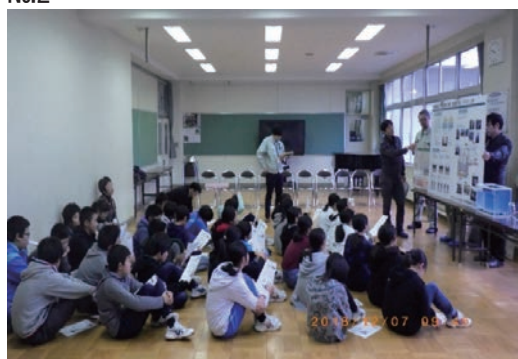
徳田橋下部工（その2）工事 出前授業