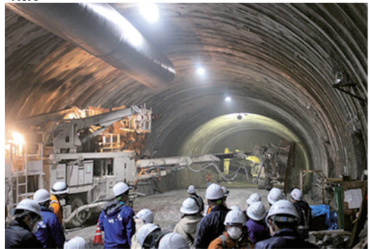
現場見学会を開催