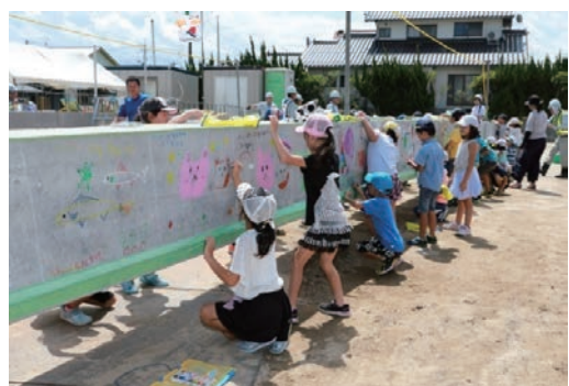
堀西南橋・上橋上部工 現場見学会