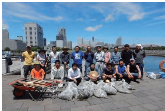
みなとみどりサポーター