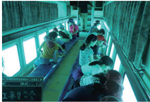
現場見学会の実施