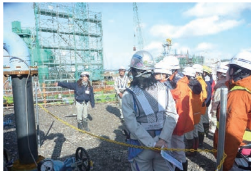
女性技術者研修会