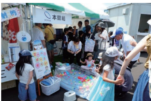
「海フェスタにいがた」に参加