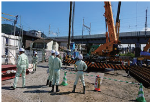
インターンシップの受け入れ