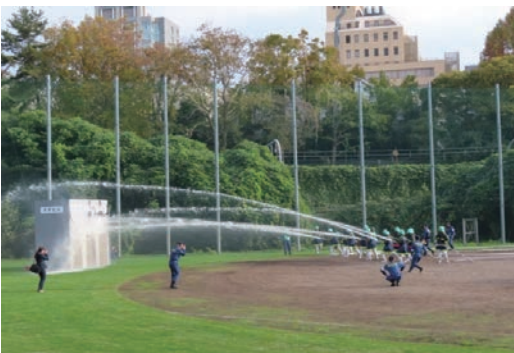
千代田区消防団合同点検