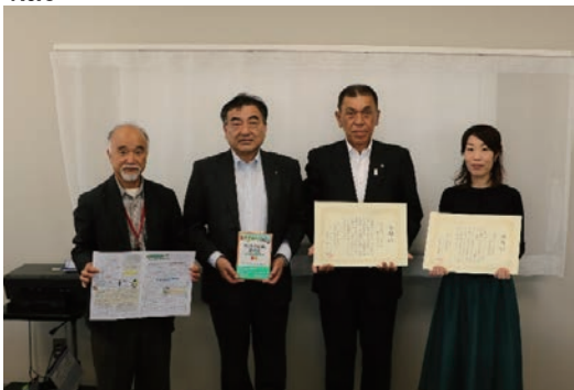
フードバンク新潟への活動協力