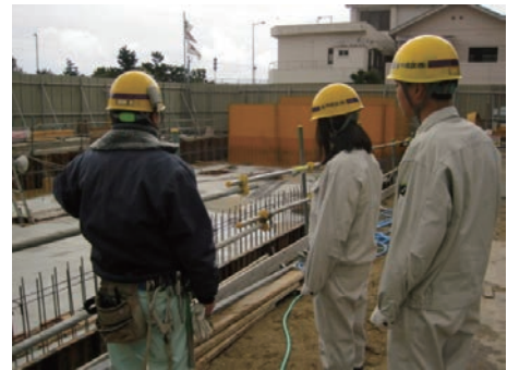
兵庫工業高校インターンシップ