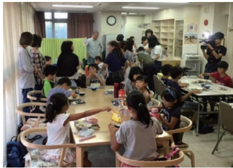
子ども食堂を支援