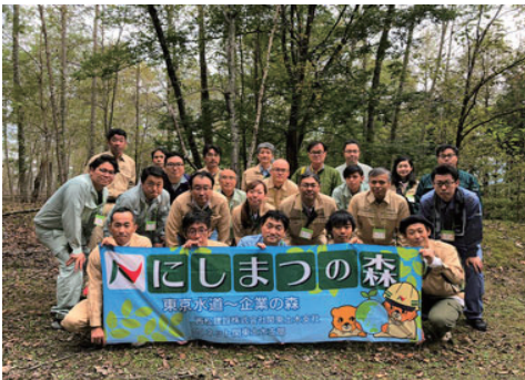
「にしまつの森」保全活動を実施