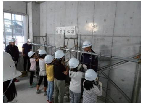
けんせつ小町活躍現場見学会