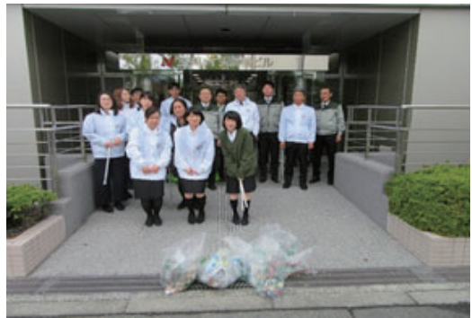
大阪マラソンクリーンUP作戦