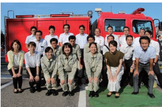
自衛消防活動審査会に参加