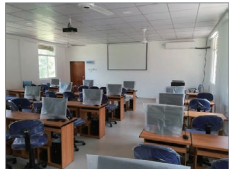
スリランカ国での災害支援活動