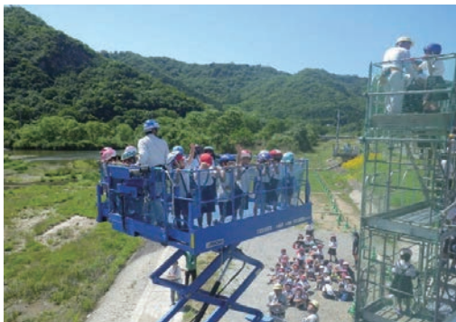
工事現場見学会（小学生）