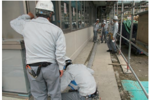
中学生の職場体験学習