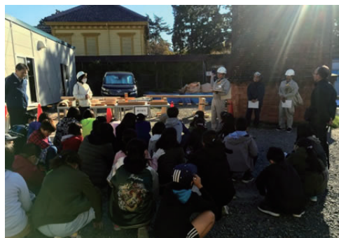
重要文化財の見学会への協力