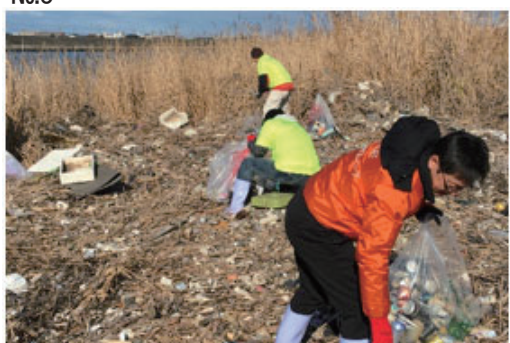
藤前干潟ペットボトル一掃大作戦