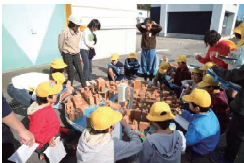
研究所見学会の実施