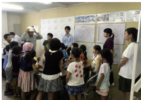
作業所見学会の実施