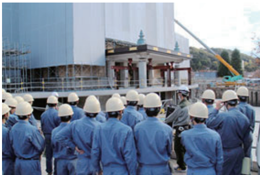
現場見学会の実施