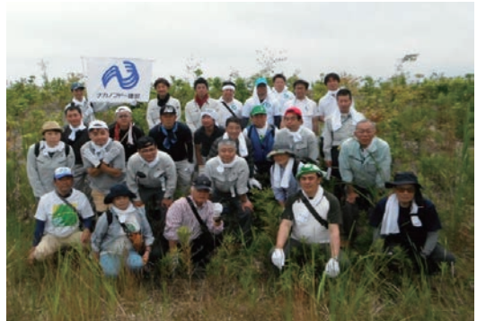
千年希望の丘植樹祭