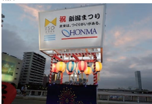
新潟まつり大民謡流し参加