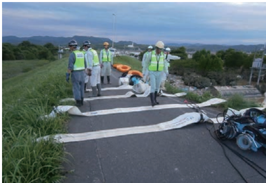
西日本豪雨 災害応援緊急出動