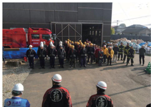
重要文化財の消防訓練への協力