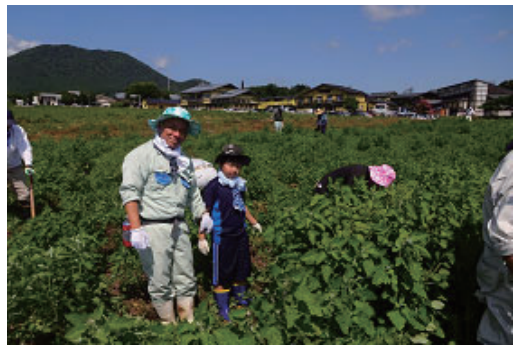
耕作放棄解消支援活動への参加