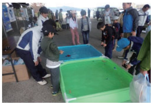
水島港みなと親子学習会