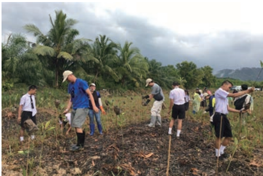
タイにおける植林活動