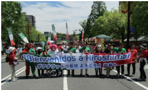
フラワーフェスタ パレード参加