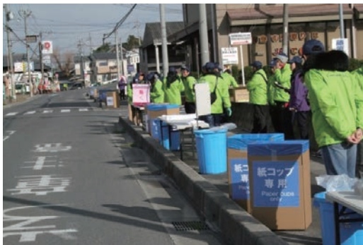
奈良マラソン給水ボランティア