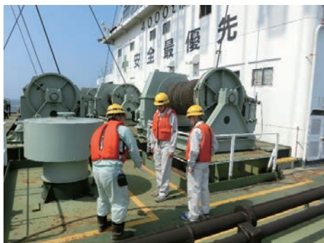
科学技術高校インターンシップ