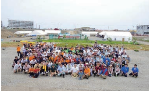
ひまわりプロジェクト2018を開催