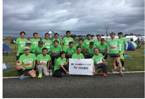
みやぎ復興マラソン2018に参加