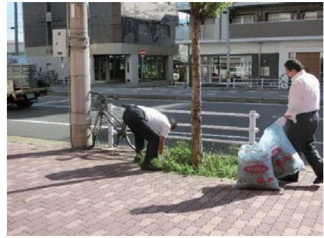
まちかどクリーン作戦参加