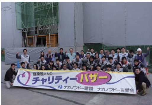
建築屋さんのチャリティーバザー