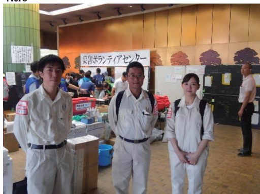
茨木市災害ボランティア