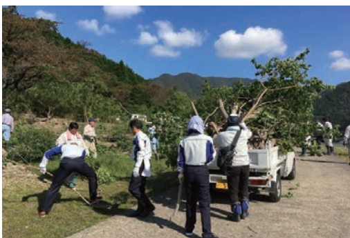
永源寺ダム湖岸クリーン作戦