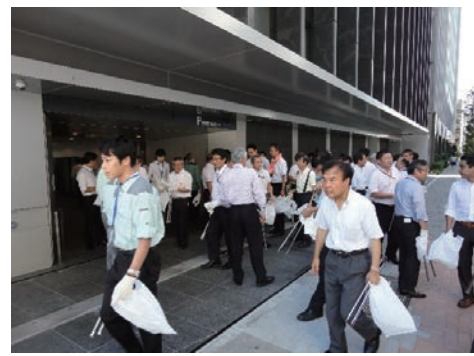
道路清掃・美化活動