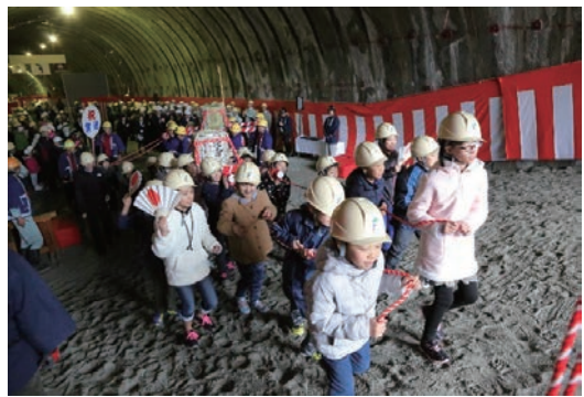
松ヶ鼻トンネル貫通式