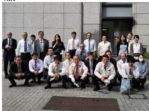
仙台まち美化サポート