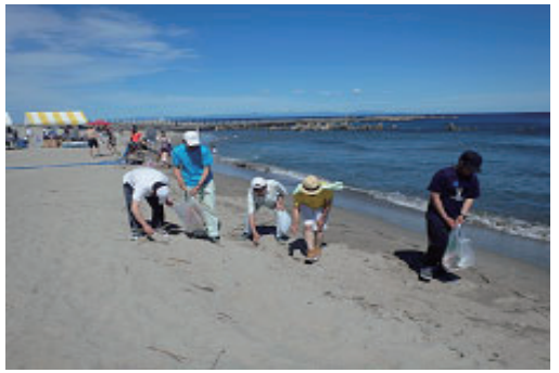
ビーチライフIN新潟への参加