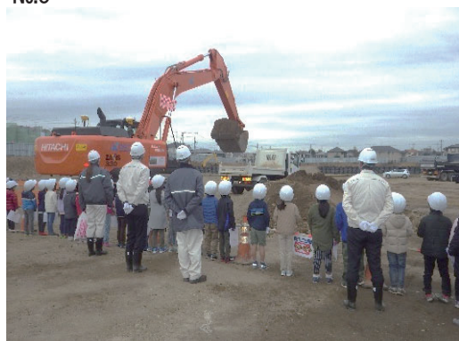
地元小学生への体験学習