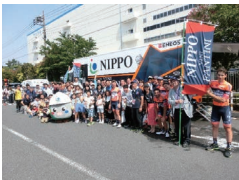
自転車ロードレース競技の振興