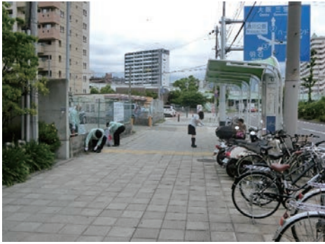
まちかどクリーン作戦参加