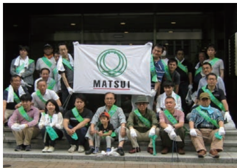
東京都中央区の環境美化活動へ参加