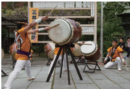
地域行事への参加