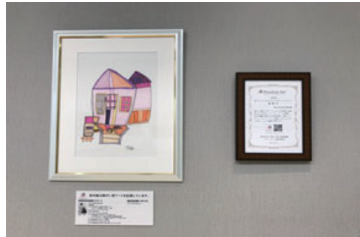
パラリンアートに協賛