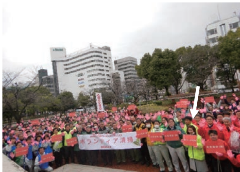
ボランティア活動参加