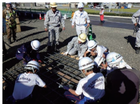
職場体験会の実施