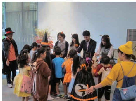
地域行事への参加