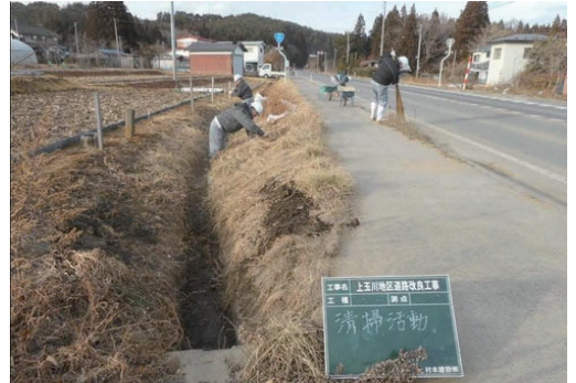
上玉川地区道路改良工事作業所清掃活動