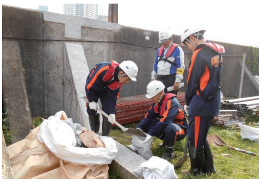
中学生職場体験学習