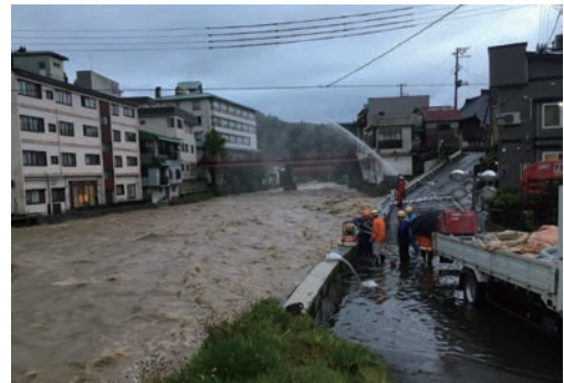
豪雨時の排水作業