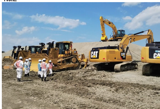
インターンシップの受け入れ