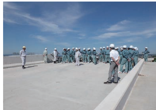
工事現場見学会（高校生）