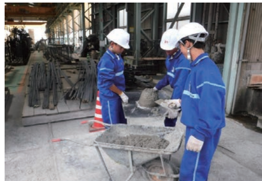
中学生職場体験学習