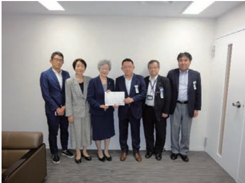
「世界の子どもにワクチンを」協力