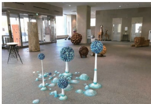
ロビーにおける美術作品展の開催