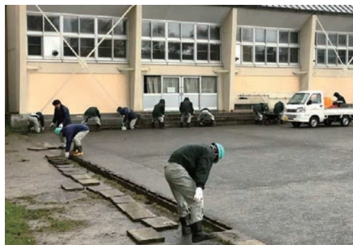
小学校グラウンドの側溝清掃