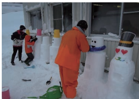
桑島雪だるままつり