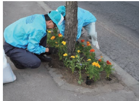
植樹枡花植え風景