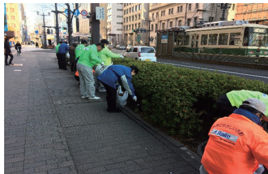
ボランティアロード活動(広島)