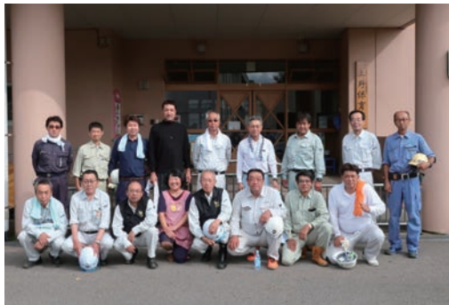
地域貢献ボランティア