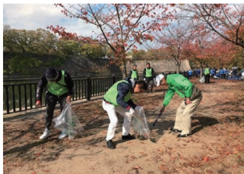
大阪マラソン クリーンUP作戦