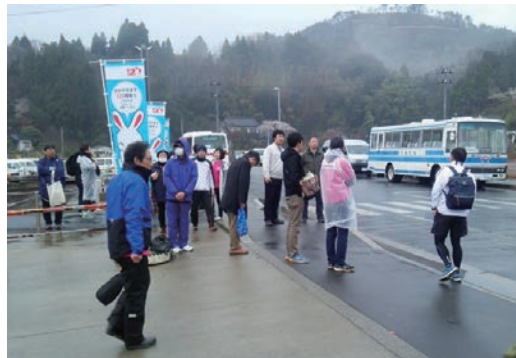
つばきマラソン大会ボランティア