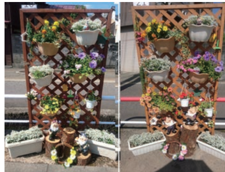
花と緑のプロジェクト参加