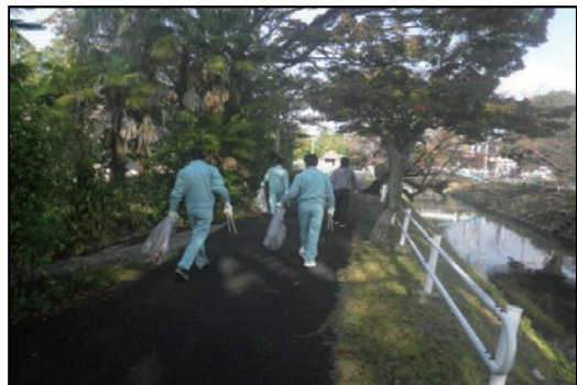
「川を愛する週間」河川清掃