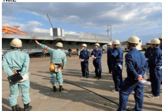
大阪工場見学会の開催