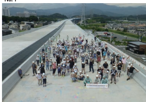
高森第二高架橋現場見学会開催