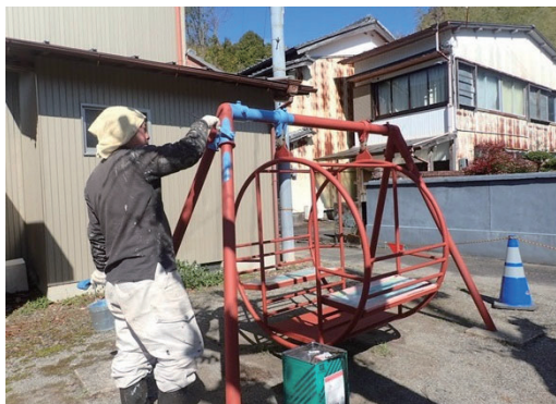
公園遊具の塗り替え