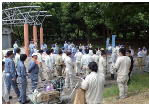
清掃前の集合写真