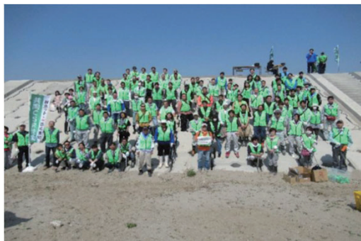
広瀬川一万人プロジェクト