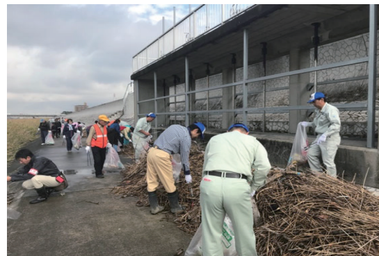
庄内川・新川クリーン大作戦