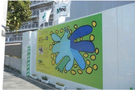
まちかど障がい者アートギャラリー