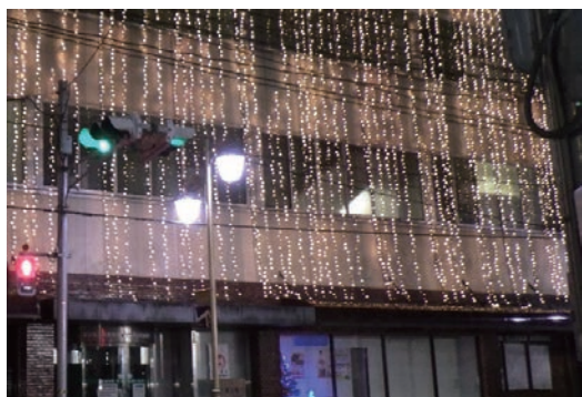
イルミネーションプロジェクト