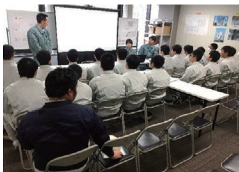
高校生を招いた現場見学会