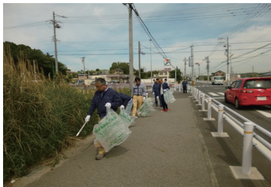
愛・道路パートナーシップ事業