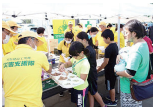
厚真町への炊き出し支援活動