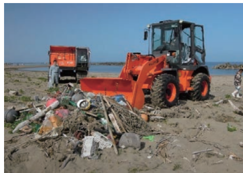
クリーン・ビーチいしかわin金沢