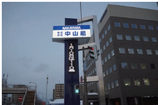
電子掲示板による防犯啓発の発信