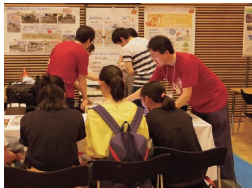
夏のリコチャレ2018に参加