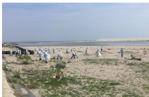
スマイルサポーター海岸清掃活動