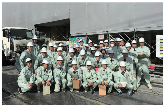
工業高校生40名作業所見学会受入