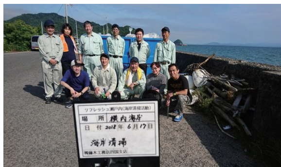
リフレッシュ瀬戸内海岸清掃活動