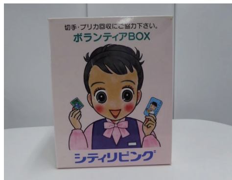
使用済み切手の収集