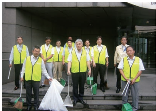
港区舗道清掃活動（本店周辺）