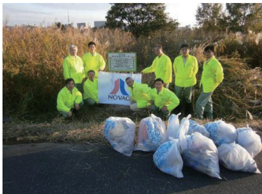
荒川水辺サポーター活動