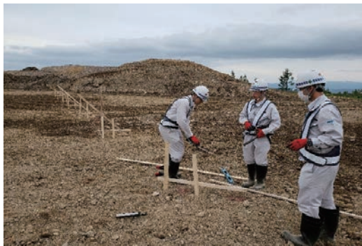
5dayインターンシップ