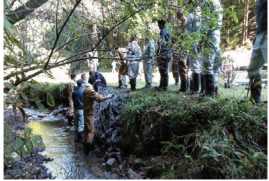
御前山ビオトープ育成活動（11月）