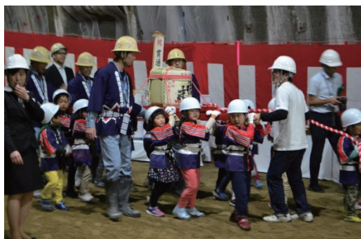
地元の保育園児らを招待して貫通式