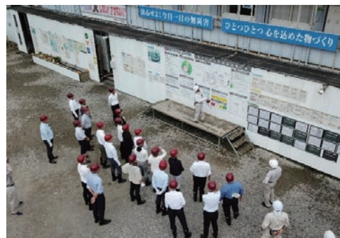
現場の安全管理を体験