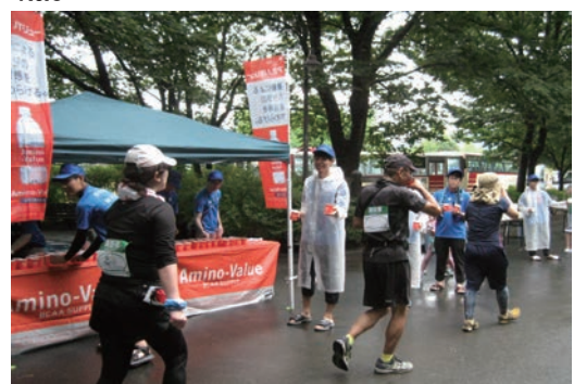
小布施見にマラソン