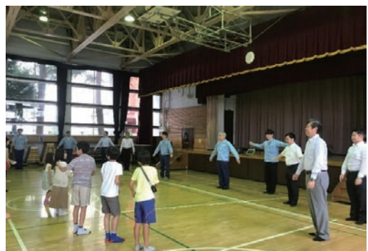
津久戸小学校『ラジオ体操』指導員