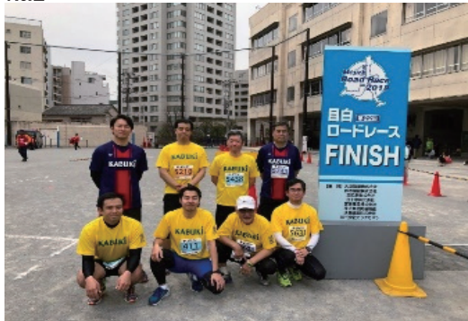
目白ロードレースへの協賛・参加