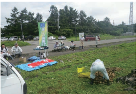
美しい田園21 耕作放棄地対策支援