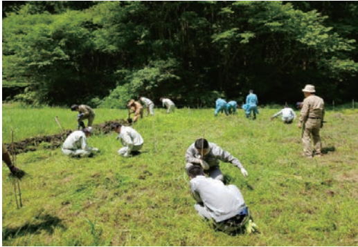
御前山ビオトープ育成活動（6月）