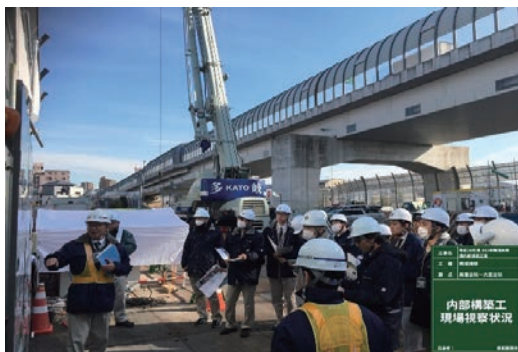
現場見学会の開催