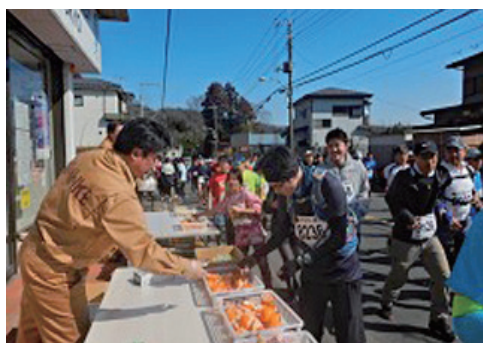
青梅マラソン大会を応援