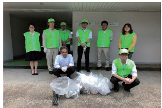
彩の国ロードサポート制度への参加