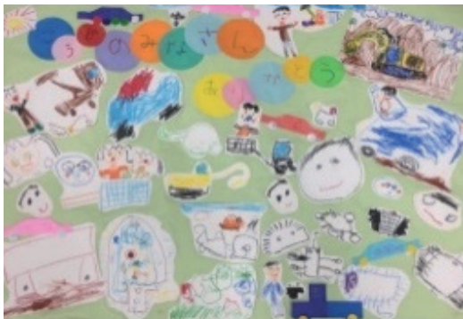
保育園での職業体験会