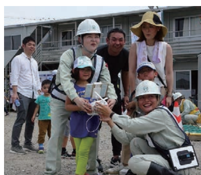
けんせつ小町活躍現場見学会