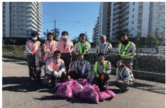
愛・道路パートナーシップ事業