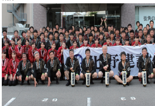
長野びんずる祭り