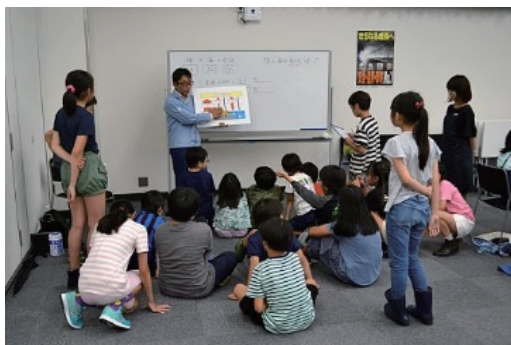
クマさんの環境教室