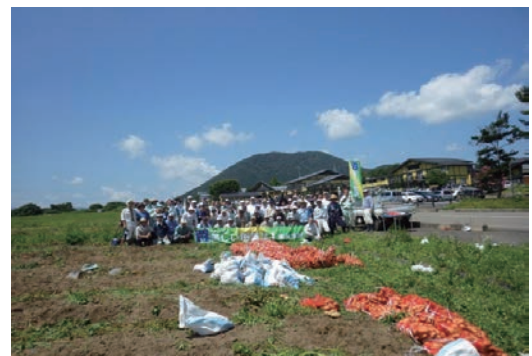
美しい田園21 耕作放棄地対策支援