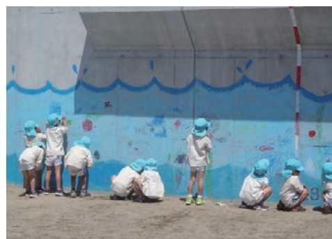
幼稚園児によるお絵かき会を開催