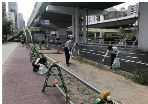
大阪サミットクリーンUP作戦