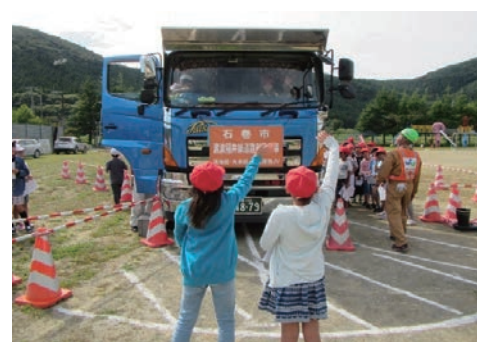
交通安全出前講座を実施