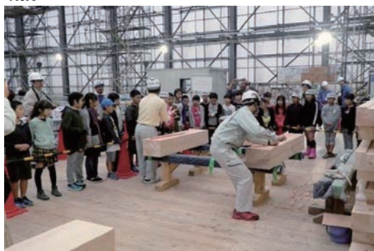
平城宮で地元小学生向け見学会を開催