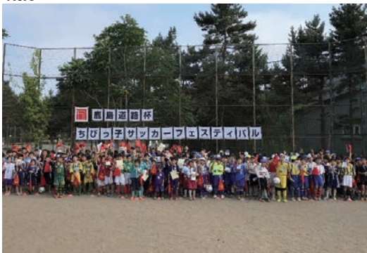
ちびっこサッカーフェスティバル