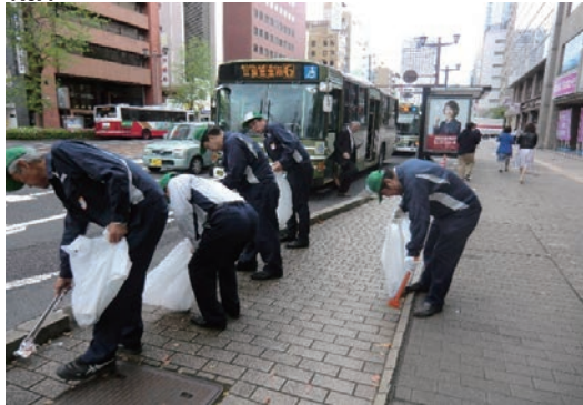
ボランティア・ロードの清掃活動