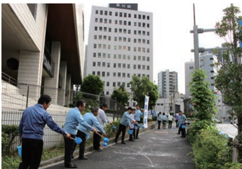
首都圏支店 打ち水大作戦