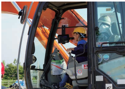
重機の操縦を体験