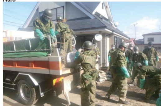
当社提供の車両で作業する自衛隊員