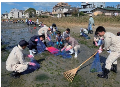
清掃活動&lt;和白干潟あおさ清掃&gt;