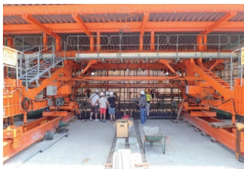
現場見学会の実施