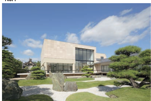
芸術文化活動 北野美術館