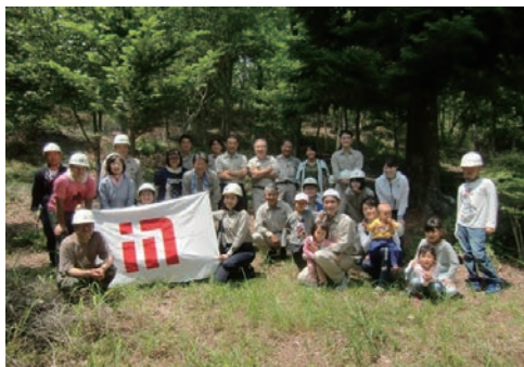
愛知県「企業の森づくり」に参画