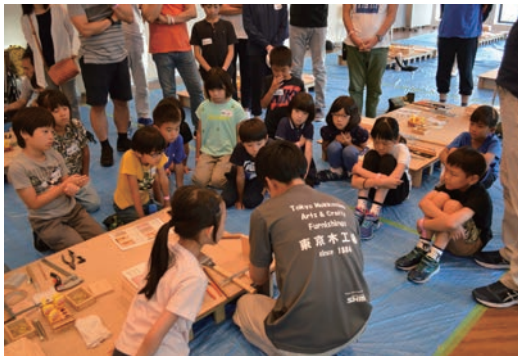
子どもたちへの木育活動