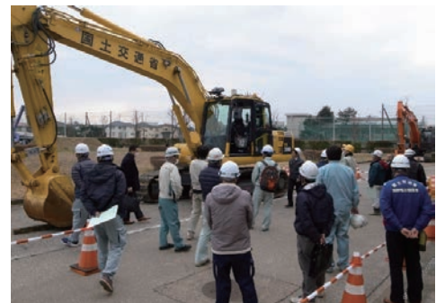
バックホウの遠隔操作を講義