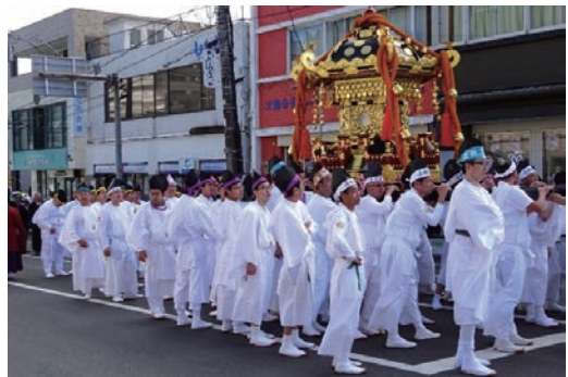
釜石まつり・台風19号 災害復旧ボランティア