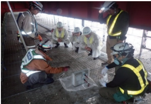
インターンシップの受け入れ