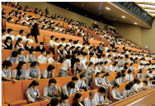
歌舞伎鑑賞会に地元中学生を招待