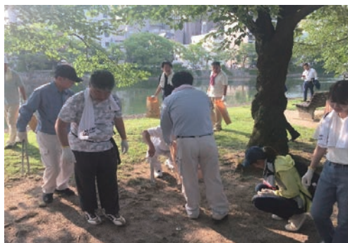
平和記念公園の一斉清掃