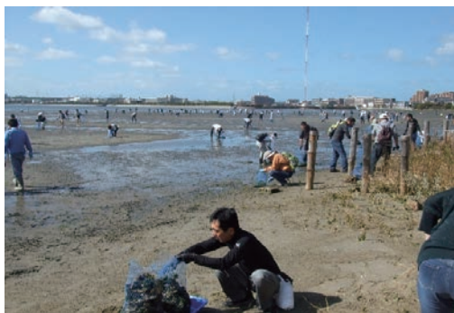
和白干潟あおさ清掃活動