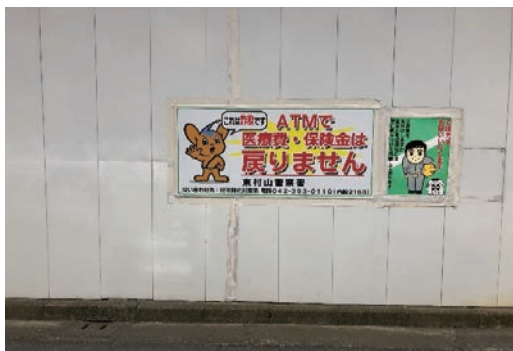
防犯・詐欺対策パネル製作～掲示