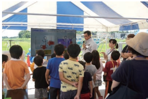
つくばちびっ子博士2019