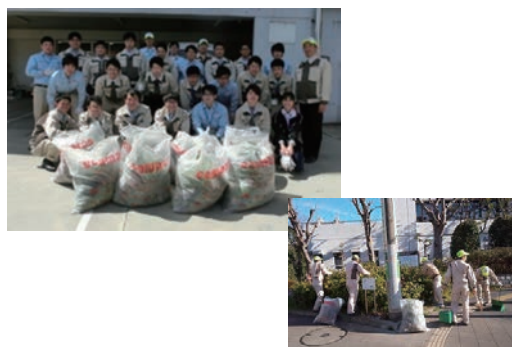
ボランティアサポートプログラム