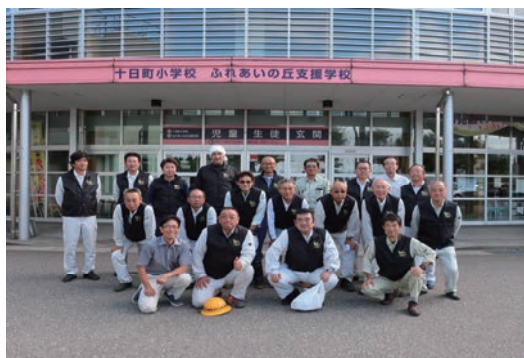
地域貢献ボランティア