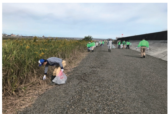
庄内川・新川クリーン大作戦