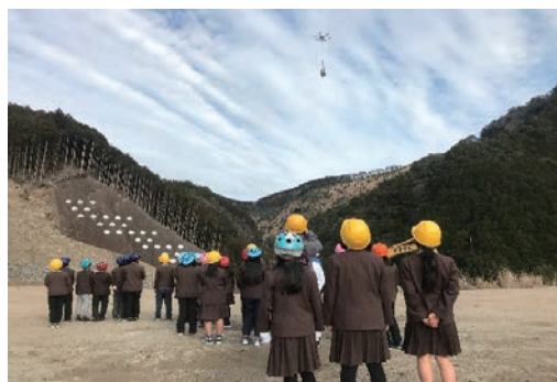
近隣小学校の防災学習への参加