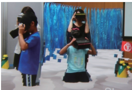
親子防災教室（防災AR体験）