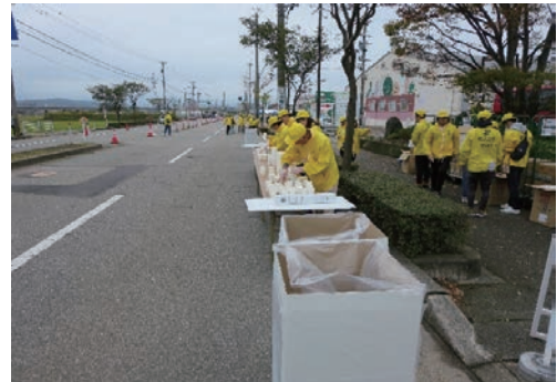
金沢マラソンボランティア