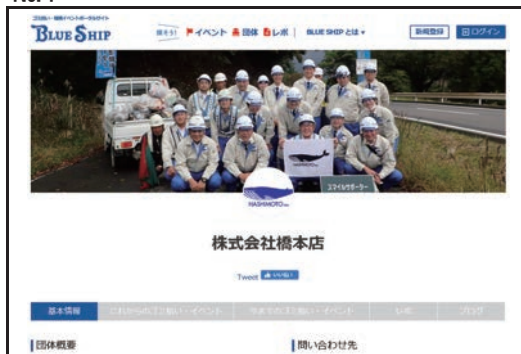
ブルーシップへの加入