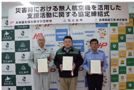
支援活動に関する協定