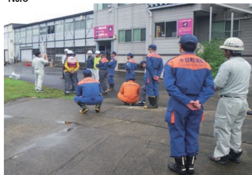
災害時におけるドローン支援協力