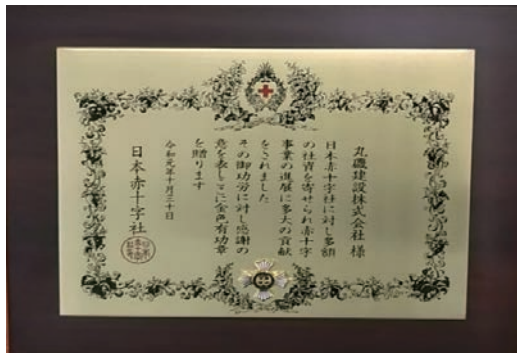
日本赤十字社への寄付