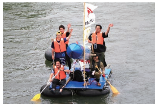
十勝川イカダ下り