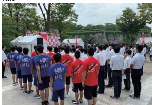
大阪城コンクリートカヌー競技大会