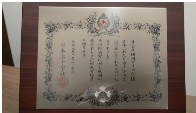
日本赤十字社銀色有功章 (盾)