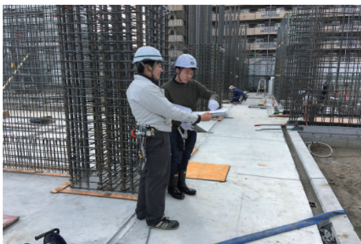
インターンシップの受入