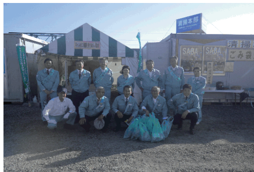
2019佐賀バルーンフェスタ