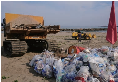
クリーンビーチいしかわ