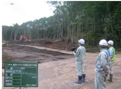
インターンシップ(北海学園大学生)