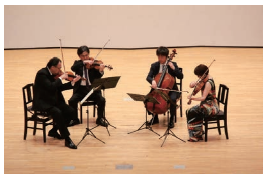
クラシック謝恩コンサート