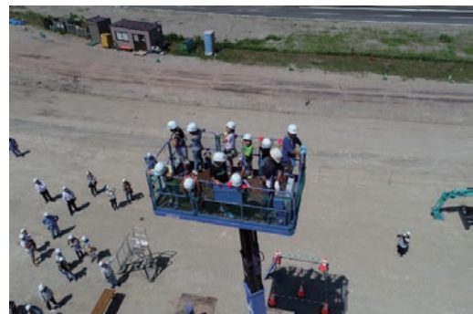
夏休み親子体験会