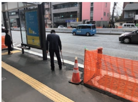
本社ビル周辺清掃活動