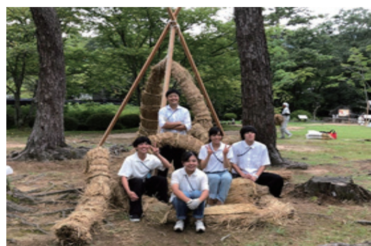
建築学生ワークショップ出雲に協賛