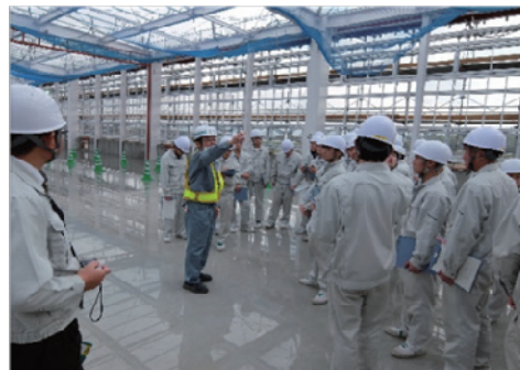
高校生を対象とした現場見学会を開催