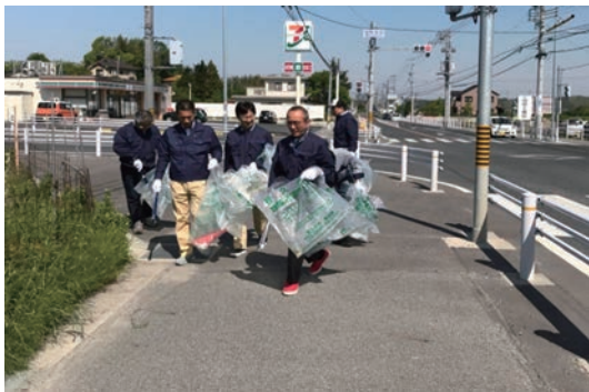
愛・道路パートナーシップ事業