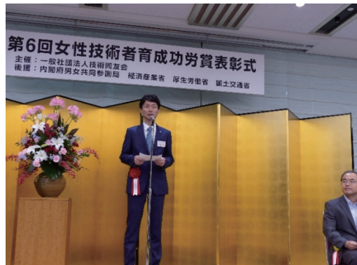
女性技術者育成功労賞表彰式