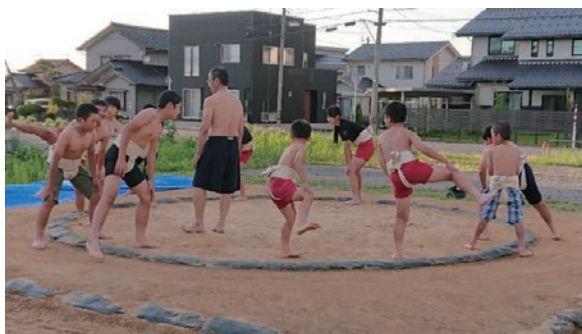
地元児童への相撲場の提供