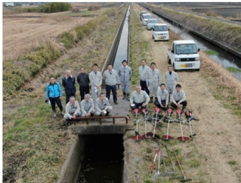
水路清掃後の集合写真