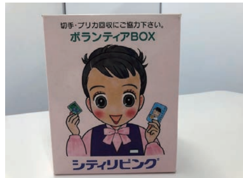
使用済み切手の収集