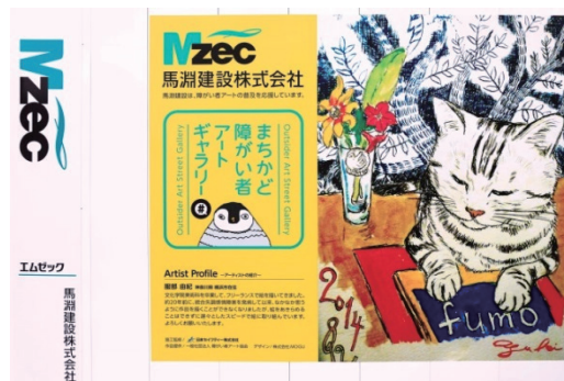
まちかど障がい者アートギャラリー