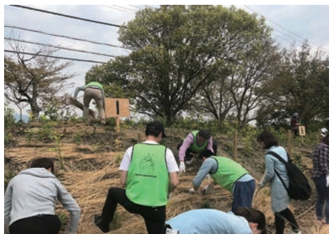
植樹プロジェクトへ参加