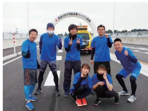
国道359号砺波東バイパス記念ラン