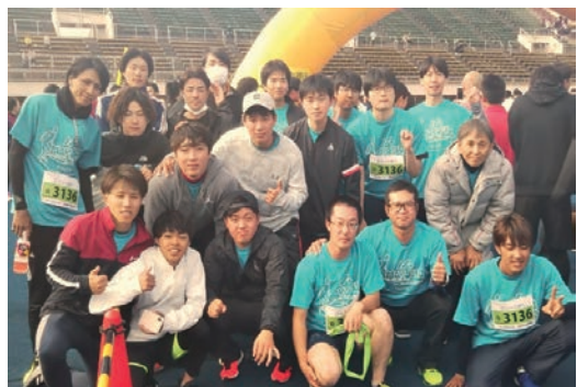
第9回仙台リレーマラソン