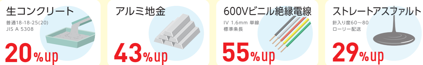
資材のUP率: (一財) 建設物価調査会の建設物価 2024年5月号掲載価格(東京)と2026年5月号掲載価格(東京)との比較