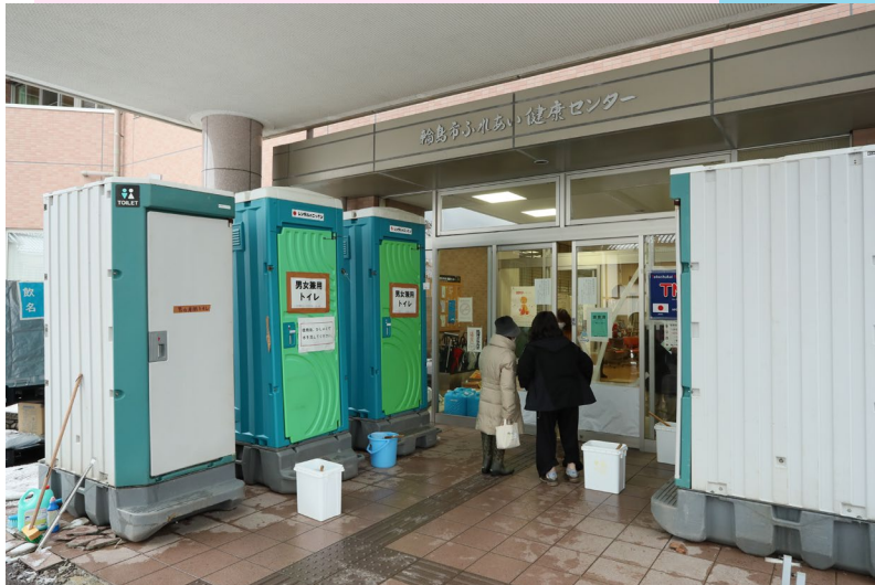
仮設トイレの設置 (輪島市ふるあい健康センター)