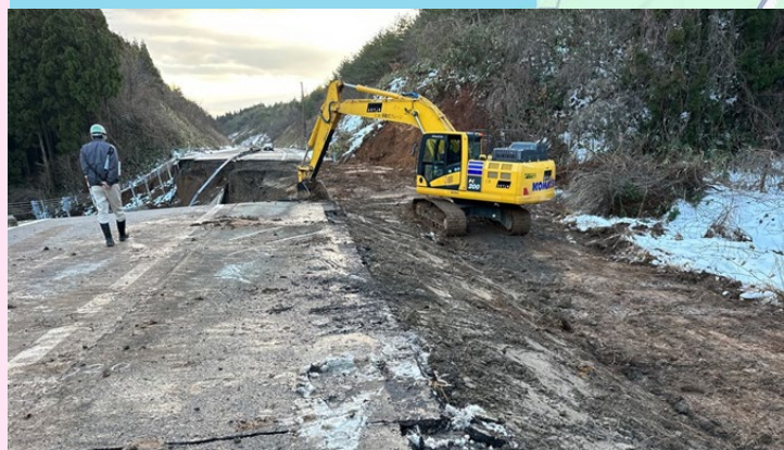
能越自動車道(穴水道路)の道路啓開作業