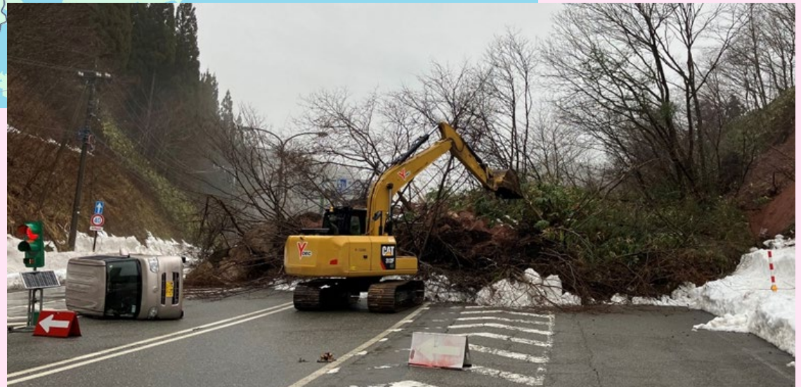
珠洲道路(穴水—珠洲間)の啓開作業