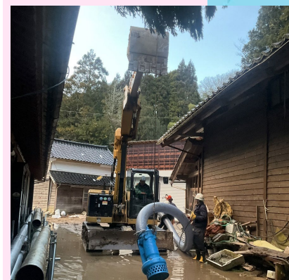
広地川応急対策作業