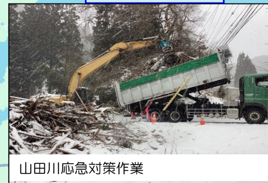
山田川応急対策作業