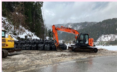
河原田川(市ノ瀬地区)応急対策作業

担当: 鹿島建設 担当: 清水建設 担当: 大成建設 担当: 佐藤工業 担当: 五洋建設