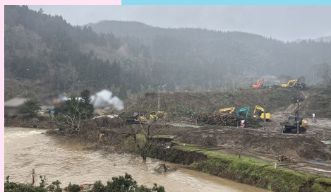
河原田川(熊野地区)応急対策作業