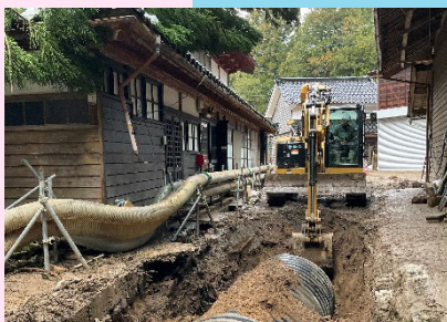
広地川応急対策作業