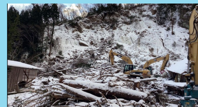
山田川応急対策作業