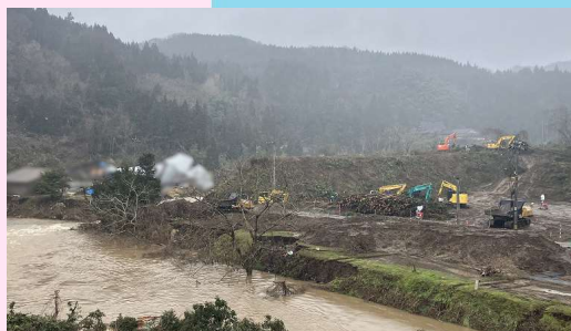
河原田川(熊野地区)応急対策作業