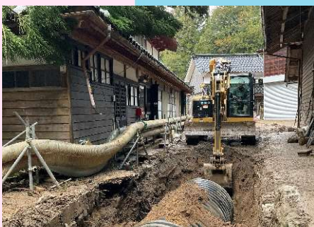
広地川応急対策作業