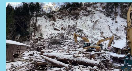
山田川応急対策作業