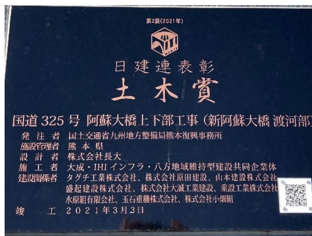
Fig.8 土木賞受賞プレート※

※阿蘇大橋上下部工事は、多くの課題を克服して2020年度内の開通を実現し、土木技術に対する社会的評価の向上に大きく貢献するものであることが評価され、第2回日建連表彰土木賞を受賞されています。