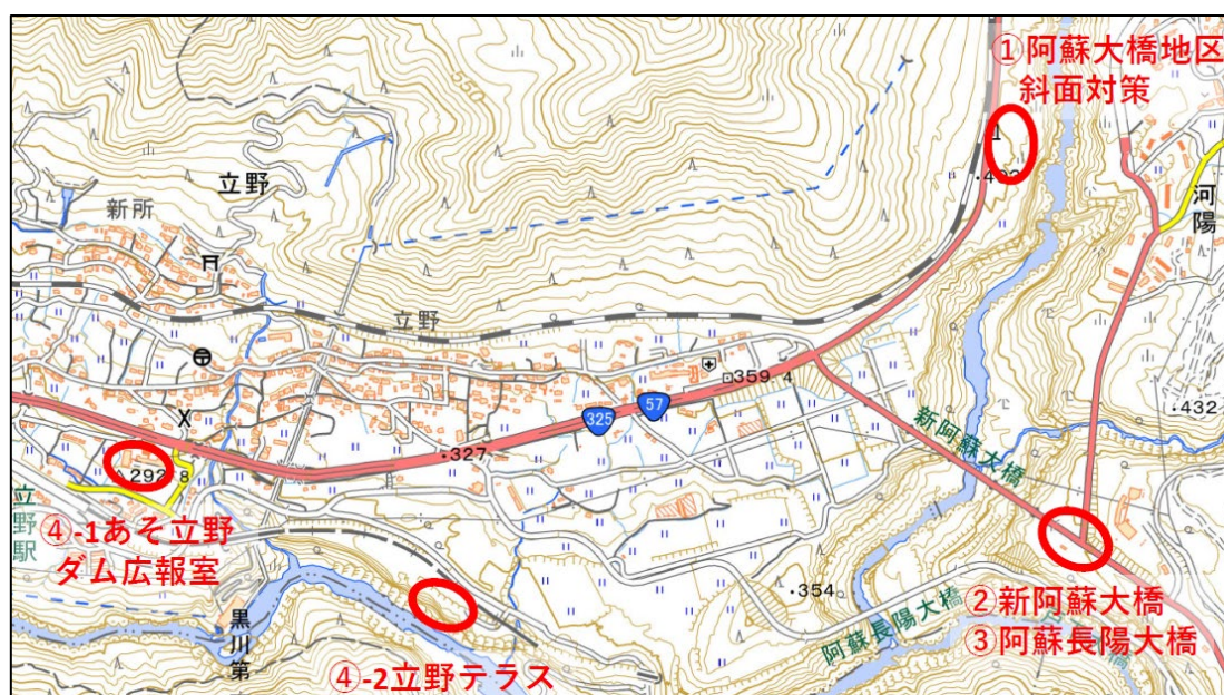
Fig.1 視察箇所（南阿蘇地域）