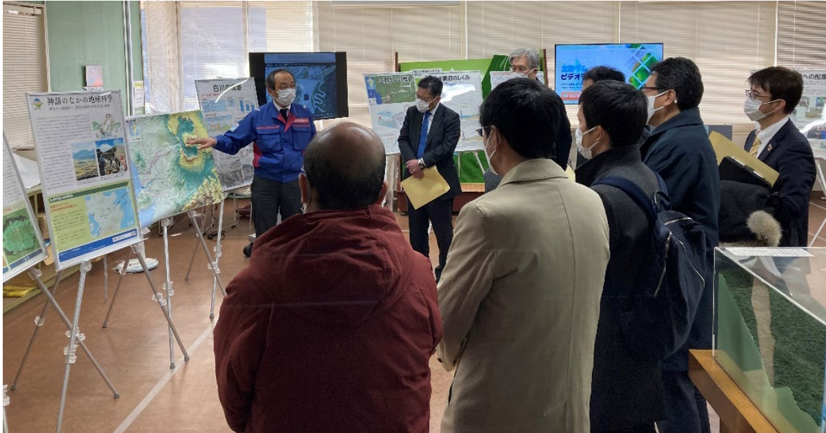
Fig.9 あそ立野ダム広報室での概要説明

立野ダムについて、国土交通省 九州地方整備局 立野ダム工事事務所のご担当者様に当該工事の概要について説明を受けました。