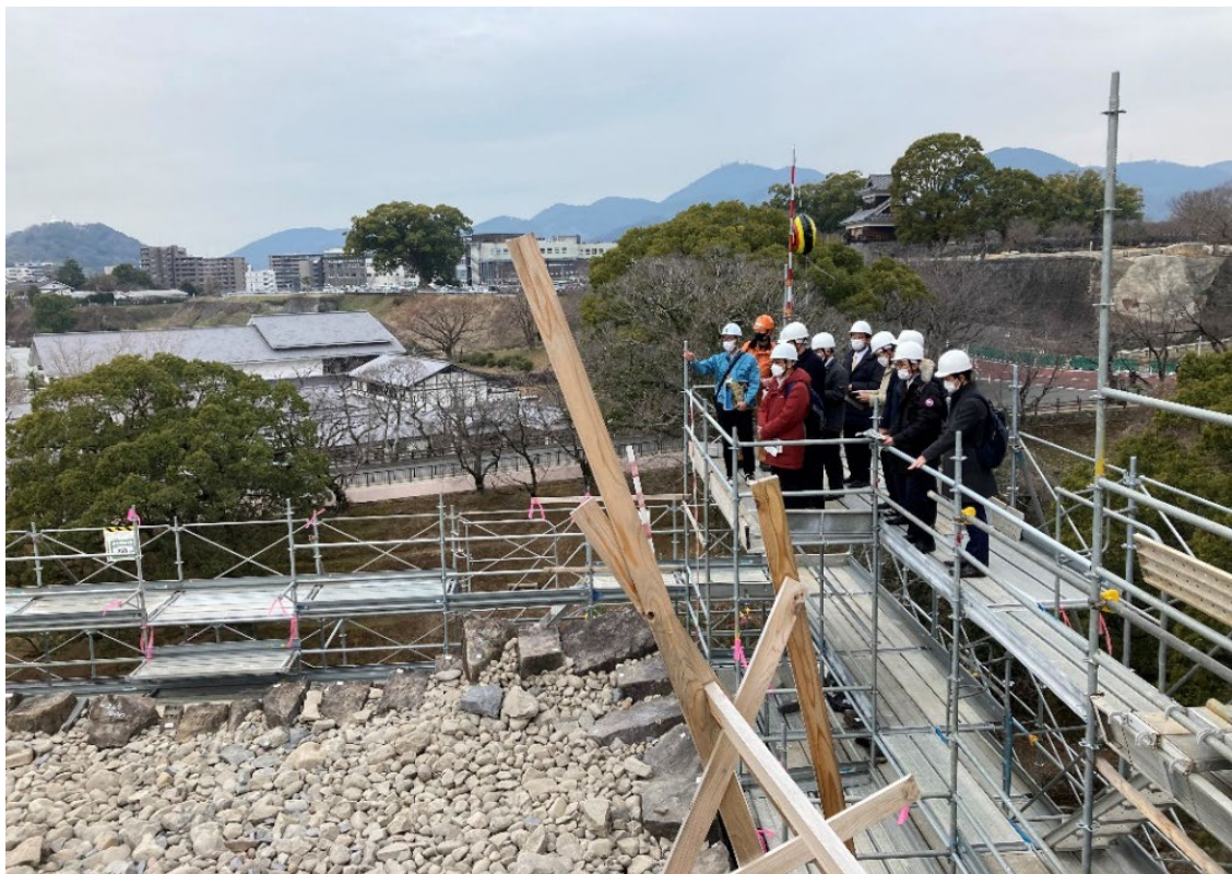
Fig. 12 飯田丸五階櫓石垣復旧工事状況の視察