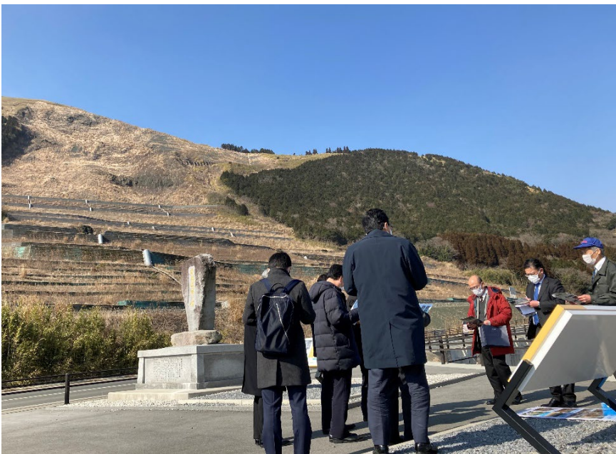
Fig. 4 数鹿流崩之碑展望所より復旧現場を視察