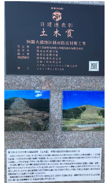
Fig. 5 土木賞受賞プレート※

※本工事は、緊急対策工事での高度な施工プロセス一体化により、安全かつ迅速に復旧工事が行われたことが評価され、第1回日建連表彰土木賞を受賞されています。