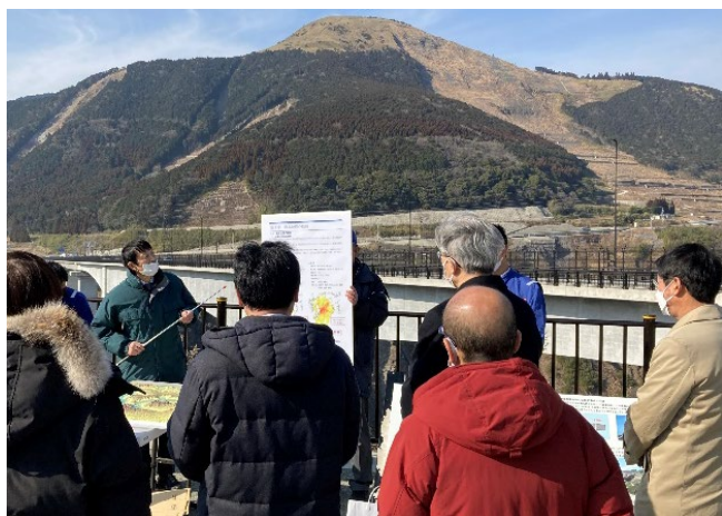
Fig.7 新阿蘇大橋展望所より両橋を視察