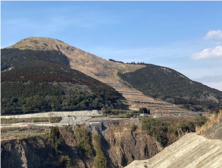
Fig. 2 阿蘇大橋地区斜面防災対策現場（全景）

阿蘇大橋地区斜面对策緊急対策工事・恒久的対策工事について、国土交通省 九州地方整備局 阿蘇砂防事務所のご担当者様より、当該工事の概要について説明を受けました。