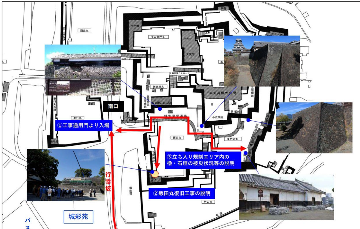
Fig. 11 視察箇所（熊本城復旧工事）

熊本城における石垣復旧工事を中心に、熊本市 熊本城総合事務所のご担当者様より、当該工事の概要について説明を受けました。